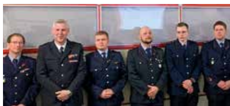
Ernennung von Funktionsträgern innerhalb der Gemeindefeuerwehr