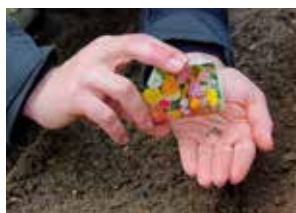
Gemüse- und Blumensaat