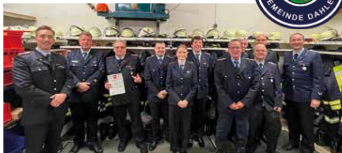
JHV Ortsfeuerwehr Dahlem