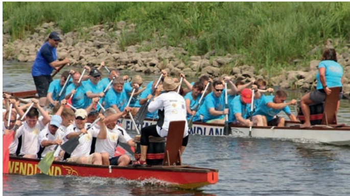
2. Bleckeder Drachenbootmeisterschaften 2017

Bis zum 11. Juni können sich wieder Mannschaften anmelden, die Spaß am Paddeln haben und bereit sind, den Teamgeist und den Siegeswillen auszupacken und mit vereinter Kraft zu paddeln.