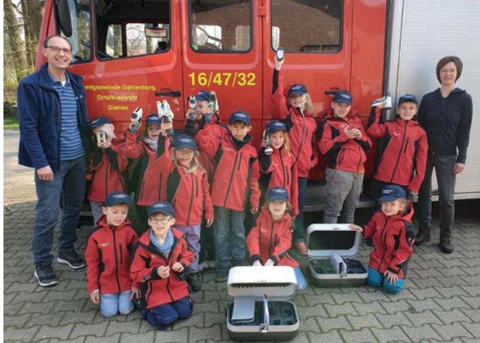
Kinder und Betreuer freuen sich über die gespendeten Werkzeugkoffer

Der Wert beider Koffer beträgt 1.298 Euro. Vielen Dank an die Firma Vorwerk „Geschäftsfeld Twerccs“.