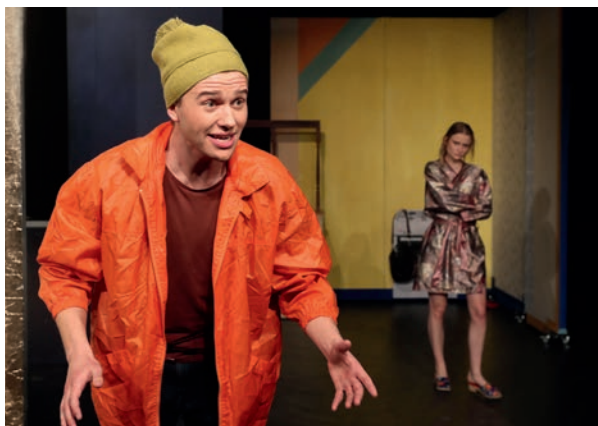
Spannendes und rasantes Theater für Kinder mit Rico und Oskar

Das spannende und rasante Theaterstück nach dem Kriminalroman für Kinder von Andreas Steinhöfel zeigt das Junge Staatstheater Parchim am Sonntag, 30. Juni 2019, ab 11:00 Uhr auf dem Bleckeder