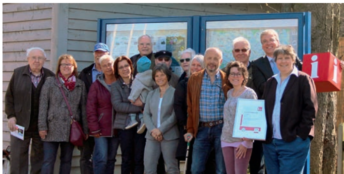
Bleckeder Gastgeber vor zwei der neu gestalteten Schaukästen

gebögen und die obligatorische Datenschutzerklärung ausgefüllt und sich damit ganz bewusst für eine Zusammenarbeit mit der Tourist-Information Bleckede entschieden. Die Tourist-Information Bleckede hat aktuell 228 Betten in zwei Hotels, 15 Ferienhäusern, 43