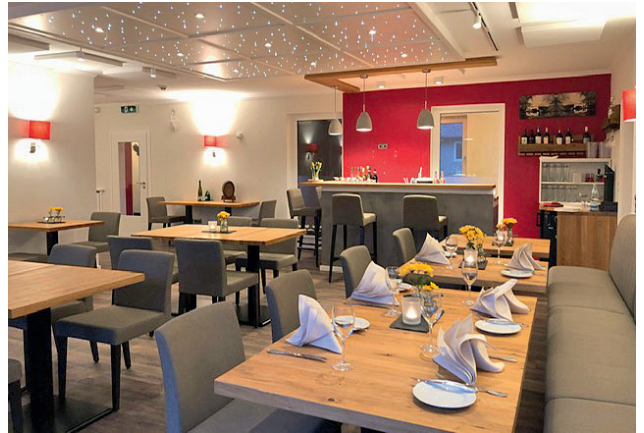
Das Bistro bietet Ambiente und kulinarische Highlights

Betrieb genommen und verwöhnt die Gäste mit saisonalen und regionalen Gerichten aus besten Zutaten mit hohem Bio-Anteil. Das gilt für Übernachtende ebenso wie für Einheimische, denn das Bistro und Restau-