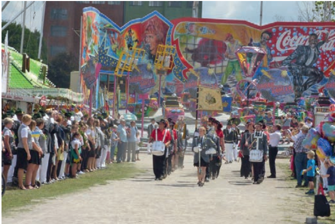
Das Bleckeder Schützenfest bietet zahlreiche Attraktionen für Groß und Klein

dann in der Hand der Kinder, für die ein umfangreiches Programm vorbereitet wird. Parallel dazu steht das Schießen der Königswürde von Groß bis Klein an. Nach der Pro-