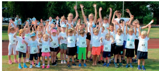
Der Moorlauf ist ein sportlicher Spaß für die ganze Familie

Folgende Strecken stehen zur Auswahl: Kinderlauf 400 m für die Kleinsten, Kinderlauf 1.200 m bis 10 Jahre, Moorlauf 4.600 m, Moorlauf 8.800 m, Walking 6.700 m, Nähere Info und Anmeldung unter www.moorlauf.de .