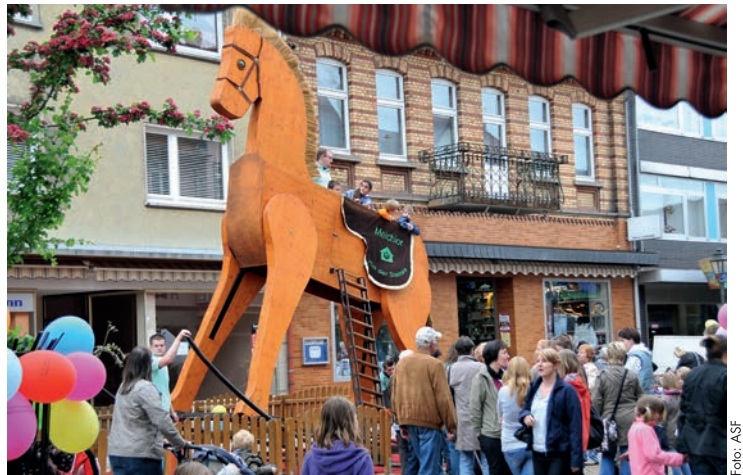
Gern gesehener Gast auf jedem Kinderfest: Das Riesenschaukelpferd Melchior sorgt für jede Menge Spaß in luftiger Höhe.

Im Übrigen: Wer selber eine Aktions- oder Standidee für ein spannendes und spektakuläres Kinderfest hat, kann sich gern mit