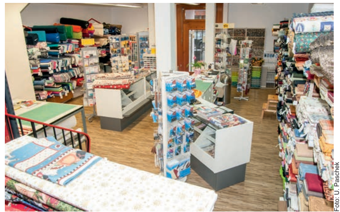
Bei dieser Auswahl wird jeder fündig, die Ware kann im neuen Laden in Bleckede attraktiver präsentiert werden

Wolfgang Pakirnis repariert und wartet Nähmaschinen aller Fabrikate. Auch eine neue Qualitäts-Nähmaschine finden Sie in der Stoffdiele.