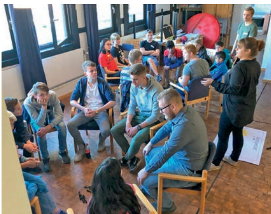
Die Jugendlichen trugen ihre Wünsche zusammen

Das zweite Projekt soll ein Jugendtreff in Form eines Containers werden, welche die Kinder und Jugendlichen mit örtlichen Bauunternehmen, Handwerkern und der Stadt gemeinsam gestalten und ausbauen wollen. Hierfür sammelten sie erste Ideen für