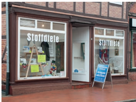
Stoffe & mehr jetzt direkt in Bleckede

Zukünftig soll Strumpfstrickwolle wieder in das Sortiment aufgenommen werden. Ein Besuch lohnt sich, lassen Sie sich kompetent beraten.