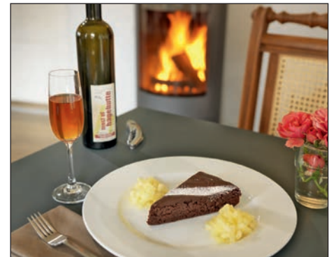
Weihnachten ohne Stress. In der appleslounge können Sie sich vom Weihnachtstrubel erholen.

Die Öffnungszeiten während der Feiertage: 24.12. ist geschlossen, am ersten und zweiten Weihnachtstag ist von 13 bis 20 Uhr geöffnet, Sylvester ist geschlossen.