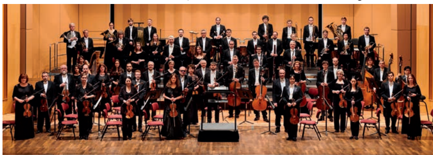
Das Göttinger Symphonie Orchester