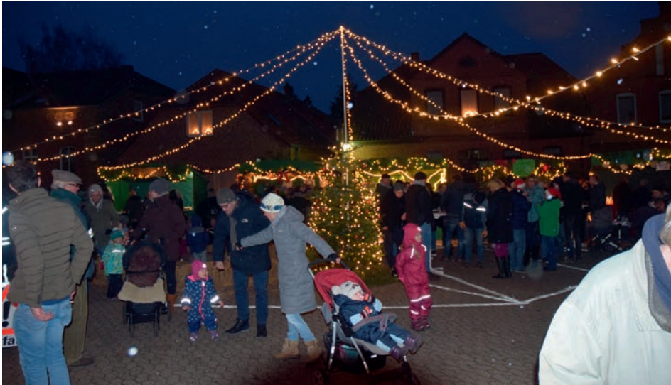
Der Dahlenburger Weihnachtsmarkt bietet Vielfältiges für Groß und Klein