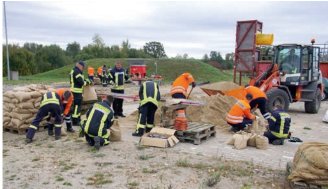
Sandsackfüllung mit Maschine und per Hand

am darauf folgenden Wochenende wurden weitere 30 Einsatzkräfte aus dem Landkreis in Deichverteidigung geschult.