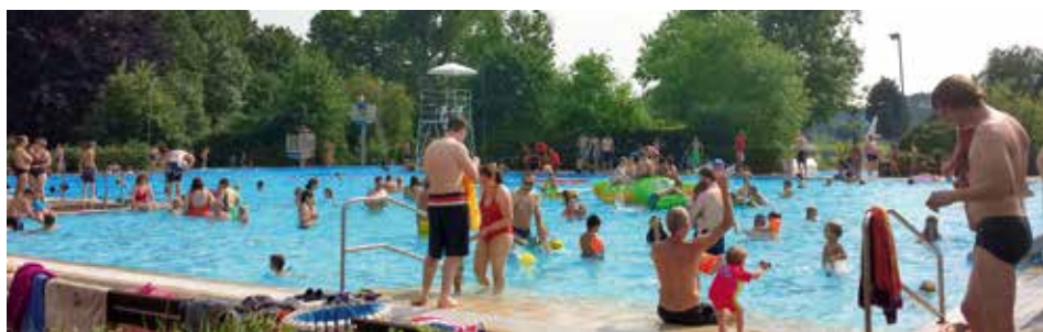
Spaß im Freibad Dahlenburg