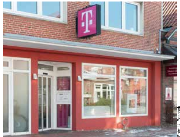
Telekompartner dancom. ist seit 3. März in der Breiten Straße 19

Sind das Mobiltelefon oder andere Kommu-