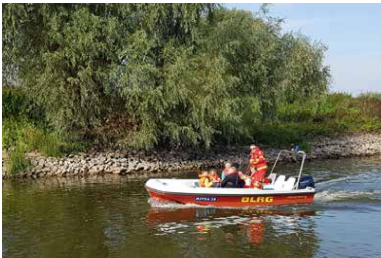
Highlight beim Sommerfest 2017 waren die Fahrten mit dem Rettungsboot auf der Elbe

wachsene Schwimmer unter der Leitung von Urte Davidovic erfreute sich 2017 wieder einer regen Beteiligung. Immer dienstags von 20 bis 21 Uhr findet das Aquajogging (im Herbst/Winter in Bleckede, im Sommer im Freibad) statt, bei dem sich eine lustige Truppe von momentan 15 Teilnehmern