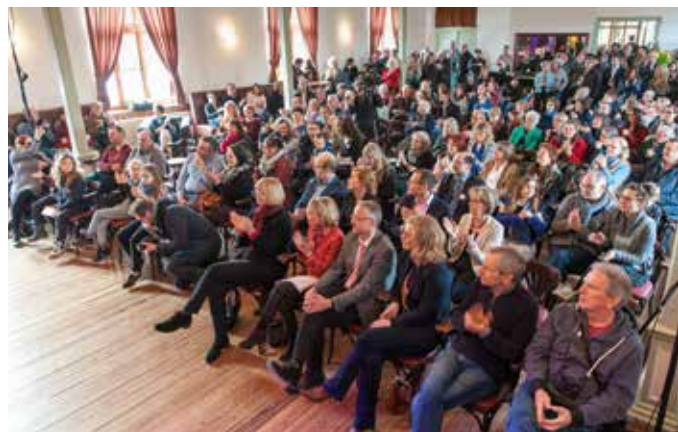
Das Publikum bei den Eröffnungsreden