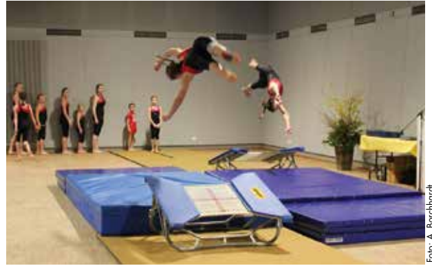
Vorführung des TuS Barskamp