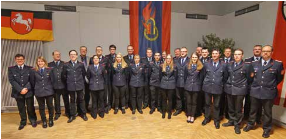
JHV der Schwerpunkfeuerwehr Bleckede

Mitglieder Einsatzabteilung: 24 Einsätze 2017: 4 (2 Brandeinsätze, 2 technische Hilfeleistungen)