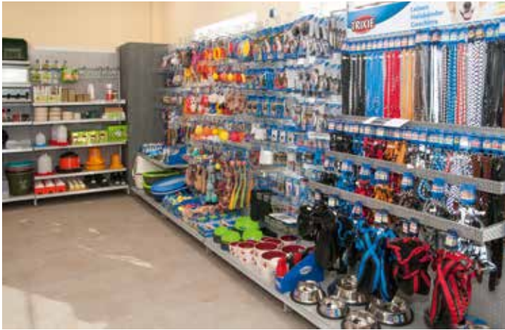
Hundezubehör vom Napf bis hin zum Spielzeug

Kommen Sie zur großen Neueröffnung am 23. und 24. März und greifen Sie bei den zahlreichen Angeboten mit attraktiven Preisen an beiden Tagen zu. Beispielsweise bei der 10 Liter-Gießkanne für 1,00 Euro, dem Mähroboter für 399,00 Euro oder bei Hornveilchen und Stiefmütterchen für den Frühlinggarten für 0,29 Euro. Außerdem wird ein Gewinnspiel mit tollen Preisen veranstaltet. Im alten Markt findet zugleich ein großer Abverkauf statt, bei dem sich sicher so manches