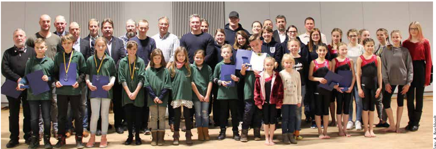
Die geehrten Sportlerinnen und Sportler 2018