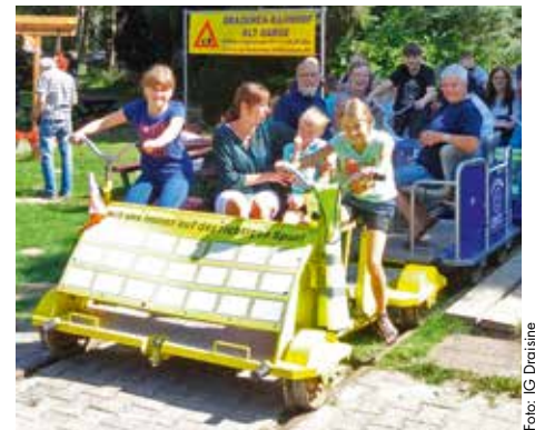
Draisinefahren ist ein Spaß für die ganze Familie schoben werden.

Auf einer Fahrrad-Draisine haben vier Personen Platz, wobei zwei treten und zwei bequem sitzen können. Die beiden Zwischenwagen können für jeweils vier Personen zwischengekoppelt und gezogen bzw. ge-