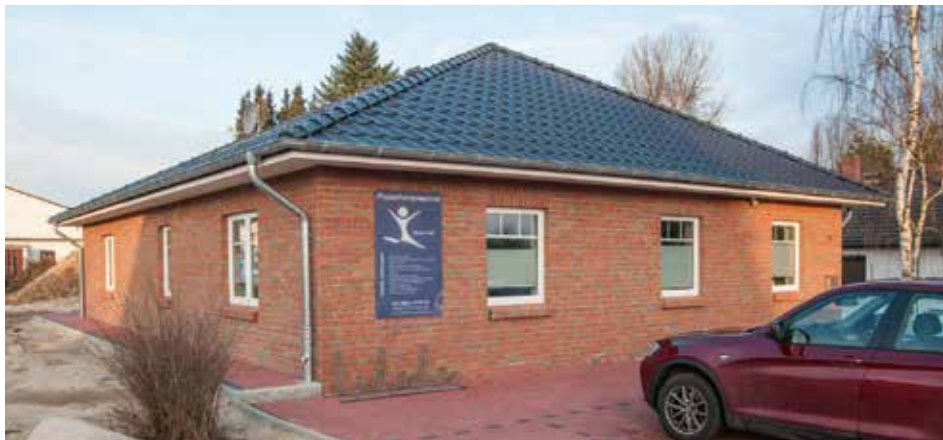
Das neue Praxisgebäude im Marienauer Weg 21

speziellen Gerät), CMD (Behandlung des Kiefers, z. B. mit Bisschienen bei Zähneknirschen), aber auch Ultraschall bei überlasteten Sehnen und Muskeln bei Sportverletzungen gehören zu den Leistungen der Praxis.