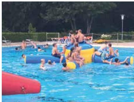
Kinderfest im Waldbad Alt Garge

[ Anke Borchhardt/ Mathias Dorn ] Der Winter verabschiedet sich, die ersten Blüten sprießen. Es ist also wieder an der Zeit, sich langsam Gedanken über die kommende Freibadsaison zu machen.