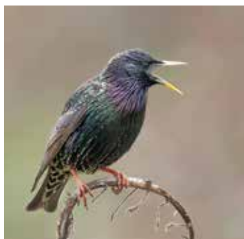
Star im Prachtkleid

Da „Starenkästen“ im Straßenverkehr unseren gefiederten Freunden nur indirekt von Nutzen sein können, lohnt es sich, den immer seltener in Gärten anzutreffenden Star, Vogel des Jahres 2018, mit einer geeigneten Nisthilfe anzulocken. Gerade jetzt, wo die Stare aus ihren Wintergebieten zurück nach