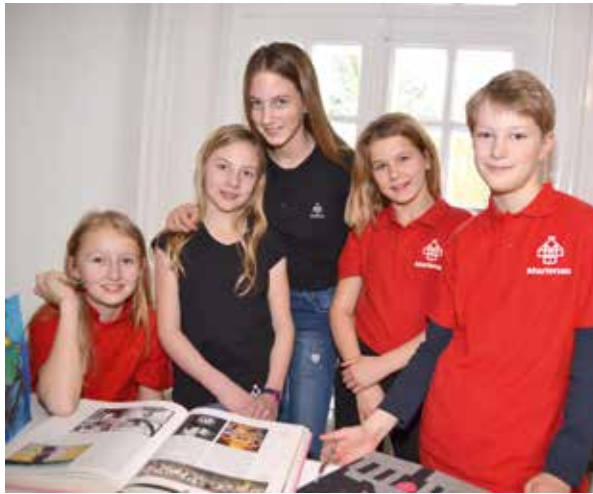
Marienauer Schüler präsentieren sich am Tag der offenen Tür auf der Bühne

Gespräche mit Eltern und Lehrern zu führen. Auf Wunsch können Termine für Einzelgespräche mit der Leitung über das Sekretariat vereinbart werden. Für die Schul- und vor allem die Internatswahl ist es ratsam, ge-