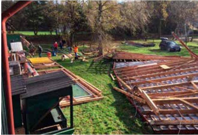
Der Sturm Ende Oktober 2017 richtete schwere Schäden an

Um die finanzielle Belastung des Wiederaufbaus besser stemmen zu können, wurde eine moderate Erhöhung der seit Jahren stabilen Mitgliedsbeiträge einstimmig beschlossen.