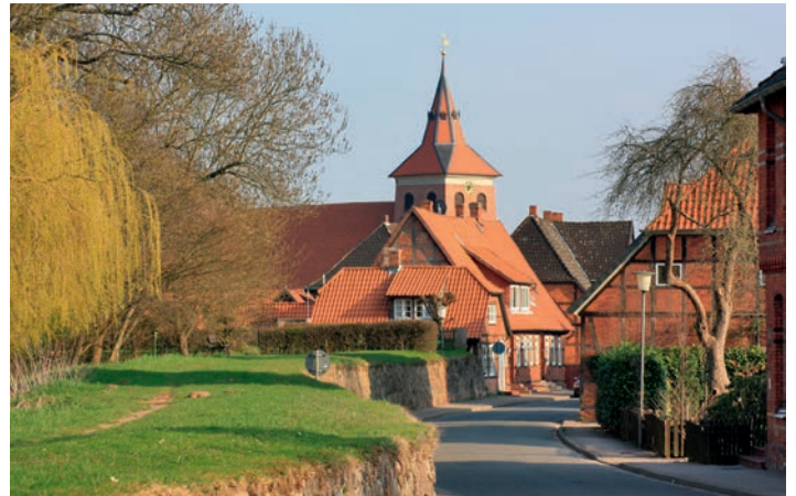
„Typische Bleckede“ - Siegerbild des Fotowettbewerbs 2016

Um den Einzelprojekten und der Innenstadtentwicklung insgesamt einen städtebaulichen Rahmen zu geben, hat die Stadt