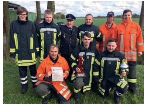
Sieger 2017 - die Feuerwehr Garlstorf (am Walde) mit dem neuen Wanderpokal

[ Carsten Schmidt ] 18 Gruppen der Feuerwehren und acht Jugendfeuerwehrmannschaften gingen beim 34. Garlstorfer Zehnkampf an den Start. Die Aufgaben waren vielfältig: Spiele mit Feuerwehrgeräten, Fragen zu den Fischbeständen in der Elbe, Erste-Hilfe und Wassertransport.