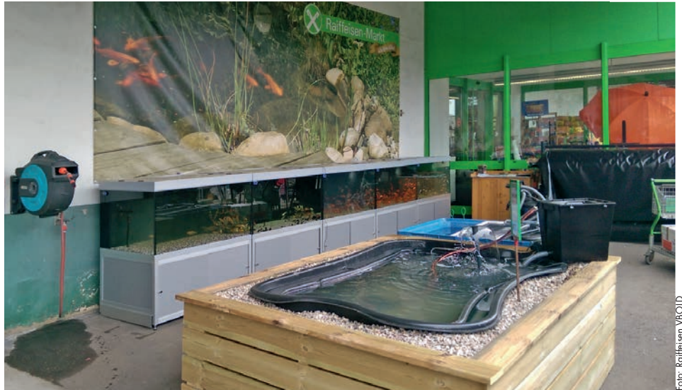
Alles für den Gartenteich finden Sie im Raiffeisenmarkt Bleckede

Für Gartenteichbesitzer stellt sich bei der Auswahl von Teichfischen oft die Frage, für welche Fische das eigene Gewässer geeignet ist. Bei der Auswahl von Teichfischen ist der Raiffeisen-Markt Bleckede, Fritz-v.-d.-Berge-Straße 42, Ihr kompetenter Ansprechpartner. Seit neuestem verfügt der Markt über fünf neue Fischbecken für Kaltwasserfische. Dort sind unter anderem die allseits beliebten Japan-Kois und Goldfische zu Hause. Aber auch andere Fische wie zum Beispiel der Graskarpfen, der Bitterling oder die Goldrotfeder. Das Highlight der neuen Fischbecken ist ihr Aussehen.