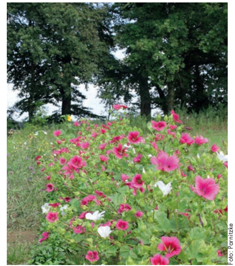
Blühflächen erfüllen wichtige Aufgaben im Ökosystem

Mit 15 €, 30€ oder 100 € im Jahr werden Sie Blühpate für eine 25 m 2 bis 100 m 2 große Blühfläche oder mehr. Ganz einfach unter www.bluehpate.de