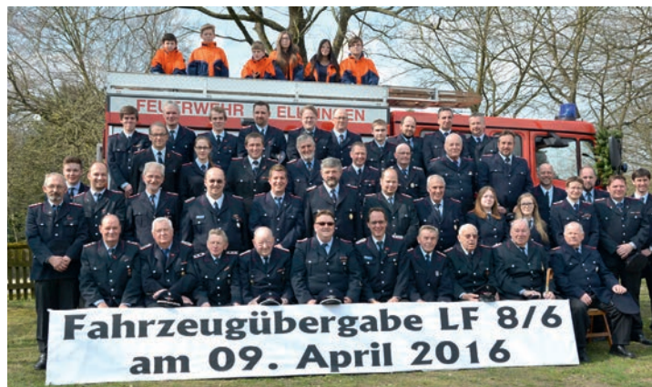
Eine starke und aktive Gemeinschaft - die Freiwillige Feuerwehr Ellringen feiert ihr 135-jähriges Jubiläum

Zunächst aber möchte die Feuerwehr Ellringen gemeinsam mit der Bevölkerung ihren Geburtstag im Rahmen der Samtge-