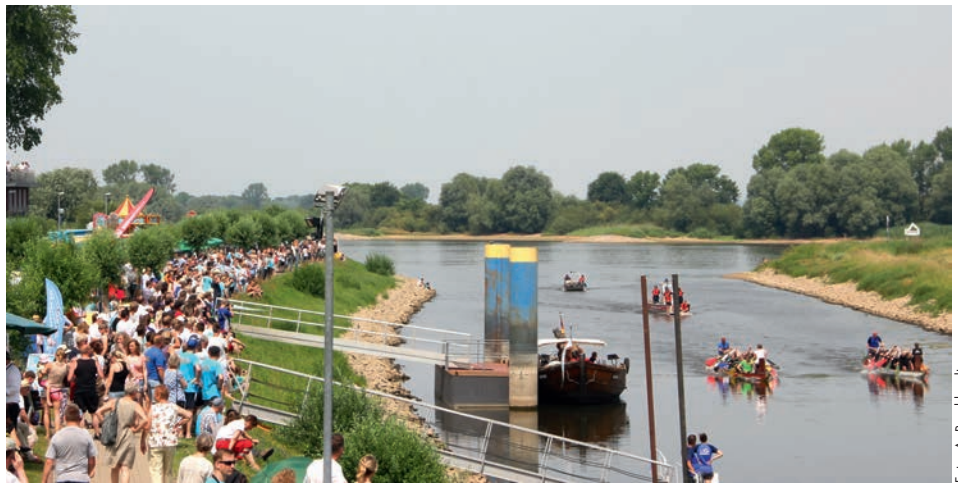
Die ersten Bleckeder Drachenbootmeisterschaften 2015 waren ein Publikumsmagnet

Zwölf Mannschaften kämpfen bereits am Sonntag, den 11. Juni um den begehrten Wanderpokal des Bleckeder Bürgermeisters. Eine Mannschaft muss aus 18 Paddlern sowie einem Trommler bestehen. Dies können zum Beispiel lose Gruppen mit Freunden und Nachbarn sein oder sich aus Vereinen, Verbänden, Firmen oder Organisationen bilden. Die Boote sowie die Steuermänner werden gestellt. Eine einheitliche Teamkleidung während der Rennen ist erwünscht. Das am besten kostümierte Team erhält einen Sachpreis. Mit einem knappen Vorsprung von 15 hundertstel