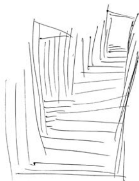
Skizze „Hauptwege und Nischen“ Johannes Kimstedt 2017