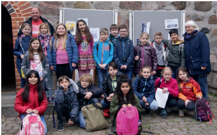
Spannendes erfahren die Dritt- und Viertklässler über die heimische Geschichte

Bevor sich die Kinder ins Gästebuch eintragen, haben sie Vieles zur wechselvollen Dahlenburger Regionalgeschichte erfahren: Das noch nahe 19. Jahrhundert begann mit den napoleonischen Befreiungskriegen an der Görhde, erreichte damit auch den kleinen Flecken und endete mit wachsendem