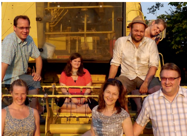
Das neue Stück der Ellringer Theatergruppe verspricht viel Spaß

Mit „Das Schweigen der Kühe“ hat sich die Truppe ein Stück ausgesucht, welches mit rd. 60 min. deutlich kürzer ausfällt, als die Vorgänger-Aufführung. Ebenso hat man sich von der Großstadt-WG wieder zurück in ländliche