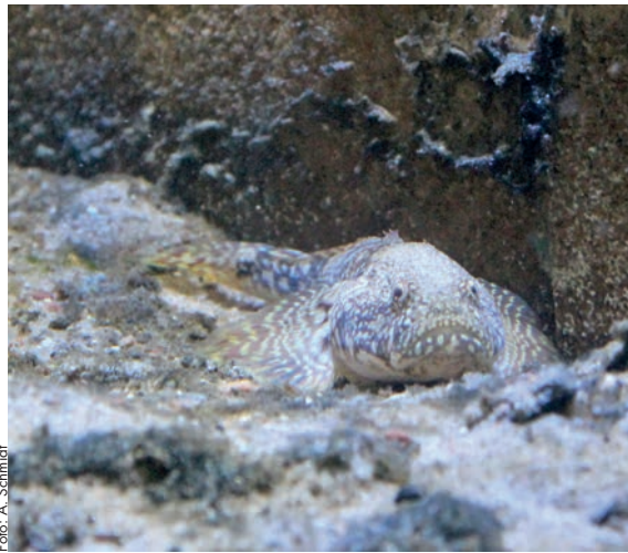
Kesslergrundel im Biosphaerium Elbtalau

Die Kessler-Grundel ( Ponticola kessleri ) im Aquarium des Biosphaeriums gehört damit zu dem Dutzend Kessler-Grundeln, die