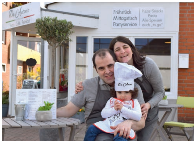
Familie Di Matteo freut sich auf Ihren Besuch

Nehmen Sie das Flair und die Genüsse Siziliens mit. Zahlreiche erhältliche Feinkostprodukte werden Sie für Ihre eigenen