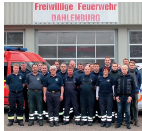
Die Dahlenburger Feuerwehr freut sich über die neuen Shirts