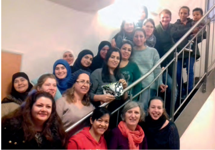
Der Spaß am Nähen verbindet die Frauen des Nähtreffs

Für die Zukunft ist weiterhin ein Treffen pro Monat geplant. Das Nähen von Kleidung steht auf dem Programm. Einen großen Dank an die Gemeinde Dahlenburg, die