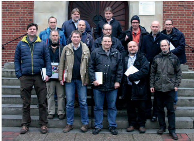
Clever heizen spart Geld und schont die Umwelt: Zwölf unabhängige Energieberater unterstützen Hauseigentümer in der Region ab sofort dabei, richtig zu heizen.