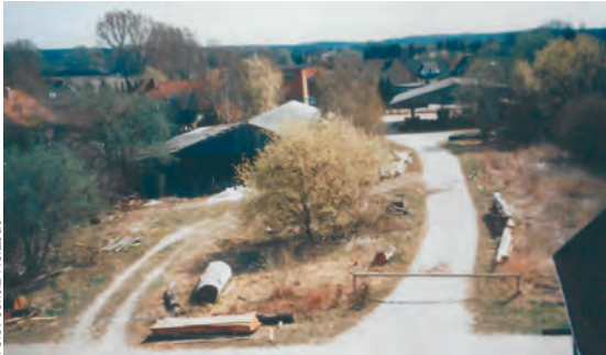
So fing es 1987 an

Am Anfang stand 1987 ein altes Betriebsgelände. Das dazugehörige Sägewerk wurde bereits 1989, nachdem es schon 1987 größtenteils stillgelegt worden war, ganz eingestellt. Es war schlichtweg unrentabel.