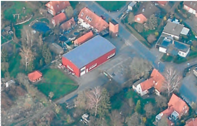
Die Betriebshalle ist das Kernstück des Betriebes