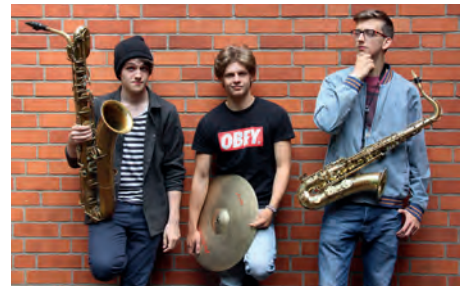
Musik: Trio „Brass Riot“. Veranstaltungsort: Hof Thiele, Am Bruch 1, 21371 Tosterglope, OT Ventschau.