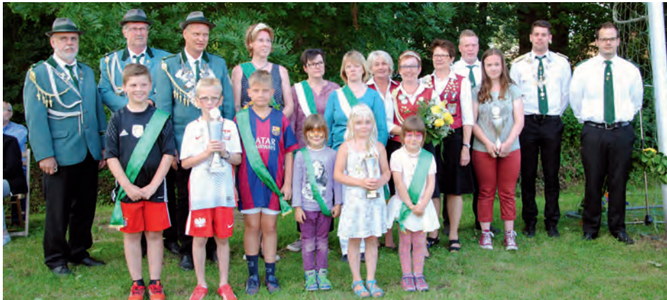
Die Königsfamilie des SV Pommoissel und Umgegend e.V. im Jubiläumsjahr

Die Öffnungszeiten während der Ostertage: Karfreitag 15:00 bis 22:00 Uhr, Ostersonntag 15:00 bis 22:00 Uhr, Ostermontag 13:00 bis 22:00 Uhr und Ostermontag 13:00 bis 20:00 Uhr.