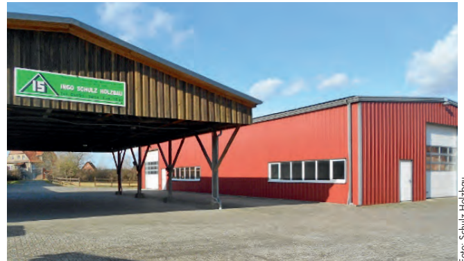
Die Betriebsgebäude heute

Dank möchte er auch Geschäftspartnern und langjährigen Unterstützern seiner Firma