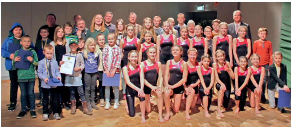
Die geehrten Sportler der Stadt Bleckede

Vortrag: Alexander Tetsch (Fotojournalist) „Was Sie schon immer über das Atom wissen wollen, aber nicht zu fragen wagten“.