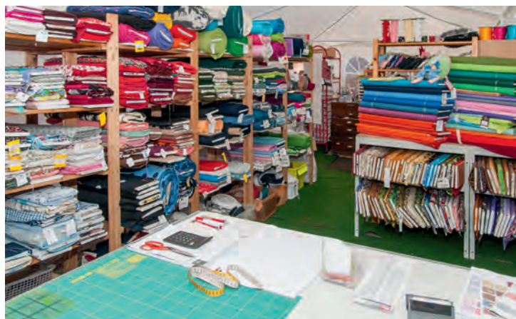
Bei dieser Auswahl wir jeder fündig

Wenn es ums Nähen geht - der Weg nach Garze lohnt sich!