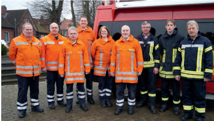
Informations- und Kommunikationsgruppe der Samtgemeinde-Feuerwehren

haben hierfür im Zuge von Lehrgängen und Unterweisungen an der feuerwehrtechnischen Zentrale (FTZ) in Scharnebeck und/oder der Niedersächsischen Akademie für Brand- und Katastrophenschutz (NABK) in Celle Zusatzqualifikationen erworben. Weiterhin finden in Zusammenarbeit mit den Ortswehren und den benachbarten Kommunikationsgruppen regelmäßig Übungen statt. Somit sind alle Kameradinnen und