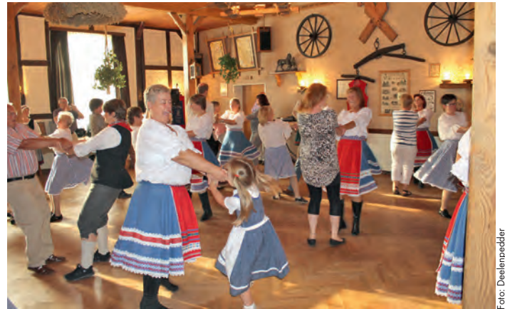
Seit 40 Jahren eine fröhliche Gemeinschaft: Die „Deelenpedder“

Über viele Jahre waren die Volkstänzer eine richtig große Gruppe in Nahrendorf. Es existierten zwischenzeitlich zwei Kinder-