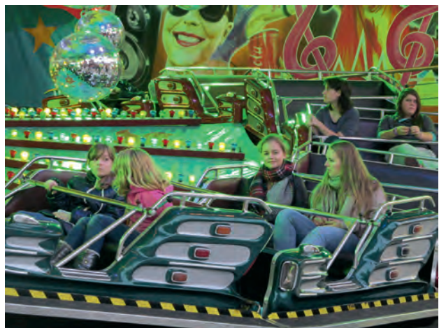
Spaß und gute Laune sind garantiert bei den zahlreichen Fahrgeschäften

Ab 18:00 Uhr startet wieder die stimmungsvolle Weinzeltparty mit Live-Musik.