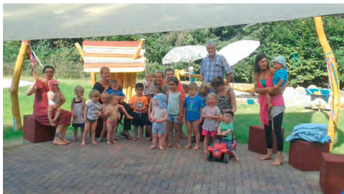
Das neu gestaltete Außengelände bietet eine Vielzahl neuer Möglichkeiten

[ Tobias Gierke ] Das diesjährige Sommerfest der Dahlenburger Kinderkrippe Hornerbär fand am 26. August statt. Bei herrlichem Sonnenschein und Temperaturen um die 30 Grad folgten viele Eltern und Kinder der Einladung. Das Sommerfest dient der Verabschiedung der großen Kinder, die von der Krippe in den Kindergarten wechseln.