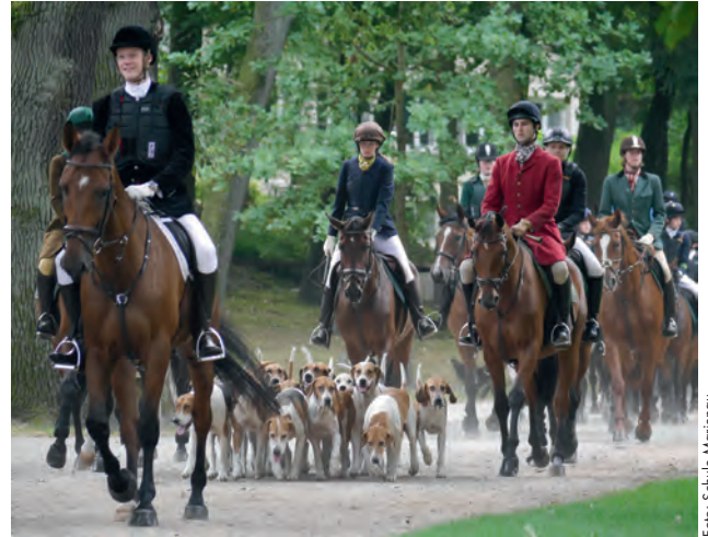
Der Abritt zur Schleppjagd begann in der Marienauer Allee

ten. Für die Eltern gab es einen kleinen Empfang im Haupthaus der Schule und Interessierte konnten an der von den Marienauer Schülern geleiteten Führung teilnehmen und das Gelände kennenlernen. Abends trafen sich die Marienauer und deren Gäste bei Lagerfeuer und schlossen neue Freundschaften. Das Highlight bildete der Abritt zur Schleppjagd am Samstagmorgen.