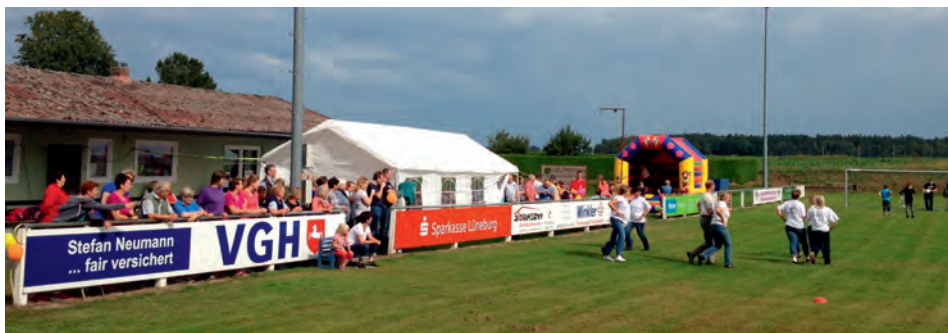
Spiel und Spaß beim Vereinsfest des SV Görhde