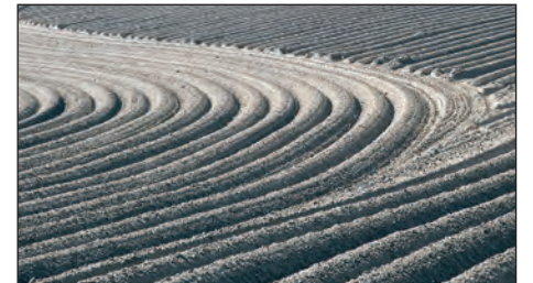
Die Poesie der Furche: Bilder von Reimer Hinrichs zur beliebtesten Frucht der Region.

Am Mittwoch, dem 16.11. um 18:30 Uhr liest Gudrun Parnitzke im Rahmen der Dahlenburger Kulturwoche aus ihrem neuen Buch „Café Messerschmidt ist weggezogen“ Geschichten von einem pulsierenden Einkaufsboulevard, von Ost-West-Pendlern, Kriegsversehrten und gewöhnlichen Nachbarn mit ungewöhnlichen Macken. In der Pause gibt es einen „Berliner Teller“ mit Spezialitäten von damals und heute. Der Eintritt beträgt 16 EUR. Anmeldung bitte bis 13.11. in der appleslounge unter 05851 944 52 33 oder info@appleslounge.de.