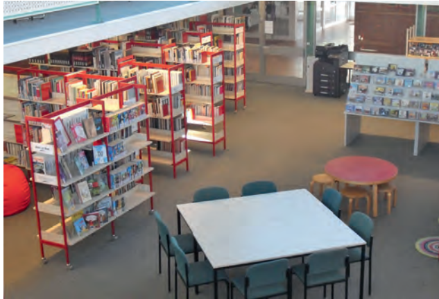
Ein großes Angebot wartet in der öffentlichen Bibliothek in Bleckede

In den Herbstferien bleibt die Bibliothek im Nindorfer Moorweg in der ersten Ferienwoche geschlossen. Am Dienstag, 11. Oktober, sowie am Donnerstag, 13. Oktober, ist sie von 9:00 bis 18:00 bzw. von 9:00 bis 16:00 Uhr geöffnet.