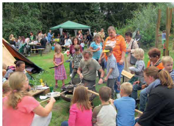
Viele Aktionen begeisterten die großen und kleinen Besucher

Beim Glücksradrehen wurde Fortuna herausgefordert. Es lohnte sich, denn es gab viele attraktive Preise zu gewinnen. Verschiedene Ausstellungen, eine Kinderschminkaktion, Gitarrenmusik am Lagerfeuer und vieles mehr rundeten das Angebot perfekt ab.