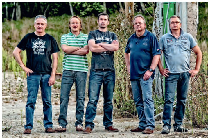
DOUBLETALK aus Lüneburg präsentieren Rock-Klassiker & mehr

In diesem Jahr wird das Angebot erheblich erweitert: Mit kräftigen Rockbeats wird „The Connection“, die Schülerband des Internatsgymnasiums Marienau, ab 19:30 Uhr für einen stimmungsvollen Auftakt sorgen. Ab 21 Uhr folgt dann der Headliner mit der bekannten Lüneburger Rock-Cover-Band „DOUBLETALK“ (doubletalk-rock.de). Die Band wurde 2012 gegründet, seit 2014 rocken die Fünf in der