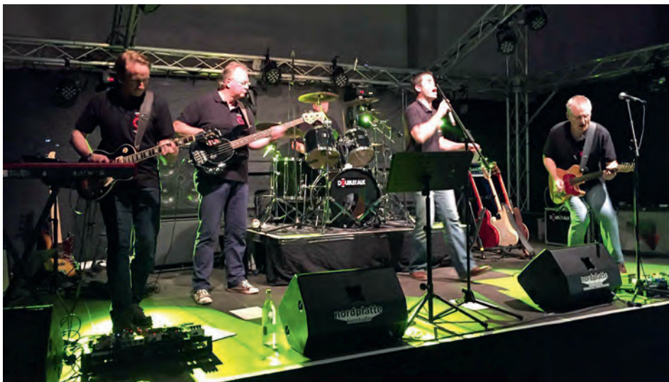
Stimmung garantiert: DOUBLETALK wissen, was das Publikum hören will

Der Weg zum Festival-Gelände ist ausgeschildert. Parkplätze sind auf dem kostenlosen Großparkplatz vorhanden. Einlass ab 19:00 Uhr, Eintrittskarten gibt es an der Abendkasse.