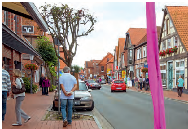
Die Einkaufsstadt Bleckede ist an beiden Tagen geöffnet

Direkt hinter dem Elbdeich auf dem Schützenplatz präsentieren die Oldtimer-Freunde Elbtalauve Bleckede beim 33. Oldtimertreffen am Sonntag von 7 bis 17 Uhr rund 500 Fahrzeuge. Unter dem Motto „Oldie's achtern Diek“ geht es auf Zeitreise durch die