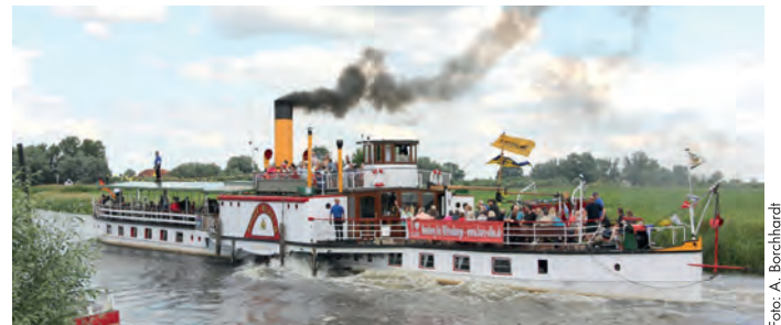
Rundfahrt mit dem Kaiser Wilhelm

Freizeitangebote der Region erhielten Besucher an allen vier Tagen beim gemeinsamen Informationsstand der Biosphaerium Elbtalau, der Stadt Bleckede und dem Verkehrsverein Elbtalau. Die Interessengemeinschaft (IG) Draisine informierte über