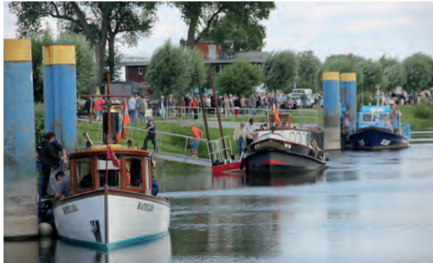
Alle in einer Reihe_MaTHILDA - Suhr und Cons2 - Elbe

auch die Erwachsenen kamen auf ihre Kösten mit Käsespezialitäten, Grillhähnchen, Ross-Spezialitäten, Knobi-Baguette, veganen Backwaren und leckeren Törtchen und Fischgerichten.