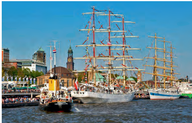
Eine prächtige Kulisse präsentierte sich den LandFrauen im Hamburger Hafen