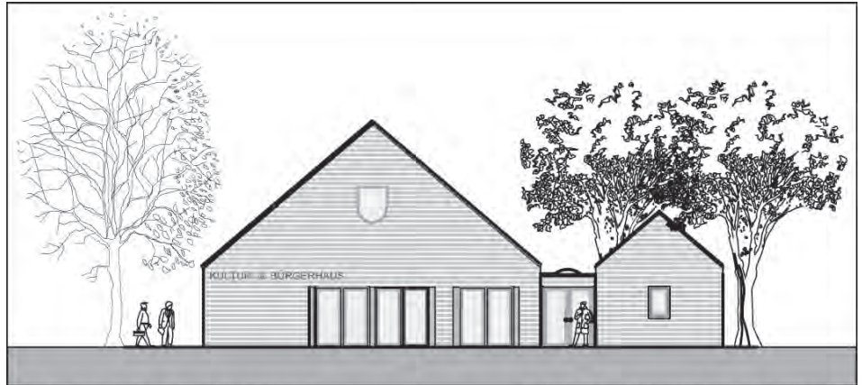
KUB - KULTUR- UND BÜRGERHAUS

Eigenanteil von 720.000 € verbleibt. Um den Eigenanteil noch weiter reduzieren zu können, werden derzeit weitere Fördermittelgeber gesucht.