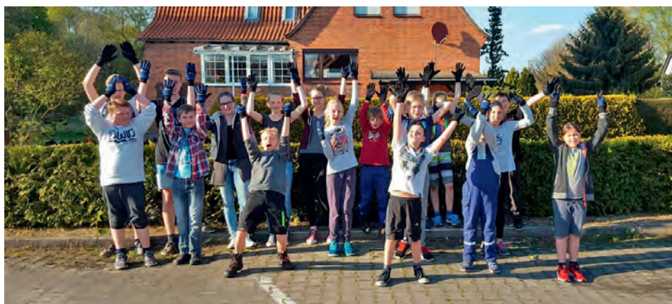
Hoch die Hände mit den neuen Jugendfeuerwehr-Handschuhen

[ Tobias Lotter ] Über eine Spende in Höhe von 500 Euro vom Jugendfond des Windpark Dahlenburg durfte sich die Jugendfeuerwehr Dahlenburg freuen. Das Geld wird in die Sicherheit der Jugendlichen investiert. Zu dem Aspekt „Sicherheit“ kommen für die 40 Jugendlichen in der heutigen Zeit natürlich auch Funktionalität, sowie die Optik der persönlichen Schutzausrüstung hinzu. Damit auch neue JF-Mitglieder im Punkto Sicherheit nicht zu kurz kommen, wurden umgehend 50 Paar Jugendfeuerwehr-Handschuhe der Firma Seiz beim ortsansässigen Anbieter bestellt.