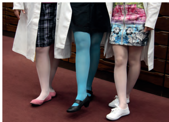
Tun Sie Ihren Beinen etwas Gutes beim Venenaktionstag

Dann besuchen Sie uns am Dienstag, den 6. September und vereinbaren Sie zum Venenmessen vorab einen Termin bei uns unter 05851 7636. Das Team der Apotheke Am Markt freut sich auf Sie!