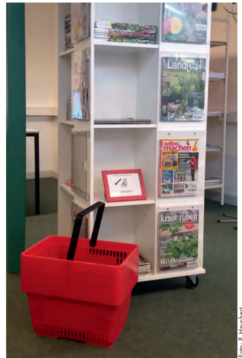
Die neuen Medienkörbe in der Bibliothek Bleckede vor dem Zeitschriftenregal

Die Bibliothek befindet sich im Schulzentrum Bleckede, Nindorfer Moor-