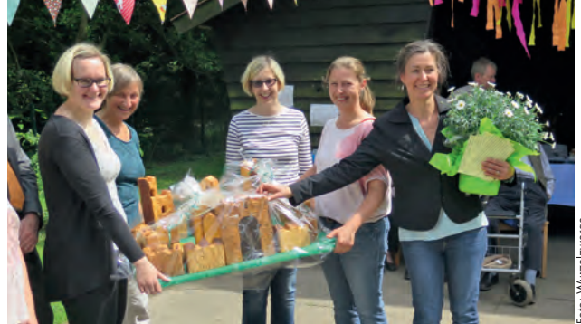
Zum Jubiläum gab es tolle Geschenke

Dass wir ein so schönes Fest feiern konnten liegt an allen, die sich so engagiert und mit viel Liebe daran beteiligt haben. Und wir danken allen, die mit guter Laune bei uns