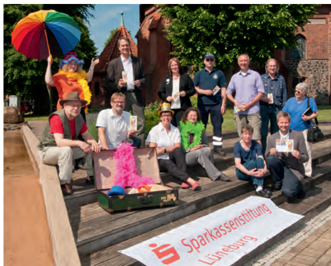
Die Organisatoren freuen sich auf ein tolles Sommerfest am 13. August

Weitere Informationen erhalten Sie bei: Tourist-Information der Samtgemeinde Dahlenburg, Am Markt 17, 21368 Dahlenburg, Tel. 05851 8628 oder Mobil 0160 8105290.