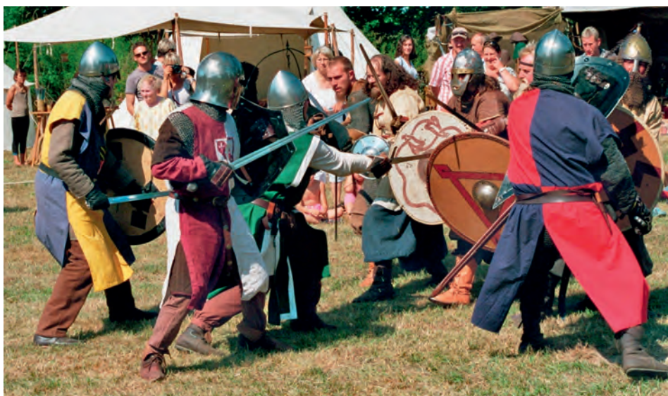
Unter anderem mit spektakulären Vorführungen werden die Besucher ins Mittelalter versetzt

[ Gabriele Heilmann ] Die Hockergymnastik-Kurse finden während der Schulzeit jeweils am Montag von 14:00 - 15:00 Uhr und 15:15 - 16:15 Uhr, im DRK-Haus, Zollstr. 10 in Bleckede, statt. Neue Teilnehmer sind herzlich willkommen. Eine gesonderte Anmeldung ist nicht erforderlich, einfach kommen.