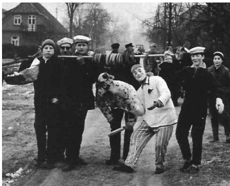
Faslam in Nahrendorf in den 1960er Jahren

Aus Knechten und Mägden von damals ist in Nahrendorf seit 1953 ein Verein „die Jungen Leute Nahrendorf“ geworden. Der Verein ließ zunächst nur Männer als Mitglieder zu, die jung und standfest waren. Seit den siebziger Jahren dürfen auch junge Frauen mitwirken. Wie lange wird in Nahrendorf das „Faslamfest“ schon gefeiert? Dies kann leider nicht mehr genau zurückverfolgt werden. Klar ist, dass es zur Zeit der zwei Weltkriege keine Feste gab.