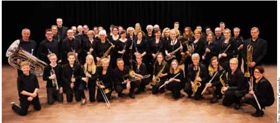
„Harmonie Crescendo Gramsbergen“ aus der Partnergemeinde Gramsbergen in den Niederlanden