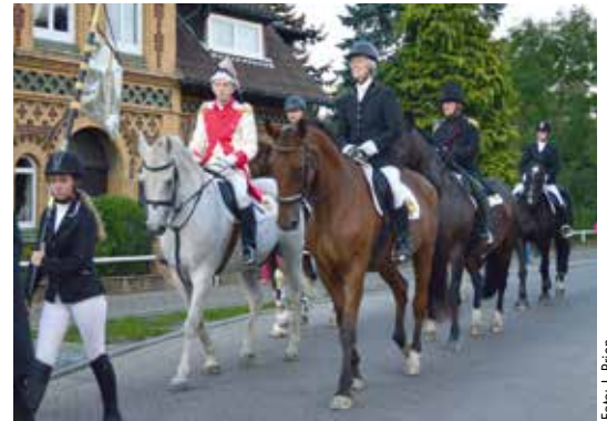
Reiter des Reit- und Fahrverein Dahlenburg auf dem Weg zum Heimatmuseum

Das konnte dennoch mehr als 1000 Besucher nicht davon abhalten, echtes Biwakleben mit Schaukämpfen auf den Lübener Anhöhen sowie das bunte Markttreiben zu besuchen. Aus Nah und Fern parkten die zahlreichen Autos, die sicher von den Feuerwehren aus Kovahl und Tosterglope auf ihre