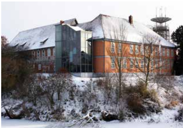
Das Biosphaerium Elbtalau heißt Besucher auch im Winter willkommen

Im Biosphaerium gibt es neben der naturkundlichen, interaktiven Ausstellung, dem Biberbau und der Aquariendlandschaft noch bis Jahresende die Sonderausstellung „Nordische Gastvögel in der