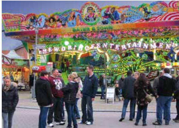
Man trifft sich auf dem Martinmarkt. Rasanten Spaß boten die Fahrgeschäfte

Drei Tage lang herrschte im Ortskern von Dahlenburg Ausnahmezustand: Der Martinmarkt öffnete seine Pforten und lud zum bunten Markttreiben ein. An allen drei Veranstaltungstagen strömten Familien mit ihren Kindern, Omas und Opas, Paare und Cliquen zum Markt, der eine Menge Abwechslung und Spaß bot. Wer wollte, konnte Fortuna an einer der Losbuden herausfordern. Außerdem war Geschick beim Entenangeln, eine hohe Trefferquote beim Dosenwerfen und Können an der Schießbude gefragt.