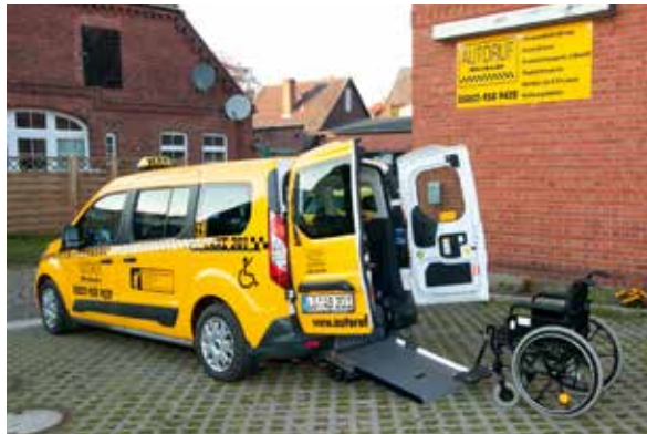
Neues Fahrzeug mit flacher Rampe für bequemes Ein- und Aussteigen

Mobilität ist ein wichtiger Aspekt in unserer Gesellschaft. Auch wenn Sie ein eigenes Auto besitzen, werden Sie mit Sicherheit schon des Öfteren die Dienste eines Taxi- oder Fahrdienstes wahrgenommen haben. Das macht auch Sinn, denn immer, wenn man komfortabel und zuverlässig von A nach B möchte, kommt der freundliche Taxifahrer ins Spiel, beispielsweise beim entspannten Start in den Urlaub mittels Flughafentransfer zu den Flughäfen Hamburg oder Hannover.