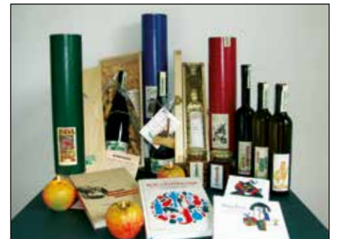
So sieht ein Gabentisch aus. Weihnachtsgeschenke für Genießer in der appleslounge.

Die Öffnungszeiten während der Weihnachtstage: 24.12. geschlossen, 1. Weihnachtstag ab 16:00 Uhr geöffnet, 2. Weihnachtstag ab 13:00 Uhr geöffnet.