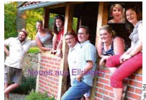
Die Ellringer Theater-Truppe verspricht ein vergnügliches Stück