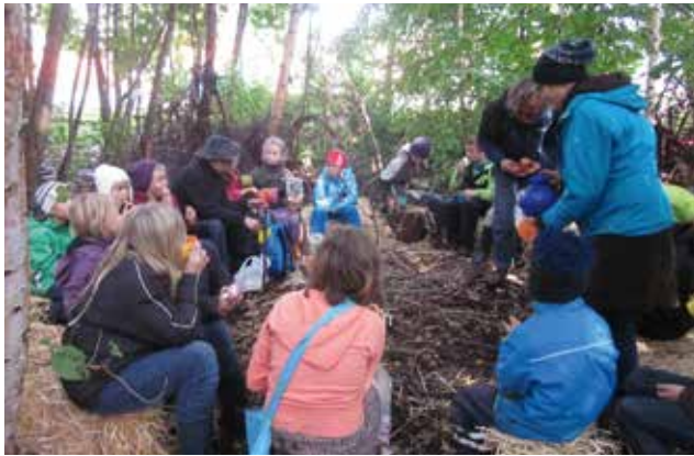
In den Pausen stärkten sich die kleinen Handwerker gemeinsam

Behausungen zu besetzen. Sie lichteten den Wald und fällten morsche Bäume. Die Stämme wurden dann mit Begeisterung in die benötigten Längen für die neuen Bauwerke gesägt. So arbeitete eine Gruppe der anderen zu. Eine geschäftige und entspannte Atmosphäre zugleich hallte durch das Wäldchen. Das auch absichtslose Spielerische und das kreative Tun macht die Kinder zufrieden, so war zu hören, „könnten wir doch jede Woche hier sein“. Sehr wichtig für das Gemeinschaftsgefühl waren auch die Frühstückspausen in denen Obst und kleine Knäckebrote die Runde machten und gerecht geteilt wurden. Und ganz köstlich schmeckten auch die Suppen zum täglichen Mittagessen im Wald. Damit der Garten auch in Zukunft ein gern besuchter und unzerstörter Spielort bleibt, erklärten sich zum Abschluss einige Kinder bereit, den Wald zu hüten und Schäden im öffentlichen Garten bei der AWO in der Dannenberger Str. 20 zu melden.