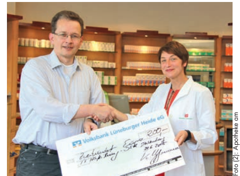
Foto [2]: Apotheke am