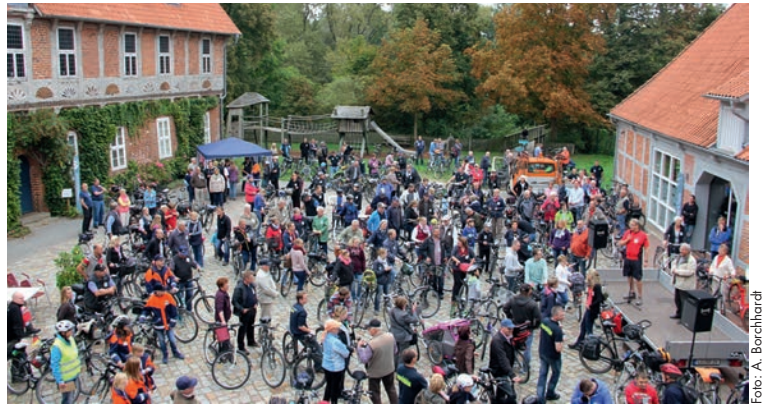
Start der Tour 2014

In Bleckede können direkt am Startort das Charaktertier der Elbe - der Biber - sowie 25 Fischarten der Elbe in der Biberanlage und in der Aquarienlandschaft des Biosphaerium Elbtalauve erlebt werden. Auf über 1.000 m 2 Ausstellungsfläche laden Windmaschine, Überflutungsmodell und die Große Aalreise zum Ausprobieren und Mitmachen ein. Und die Aussicht vom 20 Meter hohen Turm geht weit über die Elbe.