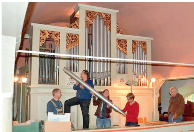
Behutsam werden die Orgelpfeifen entnommen

Die Meyer-Orgel in Barskamp mit ihren 17 Registern, zwei Manualen und Pedalen ist nicht nur im Kirchenkreis Bleckede ein unschätzbare Kleinod, das nun wieder in den einst klangvollen Urzustand der Romantik zurückversetzt werden soll. Ihre Bedeutung als Meisterwerk aus der Werkstatt der Gebrüder Meyer aus Hannover reicht weit über die Region hinaus. Bei der Restaurierung wird nicht nur die Schimmelbildung in den Windgängen beseitigt, sondern es werden auch die 1917 als kriegswichtiges Material abgebauten Zinn-Bleipfeifen - sie wurden durch billige Pfeifen aus Zink ersetzt - wieder gegen wertvolle Pfeifen getauscht, die in ihrer Legierung dem Urzustand aus Blei und Zinn entsprechen. 1939 wurde die Meyer-Orgel bei einer Inspektion und den Einbau einer zu kleinen Windanlage tech-