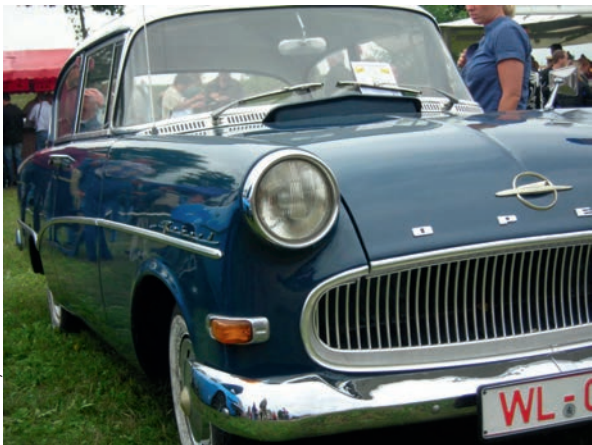
Eine der vielen schmucken Karossen beim Oldtimertreffen in Bleckede

Weitere Informationen unter www.historisches-wochenende.de oder Telefon 05852 951414.