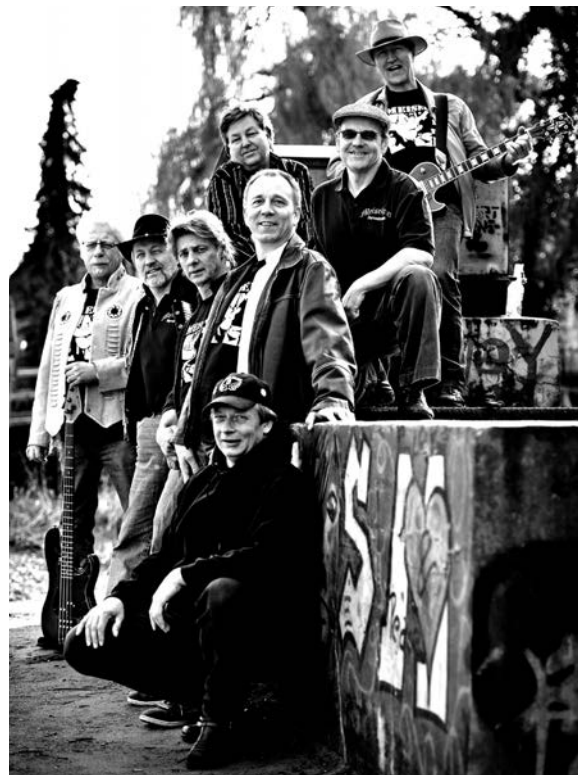
Die „Meiselgeier“ kommen mit dem „Sound of the Seventies“

Wir wünschen allen Besuchern des Open Air Konzerts kurzweilige und rockige Stunden in Gienau!