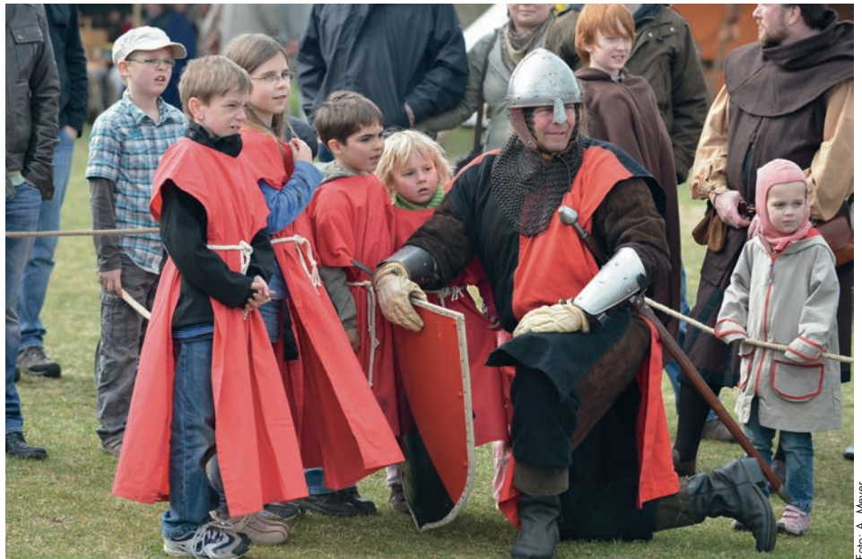
Viatores Knappenschule für die kleinen Ritter beim Schloss-Spectacel