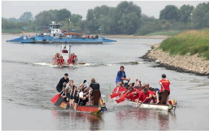
Zu den Höhepunkten der Hafensonntage zählte das Drachenbootrennen am 5. Juli

Der Museumsschlepper Suhr & Cons. aus Hamburg, der historische Hafenschlepper aus Boizenburg (1965) und der Frachtsegler „Hoop op Welvaart“ von 1883 vom Mu-