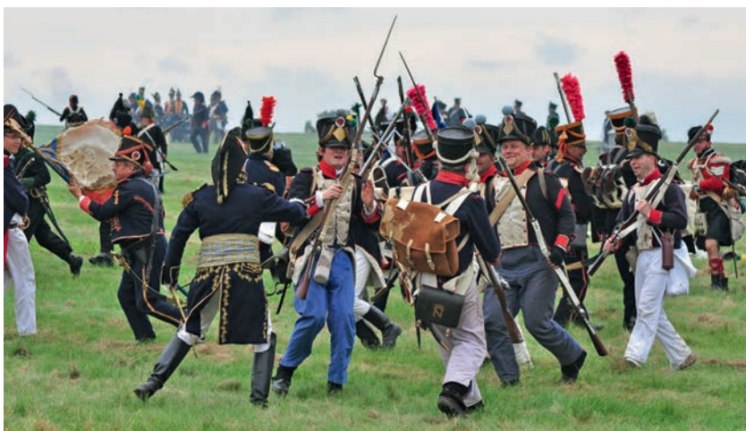
Darsteller im „Kampf“ gegen die Franzosen

[ Sabine Kulau ] Rund 250 Nachsteller aus ganz Mitteleuropa werden zum Reenactment (Nachstellung) der Gohrdeschlacht von 1813 an den Originalschauplatz in Lüben bei Dahlenburg reisen. Ein Wochenende lang begeben sich die begeisterten Nachsteller in das Jahr 1813 und zeigen „Geschichte zum Anfassen“. Die Gohrdeschlacht wird mit Reiter- und Fußtruppen in Originaluniformen nachgestellt und das Soldatenleben im Biwak wie vor 200 Jahren vorgelebt.