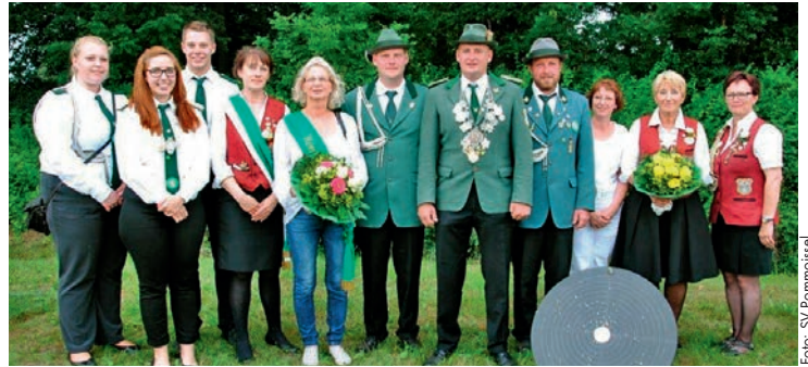
Die Königsfamilie 2015/2016 des SV Pommoissel

Die Spannung auf dem Festplatz stieg an, denn jeder wollte wissen, wer neuer König werden wird. Neuer Schützenkönig wurde