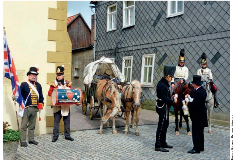
„Auf zur Gohrdeschlacht“: Start des Gohrdemarsches in Dömitz mit Übergabe von Proviant durch den Bürgermeister

Als besonderes Ereignis innerhalb dieser Tage kann der Gohrdemarsch betrachtet werden, ein Zweispänner mit „Freiwilligen“ Darstellern, der auf den Spuren der histo-