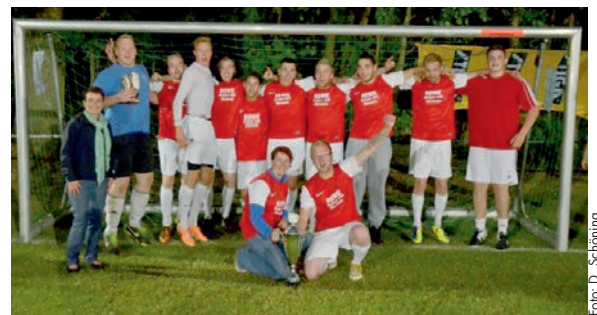
Die Siegermannschaft 2014

Spiel, Spaß und Spannung für die ganze Familie und nach dem Turnier fröhliches Beisammensein, mit kühler Brause und guter Musik. Wir freuen uns auf Euch!