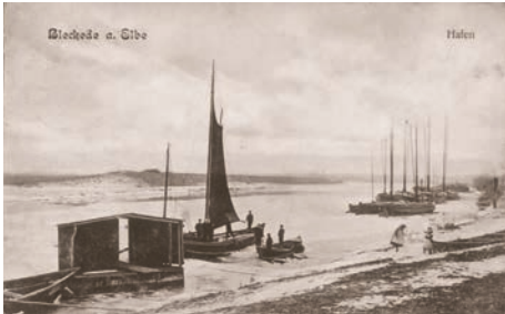
Bleckeder Hafen ca. 1911