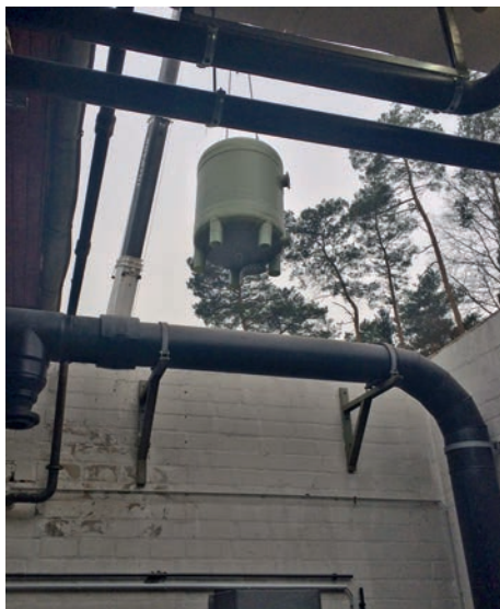
Mit dem Kran wird die neue Filteranlage eingesetzt

Dass die Filteranlage erneuert werden muss, stand schon seit Ende der letzten Saison fest, denn die alten Filter waren defekt. Nach genauerer Begutachtung der Anlage durch ein Ingenieurbüro wurde festgestellt, dass die Filterbehälter Korrosionsschäden aufwiesen und technische Komponenten ausfielen. Dazu kamen ein hoher Reparatur- und Bedienungsaufwand sowie ein erheblicher Aufwand, um die geforderte Wasserqualität einzuhalten. Ein wichtiger Faktor war auch, dass die alte Anlage nicht mehr den heutigen Normen entsprach.