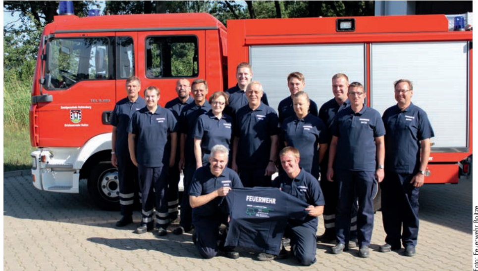
Die Boitzer Wehr ist in diesem Jahr Ausrichter der Samtgemeindefeuerwehrtage

Wir freuen uns darauf, an beiden Tagen recht viele Gäste begrüßen zu dürfen.