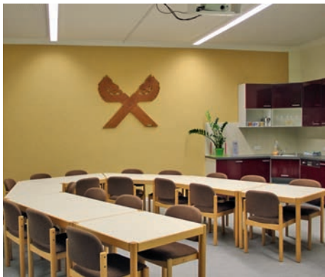
Nach der Modernisierung

Schon während der Auftaktveranstaltung wurde ein neues Projekt geboren: Die Verschönerung des Laubengangs unter der Federführung von KALEIDOSKOP.