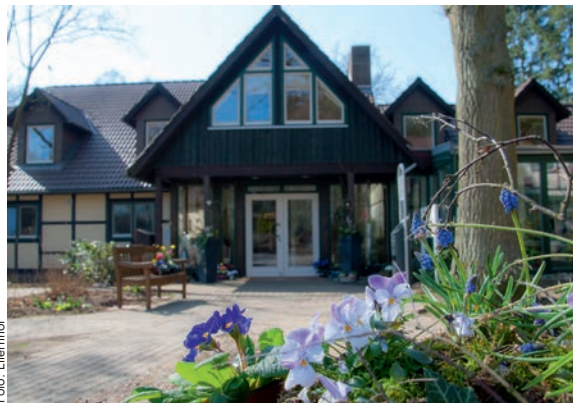
Idyllisch gelegen ist das Tagungshotel Ellernhof bei Ellringen

auf Bio-Qualität. Das Tagungshotel verfügt über rund 50 gemütliche Übernachtungsmöglichkeiten sowie fünf Tagungsräume und zwei Kaminzimmer in liebevoll restaurierten Fachwerkhäusern.