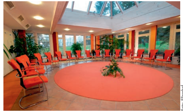
Hell und gemütlich: Einer der drei Meeting- und Veranstaltungsräume