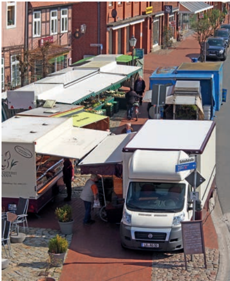
Blick auf den Wochenmarkt in der Breiten Straße

[ up ] Ein Wochenmarkt ist nicht nur Garant für Frische aller angebotenen Waren ausschließlich von Anbietern aus der Region, sondern dort kennt man und trifft sich, wird noch persönlich und zuvorkommend beraten und bedient und nimmt neben gesunden Lebensmitteln & mehr dabei gleich noch den neuesten Klönschnack mit. Kurzum: der Wochenmarkt gehört seit jeher ein-