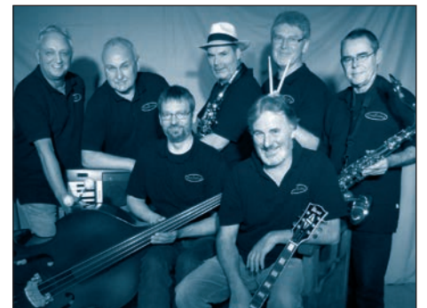
Gute alte Bekannte in der appleslounge: Die BlueSwing Jazzband sorgt am Samstag, dem 13.06. ab 19:00 Uhr für einen heißen Abend.

Aber auch sonst lohnt ein Besuch. Das Menü des Monats, alle Veranstaltungen sowie weitere Informationen finden Sie auf www.appleslounge.de .