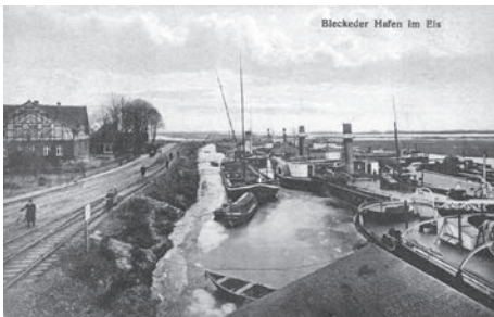
Bleckeder Hafen im Eis, ca. 1920