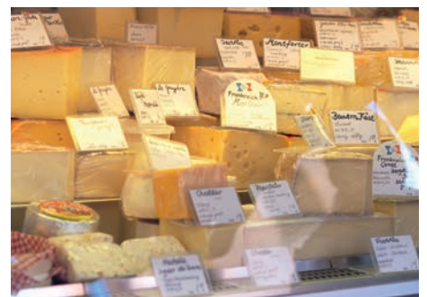
Frische und Qualität werden groß geschrieben bei den Marktbesuchern