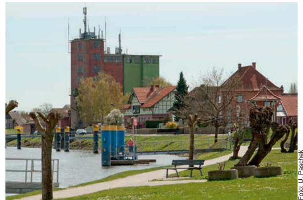
Zuschauer können ihre Teams vom Ufer aus anfeuern

Zwischen Flaggenmast und Fähranleger laden auch dieses Jahr wieder viele Akteure ein, regionale und saisonale Produkte zu entdecken und zu probieren. Ein breites Speisen- und Getränkeangebot sorgt für das