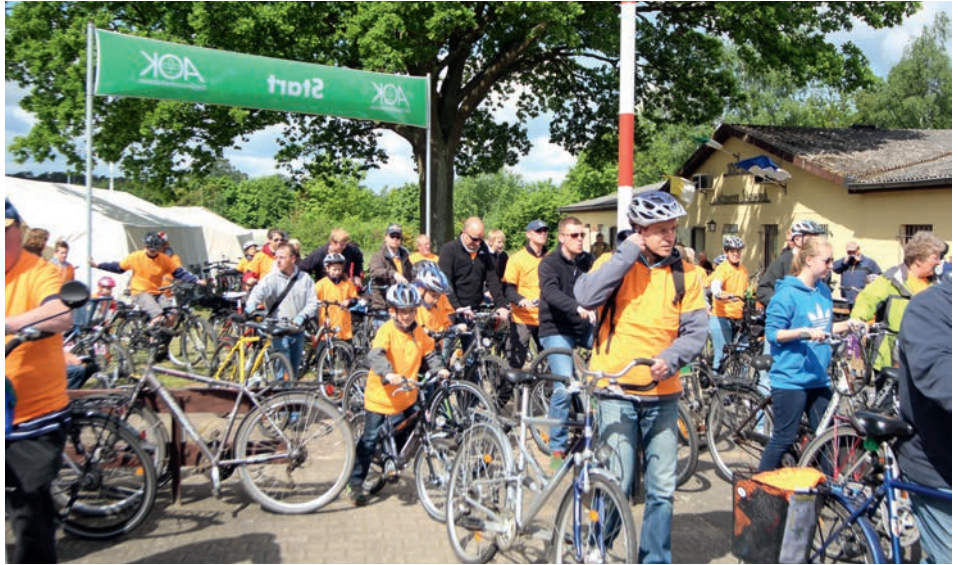
Los geht's auf die landschaftlich reizvolle Strecke

[ Claudia Sandow ] Das Event für Radbegeisterte! Der Verkehrsverein der Samtgemeinde Scharnebeck e.V. lädt Sie zur schon traditionellen „Tour de Marsch“ am Sonntag, 31. Mai ein. Auf einem ca. 35 Kilometer langen Rundweg, der bis zum Start geheim bleibt, führt der Streckenverlauf durch die blühende Landschaft entlang der Elbe. Die Strecke ist für Jung und Alt, Trainierte und Untrainierte gleichermaßen geeignet, Erholungspausen an den zahlreiche Rast- und Versorgungsstationen entlang der Wegstrecke machen die Radler wieder munter. Ankommen ist das Ziel! Alle erfolgreichen Teilnehmer (Stempel sammeln an den jeweiligen Versorgungsstationen) nehmen an der abschließenden Tombola teil. Jetzt heißt es den „Drahtesel“ flott zu machen und sich zum großen Fahrrad-Event in der Elbmarsch anzumelden! Karten gibt es vorab in der Touristeninformation der SG Scharnebeck und weitere Infos unter 04136 907-21.