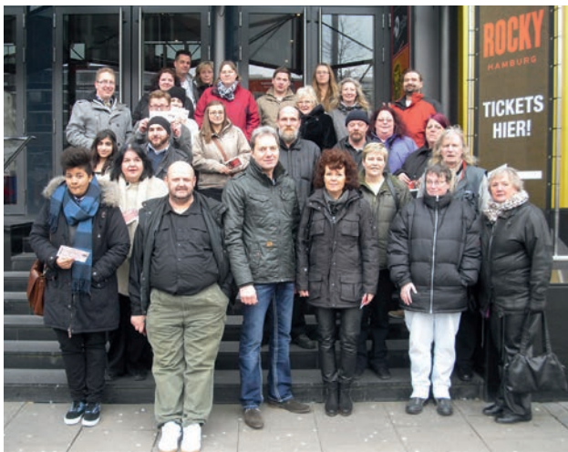
Das Fundus-Team hatte viel Spaß beim ersten gemeinsamen Betriebsausflug

22 Langzeitarbeitslose Menschen finden hier einen Rahmen sich zu betätigen und weiterzuentwickeln. Sie werden von erfahrenen Kräften angeleitet und unterstützt. Eine wesentliche Säule unseres Kaufhauses sind mittlerweile auch unsere ehrenamtlichen Mitarbeiter.