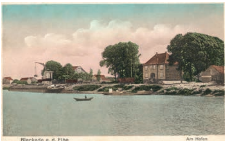
Handcolorierte Postkarte, ca. 1930