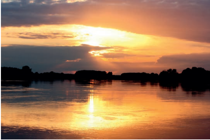
Die wunderschöne Abendstimmung an der Elbe bei einer Exkursion genießen

[ Hannah Heberlein ] Unter dem Motto „Abendstimmung und Abendstimmen der Elbtalau“ geht es für Erwachsene am 15. Mai mit wachen Sinnen auf Exkursion in die weitläufige Flusslandschaft, die um diese Zeit eine ganz besondere Stimmung bietet. Ob überfliegende Bekassine, Gesang des Feldschwirls oder nagende Biber – für Augen und Ohren hat die Natur jede Menge zu bieten. Und wer noch mehr gefiederte Tiere beobachten möchte, kommt bei „Wachtelkönig, Bekassine & Co, Wiesenvogel in der Elbtalau“ am 30. Mai auf seine Kosten. Am 21. Juni geht es mit der Mitmachaktion „Einblicke bei Familie Storch“ weiter. Wie sieht das Leben von Familie Weißstorch während einer Saison