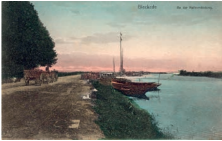
Beschaulich: Der Bleckeder Hafen um 1900