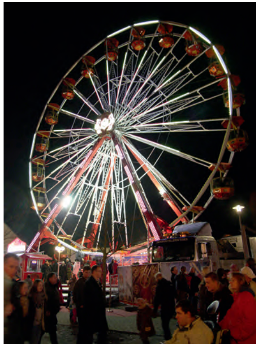
Das Riesenrad überragte alles und war die Attraktion des Martinimarkts in Dahlenburg

grüßung zur Eröffnung. Ausdrücklich dankte er den Schaustellern, denn ohne sie wäre der Martinimarkt nicht das, was er ist und rief den Hunderten Besuchern ein „Prost