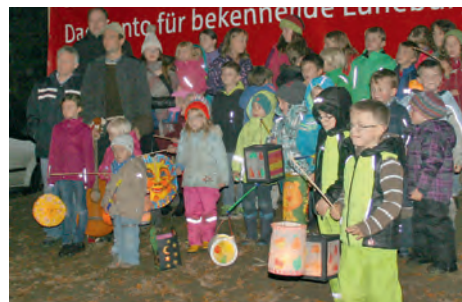
Viele Kinder waren mit ihren Laternen gekommen