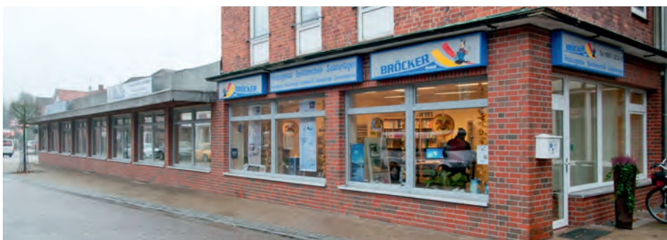
Aus dem unansehnlichen Kasten ist ein schmales Gebäude geworden

An der Stirnseite des Gebäudes steht ein Ladenlokal ab dem 1. Januar 2015 zur Vermietung: Auf 46 m 2 Fläche ist Platz für kreative Geschäftsideen.