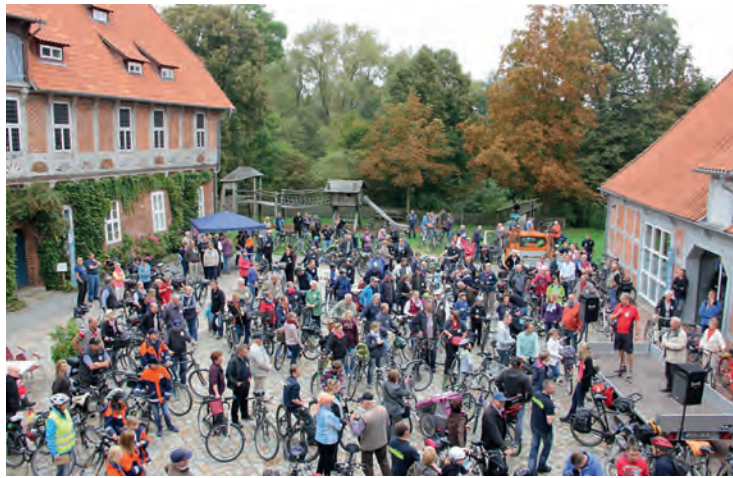
Start auf dem Bleckeder Schlosshof