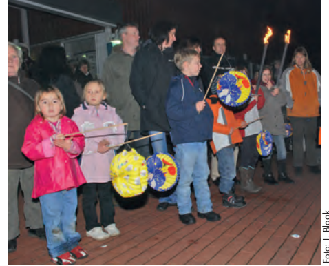
Freudige Erwartung vor dem Start

[ Heike Janott ] Wenn sich hektische Aufregung bei den Kleinen und gespanntes Warten bei den Erwachsenen am Freitagnachmittag vor dem Martinimarkt einstellt, dann ist es endlich wieder soweit: Der große Laternenumzug durch Dahlenburg steht kurz bevor.