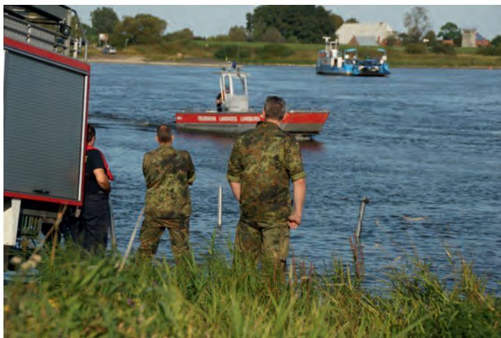
Soldaten des Panzerartillerielehrbataillons 325 mit der Feuerwehr Blekede auf der Elbe

ungefähr sechs Meter höher als jetzt und über 500 Soldaten unterstützten im Einsatzabschnitt Blekede bei der Deichverteidigung. Bei diesem Besuch stand die Elbe wieder im Mittelpunkt: Interessante Punkte aus dem Hochwassereinsatz wurden mit dem Mehrzweckboot der Feuerwehr Blekede angefahren. Bei niedrigem Wasserstand waren der Kohlenplatz in Alt Garge oder der Hafen in Blekede für die Soldaten nicht wieder zu erkennen. Die Zusammenarbeit im Hochwassereinsatz war für beide Seiten eine Erfahrung. Die Abläufe und Strukturen von Feuerwehr und Bundeswehr passen nicht 100 %ig zusammen – allerdings hat jede Organisation ihre Stärken. Mit diesem Wis-