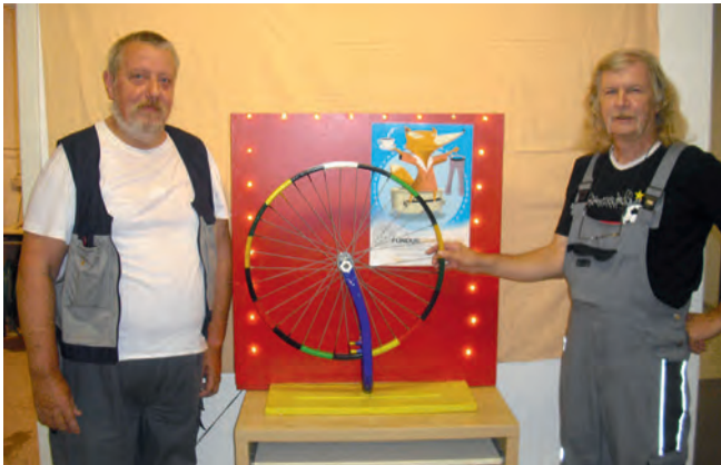
Beim Glücksrad können attraktive Sachpreise erspielt werden

re Wohnungen. Auch vollständige, gut erhaltene Geschirre und Kleidung (nicht älter als fünf Jahre) werden viel nachgefragt. Sie möchten Waren spenden? Sprechen Sie uns an! Gerne holen wir größere Spendenmengen oder auch Möbel bei Ihnen zu Hause ab. Weiter bieten wir auch komplette Haushaltsauflösungen an. Hierzu vereinbaren Sie bitte einen Termin für die Angebotserstellung. Nähere Infos und Terminvereinbarungen unter 05851 979420.