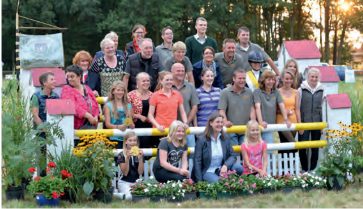
Unsere Helfer haben nach drei Turniertagen noch gute Laune