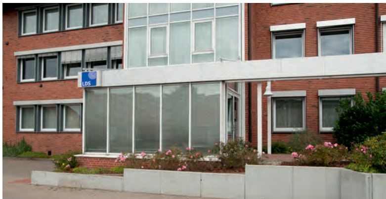
Über den Seiteneingang im Volksbank-Gebäude erreichen Sie das Steuerbüro

Gute Voraussetzung für eine individuelle Beratung ist