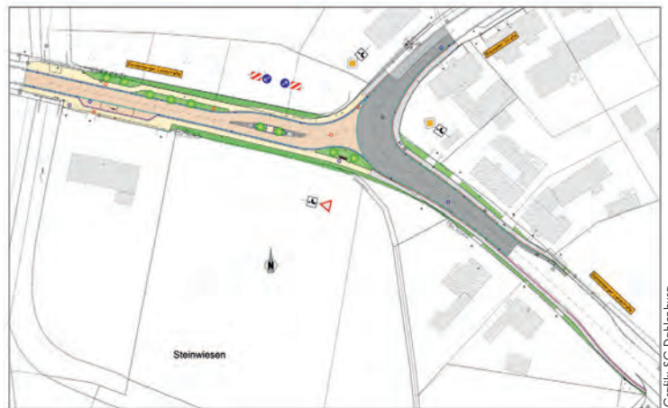
Grafik: SG Dahlenburg

Eventuelle Unannehmlichkeiten bittet die Samtgemeinde Dahlenburg und der Flecken Dahlenburg zu entschuldigen und hoffen auf Ihr Verständnis.