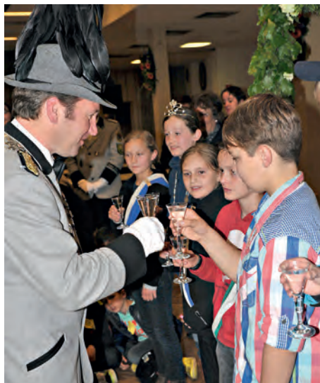
Der „kleine“ und der „große“ König stoßen an