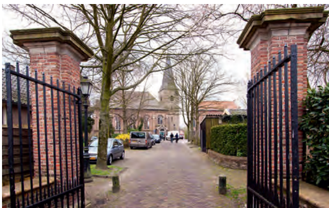
Reste des Burgttores in Gramsbergen

Wer schon einmal beim Lichterfest dabei war, weiß, wovon gesprochen wird! Der ganze Ort ist geschmückt bis in jeden Vorgarten. Die musikalische Eröffnung durch