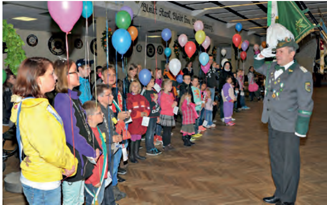
Fröhlich und bunt geht es beim Kinderschützenfest zu

Auch für die Erwachsenen klingt jetzt das