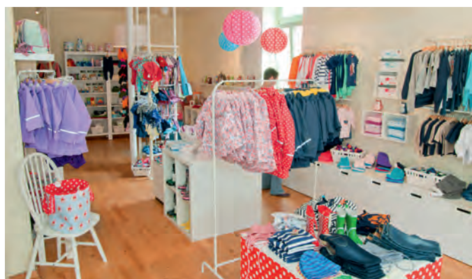
Hell und mit Liebe zum Detail dekoriert präsentieren sich die „elbtalzwerg“

Ein Kinderladen mit diesem Sortiment abseits des Gewöhnlichen ist in der Region einmalig. Ein kunterbuntes und fröhliches Geschäft, das die Wünsche von Groß und Klein erfüllt. Wir wünschen Denise Freimuth viel Erfolg!