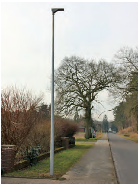
Aufgestellte neue Leuchte in Alt Garge; Im Hintergrund ein alter Lampenmast