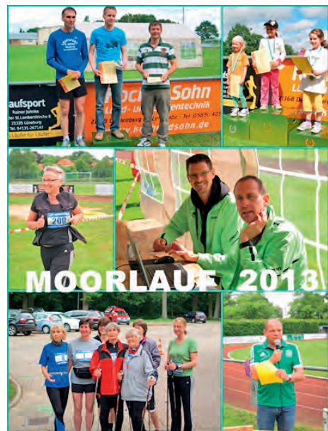
Collage: E. Kollé

Zum Training kann jeder gerne vorher schon vorbei kommen. Immer Dienstag und Donnerstag um 18 Uhr beim Sportplatz.