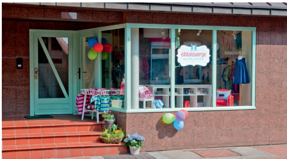
Groß und Klein hereinspaziert - es gibt schöne Dinge zu entdecken

Denise Freimuth setzt auf Naturtextilien