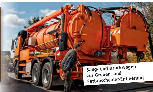
Saug- und Druckwagen zur Gruben- und Fettabscheider-Entleerung

Vermietung von folgenden Geräten ab Dahlenburg: