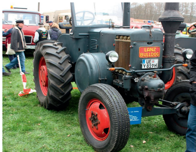
In Ellringen ist wieder für jeden etwas dabei

Während Papa und Mama über den prall gefüllten