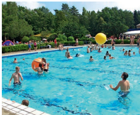
Badespaß im Waldbad Alt Garge

Rund 63.000 Euro investierte die Stadt Bleckede für die Errichtung der Anlage aus ihrem Haushalt. Die Gesamtleistung der 91 Module wird auf ca. 35 kWp (Kilowattpeak = Spitzenleistung) pro Jahr beziffert.