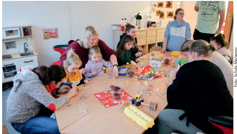
In der Krippe Horner Bär ist immer viel los

Kinder und eine neue Kollegin. Die ersten Eingewöhnungen laufen schon und weitere Kinder wechseln nach ihrem dritten Geburtstag in den Kindergarten. Am Rosenmontag