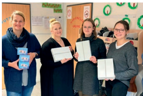
Das Krippenteam freut sich über Tablets und Kameras

Durch die Digitalkameras können die Erinnerungen an Ausflüge, Fasching, Spaziergänge und viele weitere schöne Momente festgehalten werden. So können die Eltern sehen, was ihr Kind im Alltag in der Krippe alles erlebt hat und die Erzieherinnen Erinnerungen für die Sammelmappe erstellen.