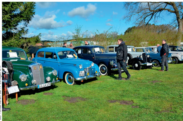
Glänzender Chrom wohin das Auge schaut

SE EINHÄUSER STEUERBERATUNGSGESELLSCHAFT MBH