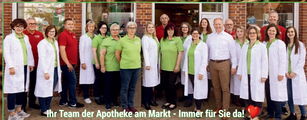
Ihr Team der Apotheke am Markt - Immer für Sie da! ❤️