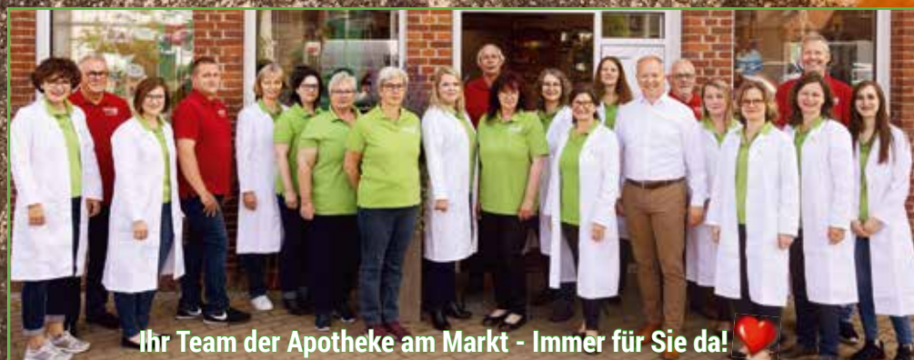
Ihr Team der Apotheke am Markt - Immer für Sie da!