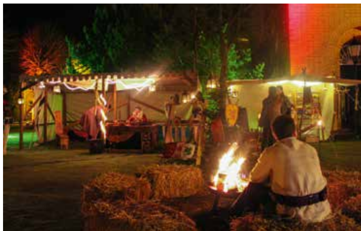
Weihnachtliches Marktgeschehen in diesem Jahr auf dem Schlosshof

Am Sonnabend den 3. und am Sonntag, den 4. Dezember wird es erstmals nach der Renovierung des Nordflügels wieder ein weihnachtliches Marktgeschehen auf dem Schlosshof geben. Auf die Besucher warten Händler & Kunsthandwerker aus der Region sowie lokale Vereine und Initiativen. Weihnachtlich geschmückte Holzhütten, eine große Auswahl an weihnachtlichen Leckereien laden im historischen Ambiente des Schlosshofs zum Verweilen ein. Ein Kinderkarussell wird zur Freude der Kleinen seine Runden drehen. Aus den Buden locken herrliche Düfte von Glühwein, Zuckerwaren,