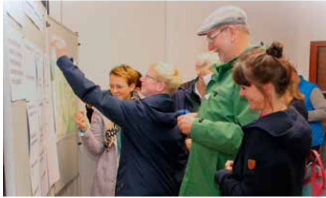
Dahlenburger bewerten die Situation in der Samtgemeinde und setzen Schwerpunkte

[ Adi Brachmann ] Im Oktober haben über 50 Bürgerinnen und Bürger am Bürgerforum der Samtgemeinde Dahlenburg mit ihren Mitgliedsgemeinden teilgenommen. Im Eingangsbereich hatten alle die Möglichkeit, eine Wichtung der Themen auf Stelltafeln mit Klebepunkten zu dokumentieren. Etwa die Hälfte sagte, dass sie mit der Lebensqualität zufrieden seien. Die andere Hälfte war eher unzufrieden. Besonders drängender Handlungsbedarf wurde in den Bereichen gewerbliche Entwicklung, Rad und Fußverkehr, Umwelt-, Natur- und Klimaschutz, Freizeit und Kultur, Mobilitätsangebote sowie der ärztlichen Versorgung gesehen.