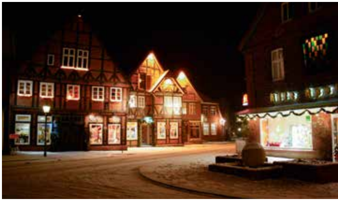
Die Bleckeder Weihnachtsstraße lädt zum Shoppen ein

das Angebot ab. Für die Kleinen steht eine Strohüpfburg zum Toben bereit. Tierliebe Kinder können auf Pohnys ihre ersten Reiterfahrten sammeln. Im eigenen Hofladen werden nicht nur Produkte aus eigener Herstellung, sondern auch von benachbarten Erzeugern angeboten: Kartoffeln, Eier, Honig, Obst und Gemüse, Wurst, Wild und Highlandfleisch.