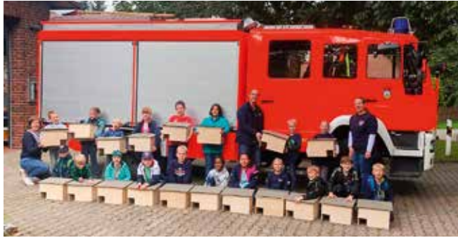
Stolz präsentiert die Kinderfeuerwehr Gienau die selbst zusammengebauten Igelhäuser

Im Anschluss präsentiert jede Gruppe Ihre Ausarbeitung den anderen Gruppen. Nach einer Erholung mit Spiel und Spaß mussten sich die Kinder dann noch einmal konzen-