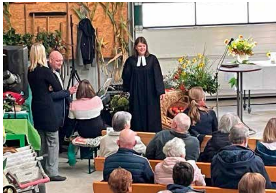
Gottesdienst in der Scheune auf Hof Uffmann