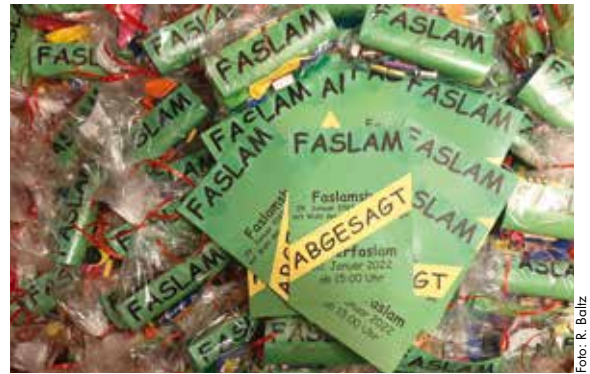
Trotz Absage des Faslam freuten sich die Kinder über den süßen Gruß

Die Aussichten für 2023 sind zurzeit nicht