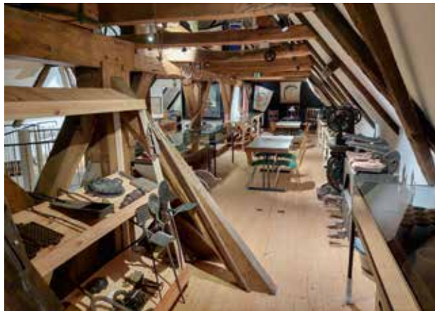
Auch unterm Dach gibt es viel zu entdecken