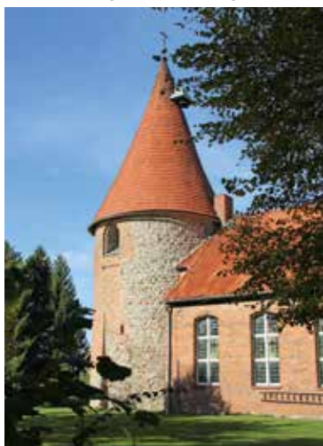
St. Vituskirche in Barskamp

Altbauten lukrative Unterstützungen bietet. Die Dorfregion umfasst die Ortsteile Alt Garge und Barskamp der Stadt Bleckede sowie Gut Horndorf, Köhlingen, Tosterglope und Ventschau in der benachbarten Gemeinde Tosterglope. Es wurden die Handlungsfelder „Dorfgemeinschaft und Soziales“, „Dorfgestaltung, dörfliche Plätze und Wohnraum“, „Mobilität, Verkehrsinfrastruktur und Daseinsvorsorge“, „Ländliche Wirtschaft und Tourismus“ sowie „Klimaschutz und Dorfökologie“ bearbeitet. Die Förderphase für die Dorfregion startete 2020.