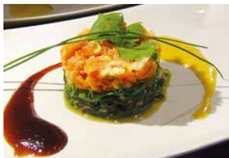
Ab April in der appleslounge: Neue skandinavische Küche.

Die Öffnungszeiten: Freitag 17:00 bis 22:00, Samstag 17:00 bis 22:00, Sonntag 13:00 bis 15:00 und 17:00 bis 20:00 Uhr oder für Gruppen nach Vereinbarung.