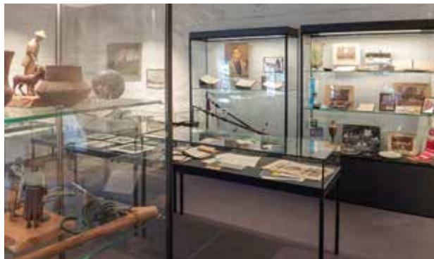
Die Exponate werden mit modernster Präsentationstechnik ausgestellt