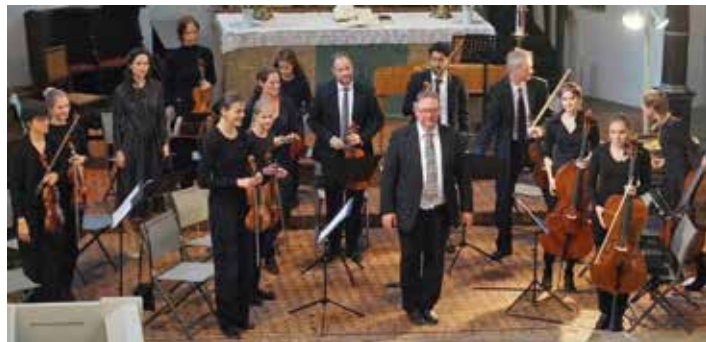
Lüneburger Kammerorchester: Herbstkonzert 2018 im Kloster Lüne

„FrühlingsMusik“ Lüneburger Kammerorchester. Samstag, 14. Mai 2022, 17:00 Uhr, im Schloss-Saal, Schloss-Str.10, 21354 Bleckede.