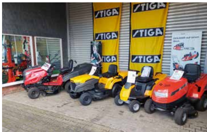
Aufsitzmäher von Stiga oder Dolmar für den großen Rasen

Mit dem dieser Tage bevorstehenden kalendarischen Frühlingsanfang beginnt so allmählich auch wieder die Gartensaison. Oft stellt man dabei beim Blick in den Gartenschuppen fest, dass die im Herbst eingelagerten Gartengeräte eine Überholung dringend nötig haben oder gar den Dienst verweigern. Der Rasenmäher springt nicht an. Und nun? Höchste Zeit für einen