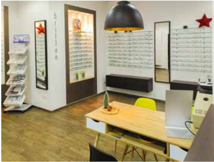
Ein freundliches, modernes Ambiente erwartet Sie