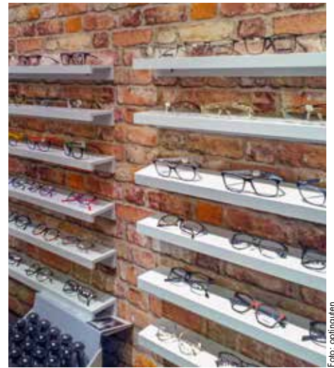
Bei der großen Auswahl an Brillengestellen ist für jeden etwas dabei

auf eine gute, ehrliche Beratung mit vielschichtigen, interessanten Marken. So zeichnen sich die RAXX/KIKANI NCHEN Kinderbrillen durch eine sehr hohe Qualität, was sich auszeichnet durch eine ausgezeichnete 2-Jahres Garantie auf alle Fassungssteile, aus-