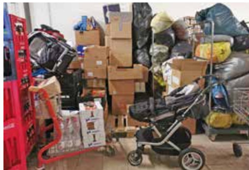
Viele Spenden wurden abgegeben

PS: Den Kontakt vor Ort haben wir aufrecht erhalten und es kamen noch weitere Wünsche bei uns an, was benötigt wird. Sollte noch jemand spenden möchten, sprechen Sie mich gerne im Markt an.