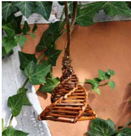
Vogel-Futterplätze aus Weidenruten - Beispiel Fettfutter-Glocke