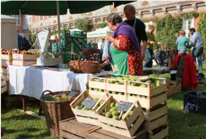
Marktstand im Schlossinnenhof

Viele weitere Partner sind mit Aktionen, Informationsständen und natürlich einer großen Auswahl an leckeren Obstsorten mit dabei. Mitten auf dem Schlossinnenhof steht eine Saftpresse, die sich aufgrund ihrer Größe nur mit zwei Personen bedienen lässt. Hier ist die Mithilfe der großen und kleinen Besucher gefragt und natürlich kann