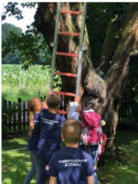
Das Retten einer (Stoff-)Katze gehörte zu den Aufgaben des Parcours

Bei einem Hindernisparcours wurde die oder der „strongest young firefigther“ ge-