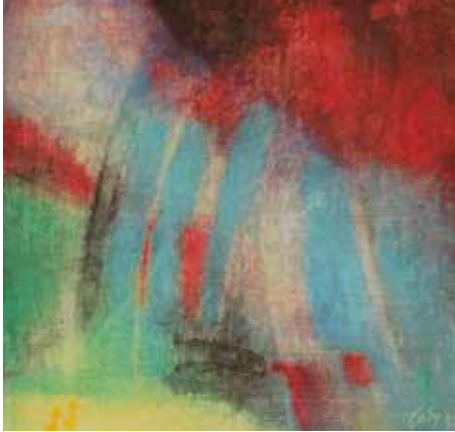
„Aufbruch“ (Cornelia Spanier)

[ Brigitte Döring ] blue butterfly ist ein Musikprojekt mit mehreren Musikern. Ihr Spiel entsteht aus dem schöpferischen Moment heraus.