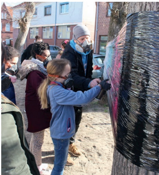
Ein farnefrohes Kunstwerk entsteht

Erst einmal wurde eine schwarze Folie zwischen zwei Bäume gespannt, um mit den Sprühdosen zu üben. Die genaue