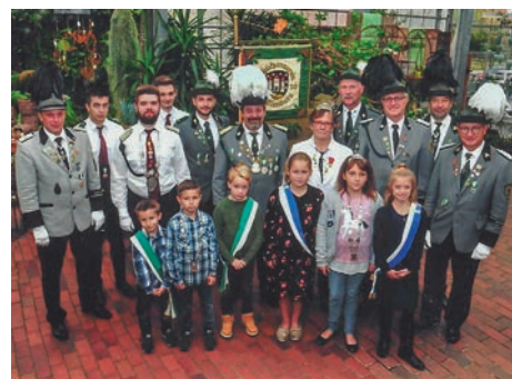
Die Königsfamilie 2019 macht weiter

Lasst Euch nicht unterkriegen, bleibt gesund und zuversichtlich. Wir sehen uns.