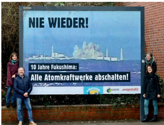
Das Team von e-Ventschau e.V.

nach regionalen Kooperationspartnern gesucht wurde. Diese Partner konnten Großplakate sponsern, die dann in den jeweiligen Städten/Regionen aufgehängt werden sollen. Ein Bild des havarierten AKW Fukushima Daiichi mahnte darauf unübersehbar vor den Gefahren der Atomenergie. In Lüneburg kooperiert „ausgestrahlt e.V.“ bereits seit Jahren mit dem Verein „e-Ventschau e.V.“, der zwei Großplakate sponserte, die