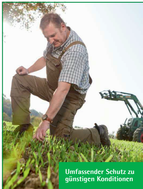
Umfassender Schutz zu günstigen Konditionen