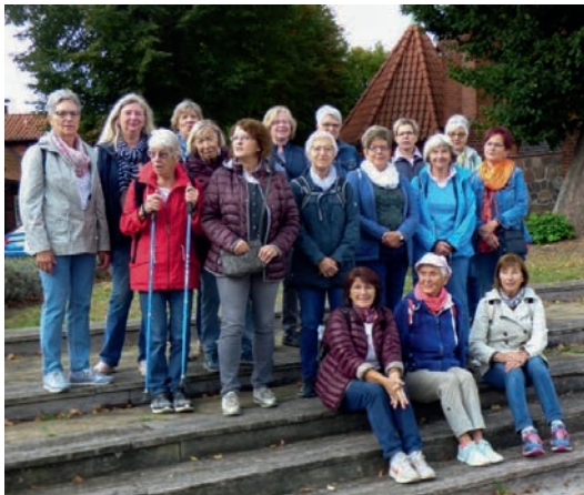
Bei einer außerplanmäßigen Wanderung im letzten Jahr

Ort etwas schöner zu gestalten. Viermal im Jahr treffen sich die Damen, um einige Beete sauber zu machen und neu zu bepflanzen. An dieser Stelle bedankt sich der Vorstand herzlich für dieses Engagement.