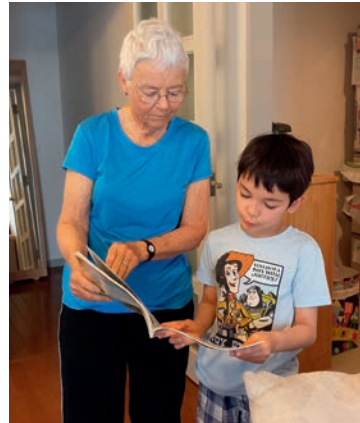
Den Kindern soll Freude am Lesen vermittelt werden

Lesen Sie selbst gerne, können gut zuhö-