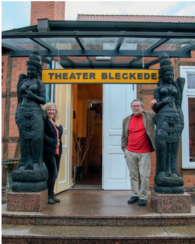
Die Türen des Theaters sollen hoffentlich bald auch wieder den Besuchern offen stehen