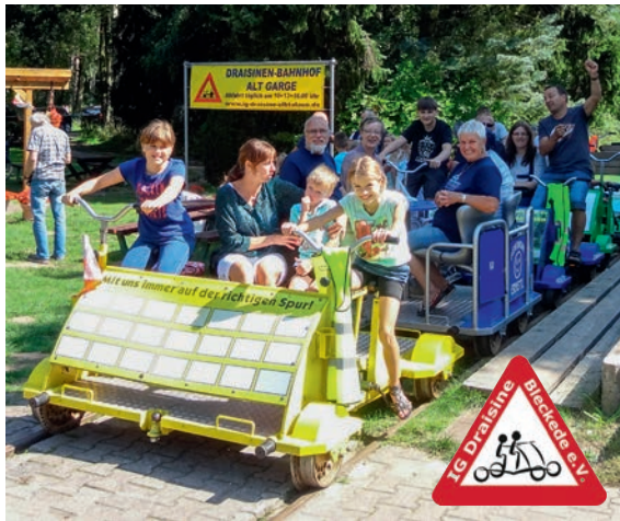
Draisinefahren ist ein Spaß für die ganze Familie

Informationen über unsere Preise, einen Belegungsplan bzw. eine Buchungsseite fin-