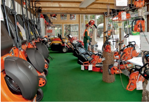
Die Ausstellung mit vielen Geräten zur Ansicht

verweigern. Der Rasenmäher springt nicht an. Und nun? Höchste Zeit für einen Check in der Fachwerkstatt Ihres Vertrauens! Das Team der Firma Koch & Sohn Land- und Gartentechnik in Lemgrabe wartet und repariert Ihre motorisierten Gartenhelfer schnell und kompetent, selbstverständlich auch Fremdfabrikate. Nutzen Sie den Hol- und Bringdienst: Sie entscheiden, ob Sie das Gerät selbst vorbei bringen oder von der Firma Koch & Sohn abholen lassen. Bequemer geht es nicht.