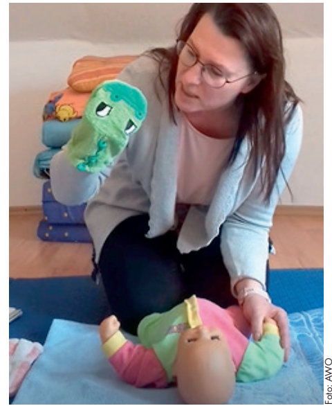
Der persönliche Austausch in den Gruppen fehlt