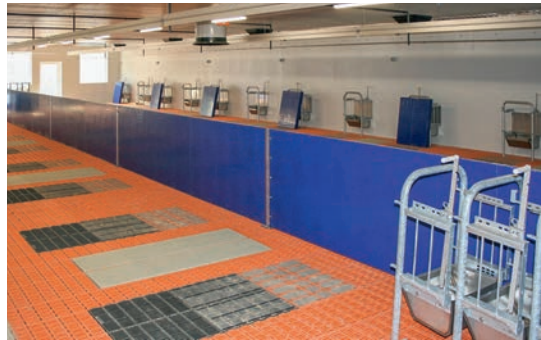
Innenansicht des neuen Stalls

„PigPod – Der Podcast aus Ellringen“ kann über Apple Podcast oder Spotify angehört werden oder auch über Youtube angeschaut werden. Bürger-Fragen können unter Angabe des eigenen Namens