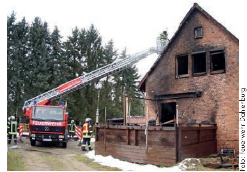
Auch die Drehleiter aus Bleckede kam zum Einsatz

Bei Eintreffen der ersten Kräfte schlugen die Flammen aus dem Erdgeschoss bereits bis zum Dachfirst aus dem Gebäude. Daraufhin wurden die Feuerwehr Nahren-dorf-Oldendorf sowie die Feuerwehr Bleckede mit der Drehleiter alarmiert.