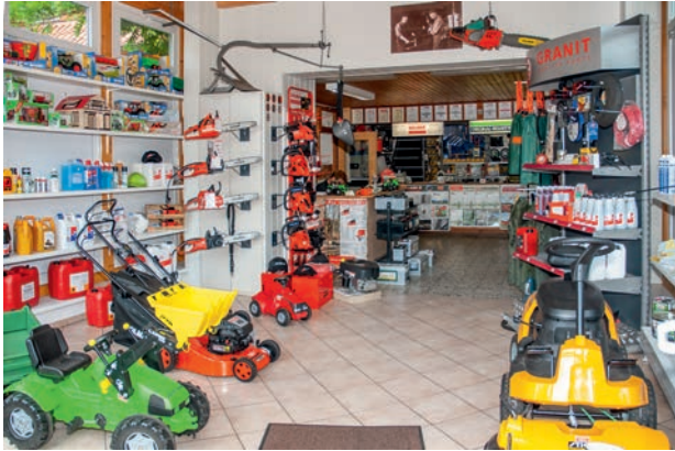
Zubehör und Ersatzteile für Ihre Gartengeräte in großer Auswahl