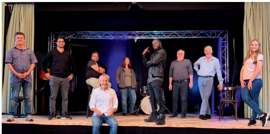
Das Team Bühne im ONE WORLD Reinstorf