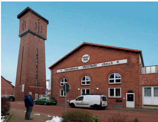
Der Kanzleisitz in der Straße Am Fürstenwall