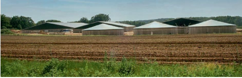
Blick auf den Neubau von Osten

In der Vergangenheit hat der Bau des neuen BHZProZukunft Stalls in Ellringen für Diskussionen gesorgt. Die neue Stallanlage wird in Zukunft die Basiszucht beherbergen, die bisher bereits seit 1970 in Ellringen ansässig ist. Dabei waren die Anforderungen einer tiergerechten Haltung ebenso Teil der Planung wie die Vermeidung von Belastungen für Anwohner und Umwelt.