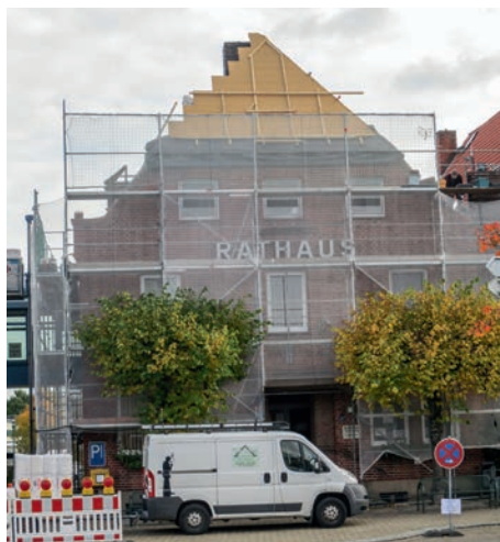
Die energetische Sanierung soll Ende November abgeschlossen sein

rund um den Dahlenburger Verwaltungssitz zu rechnen. Wir bitten um Verständnis.