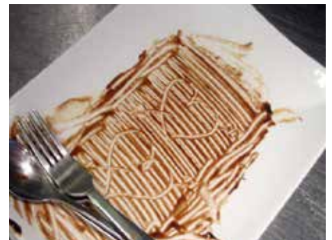
Wenn Sie wissen wollen, wie so ein Teller vorher aussah, kommen Sie in die appleslounge.

Die Öffnungszeiten: Freitag 17:00 - 22:00 Uhr, Samstag 17:00 - 22:00 Uhr, Sonntag 13:00 - 15:00 und 17:00 bis 20:00 Uhr oder nach Vereinbarung.