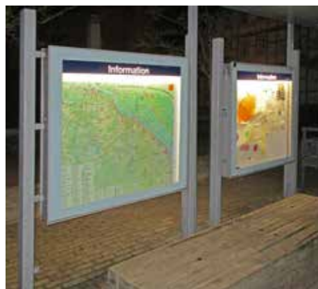
Jetzt kann man sich auch im Dunkeln informieren

Damit können sich nun Gäste und Bürger zu jeder Tages- und Jahreszeit auch an diesem zentralen Platz über die Freizeitregion Dahlenburg informieren. Es werden dort regelmäßig neue Veranstaltungen und allgemeine nützliche Informationen ausgehängt.