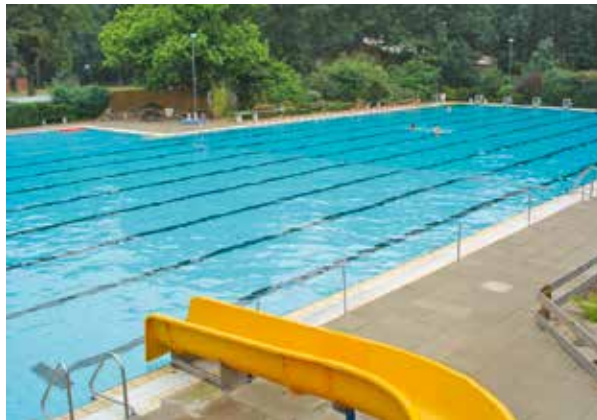
Das Dahlenburger Freibad öffnet am 18 April

Die vergünstigten Saisonkarten für das Freibad sind zu moderat angepassten Eintrittspreisen vom 16.03. bis zum 16.04.