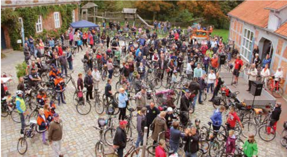
ElbeVeloTour: Vor dem Start auf dem Bleckeder Schlosshof

Unter dem Motto „Drei Länder - drei Städte - ein Fluss“ läuten die drei Elbe-Städte Bleckede, Boizenburg und Lauenburg den Beginn der diesjährigen Fahrradtouren ein, bei der die charakteristische Naturlandschaft des UNESCO Biosphärenreservats „Flusslandschaft Elbe“ entdeckt werden kann.