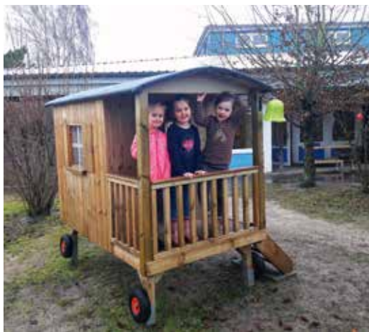
Durch eine Spende der Firma Post konnte dieser tolle Bauwagen angeschafft werden

möchte sich auf diesem Wege bei allen bedanken, die uns bis hierher unterstützt haben. Allen voran natürlich unserer Eltern-