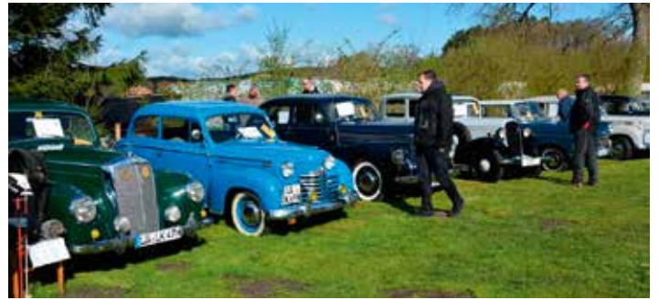
Die Besucher können liebevoll restaurierte Oldtimer bestaunen

Um den langen, aber auch sehr schönen Tag am Ende noch etwas abzurunden, können die Naschkatzen sich dann an den Süßigkeitenständen, den Softeiswagen oder auch dem großzügigen und leckeren Kuchenbuffet auf dem Hof Gerstenkorn erfreuen.