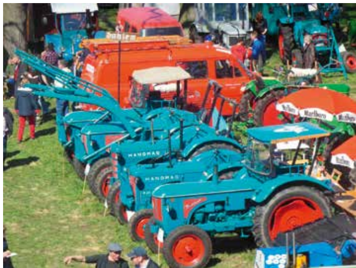
Tractor & Co werden auch wieder in großer Zahl zu bewundern sein

der, Traktoren und Feuerwehrfahrzeuge den Weg in das beschauliche Örtchen.