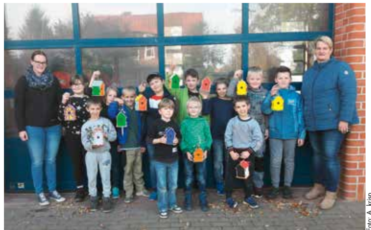
Die Kinderfeuerwehr Nahrendorf mit Betreuerinnen

Nach der Sommerpause ging es mit der Teilnahme am Orientierungsmarsch in Gienau weiter. Die Kinder schnitten gut ab und gingen mit Pokal und Urkunde nach Hause. In dem anschließenden Dienst folgte die Überprüfung der Hydranten in Nahrendorf. Die Kinder machten sie zusammen mit aktiven Kameraden „winterfest“ und lernten den Umgang mit dem Standrohr. Anfang November folgte der jährliche Laternenum-