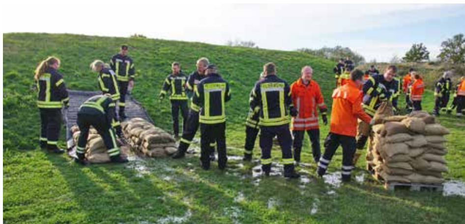
Nach dem Theorieteil wurde das Erlernete in der Praxis geübt

Die Ausbildung am „kürzesten Deich des Landkreises“ ist somit ein echtes Erfolgsprojekt und ein wichtiger Baustein in der Vorbereitung auf zukünftige Hochwasserereignisse!