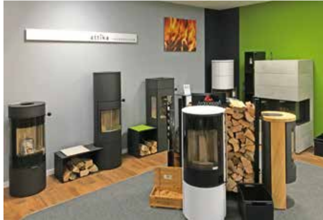
Größer und attraktiver: Blick auf einen Teilbereich der neuen Ausstellung

bot, dazu gehören Pelletöfen, Kachelöfen, Specksteinöfen, Kaminöfen und -anlagen sowie Küchenherde. Vertreten sind Produkte von namhaften Herstellern aus Deutschland, Österreich, der Schweiz und Skandinavien. Der Betrieb legt Wert auf Qualität der Produkte.