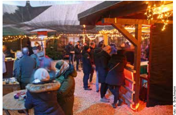
Klößchnack auf dem Weihnachtsmarkt

Am Sonntag beginnt der Weihnachtsmarkt um 11:00 Uhr mit Pastorin Kristin Bogenschneider beim traditionellen Gottesdienst im Sportlerheim und er klingt ab 17:30 Uhr mit dem gemeinschaftlichen Sin-