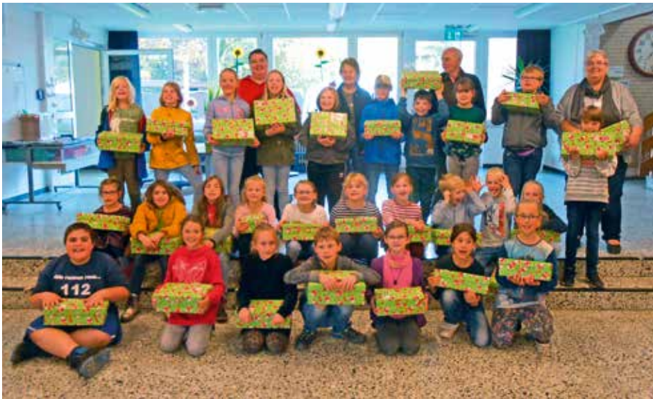
Die Altenmedinger Grundschüler präsentieren stolz die von ihnen gepackten Päckchen

Die fertigen Weihnachtsgeschenke wurden dann vom Ortsverein Altenmedingen im Schuhhaus Sündermann in Bad Bevensen abgegeben, wo sich eine der Sammelstellen befindet.