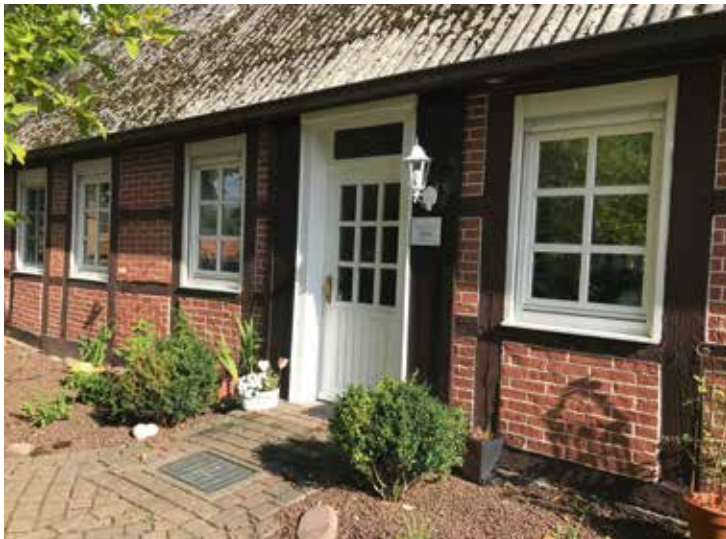
Immobilienwirtin Sabine Zschunke verfügt über eine große Erfahrung, gerade im Bereich Bauern- und Resthöfe

Durch ansprechende Exposés, 360°-Rundgang in der Immobilie und Insertion auf allen wichtigen und relevanten Vermarktungskanälen können Sie sicher sein, dass Ihre Immobilie bestens am Markt platziert wird.