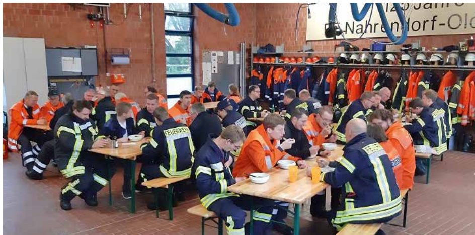
Nach der Siegerehrung durfte ein Stärkung nicht fehlen

Erster Sieger wurde die Freiwillige Feuerwehr Tosterglope vor den Wehren aus Nahrendorf-Oldendorf und Dahlem.