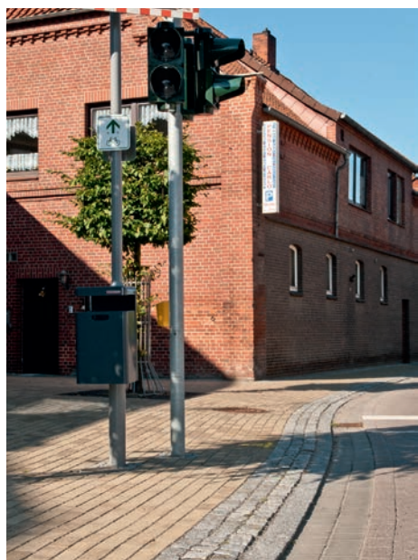
Fußgänger sei guten Fußes an Deiner Ampel!

Schauplatz Bedarfsampel Lüneburger Straße/Ecke An der Burg. Drückst du den Knopf, gelangst du als Fußgänger sicheren Schrittes auf die gegenüber liegende Straßenseite. So dachte ich, als ich in meinem Wagen eben dort bei Rot anhielt, um eine ältere Dame, die ihren Mann im Rollstuhl vor sich her schob, passieren zu lassen.