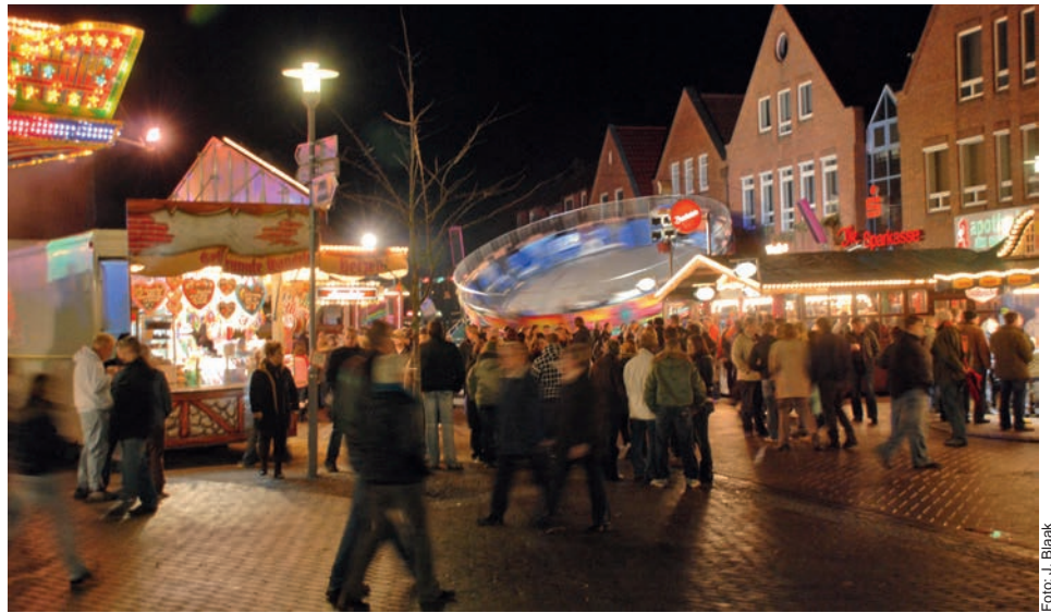
Fahrspaß, Ausstellungen und ein vielfältiges kulinarisches Angebot locken zahlreiche Besucher nach Dahle n burg

Abgerundet wird der Martinimarkt durch ein großes Weinzelt mit Livemusik, das seit