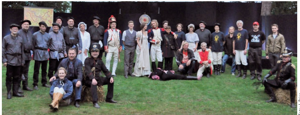
Das Ensemble der Göhrdefestspiele 2013

Mit der erweiterten Fassung des bereits 2011 aufgeführten Theaterstückes „1813 Liebe und Tod in der Göhrde“ (Autor und Regie: Gabriel Reinking) ist es den Organisatoren zwar nicht gelungen, mehr Besucher in den Burgflecken nach Dahlemburg zu locken. Auf der anderen Seite aber wollten mehr als je zuvor die nachgestellte Schlacht an der Göhrde und das Biwakleben aus der napoleonischen Zeit sehen, sodass am Ende eine publikumswirksame Veranstaltung steht, die ihresgleichen sucht. Viele auswärtige Besucher und norddeutschlandweite Pressezeilen, Funk- und Fernsehbilder prägten diesen Spätsommer.