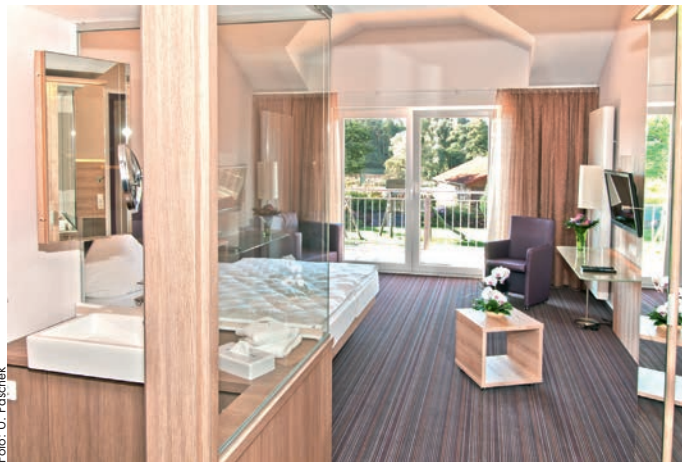
Die Zimmer sind modern, zugleich geschmackvoll und gemütlich eingerichtet

Jetzt schon an Weihnachten denken! Für die Ausrichtung einer stilvollen Weihnachtsfeier ist das Landhotel genau der richtige Ort. Melden Sie sich rechtzeitig zum beliebten Weihnachtsbuffet an beiden Weihnachtstagen an. Familie Hermann und ihre Mitarbeiter freuen sich auf Ihren Besuch.