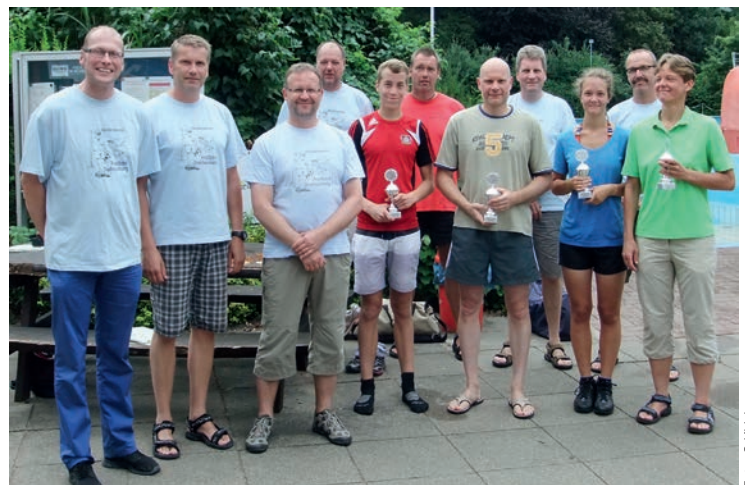
Die Sieger vom ersten Aquathlon im Dahlemburger Freibad mit Pokalen und dem Veranstalter-Team

Im kommenden Jahr wird der Förderverein zum Erhalt des Freibades wieder zu einem Aquathlon einladen.