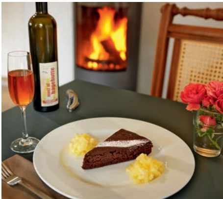
Da kann der Herbst ruhig kommen. In der appleslounge sitzt man warm und trocken.

Sie können natürlich gern allein kommen, aber auch für Gruppen ist die appleslounge bestens geeignet. Die Planung und Ihre individuellen Wünsche können Sie mit dem Team der appleslounge abstimmen. Unter 05851 9445233 werden alle Ihre Fragen dazu beantwortet.