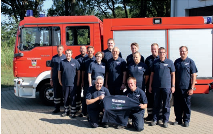
Einheitlich gekleidet sieht besser aus: Mitglieder der FF Boitze

In einer kleinen Feierstunde überreichte