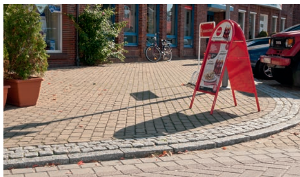
Am Markt/Ecke Mühlenstraße: Beidseitig unterbrechungsfreie Kante

Dass vor dem Rathaus und der Apotheke am Markt die Kanten in Teilbereichen etwas abgerundet sind, ist eigentlich nur Kosmetik und bringt dem Personenkreis, um den es hier vorrangig geht, rein gar nichts. Dabei sind gerade dies stark frequentierte Anlaufstellen für ältere Menschen.