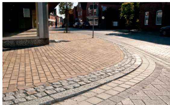
Granit behau'n mit Zwischenraum hindurch zu schau'n

Man stellt sich als Nicht-Baufachmann die Frage, was da schief gelaufen sein könnte bei der Planung und/oder der Ausführung? Am Beispiel Bad Bevensens hätte man lernen können, wo ein Granitpflaster mit Kanten und hohem Sturzpotenzial kom-