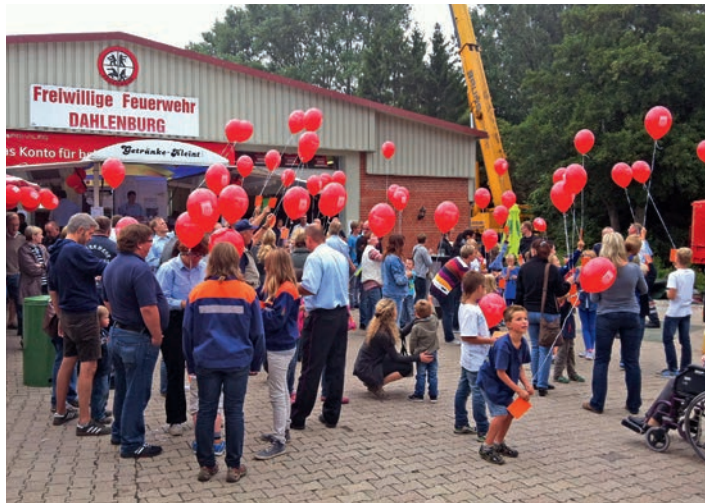
Welcher Ballon wohl am weitesten fliegt?

Eine große Tombola mit tollen Preisen rundete die Veranstaltung ab. An dieser Stelle möchten wir uns bei allen Spendern recht