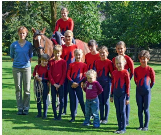
Die Kinder zeigten, was sie mit Oskar gelernt hatten