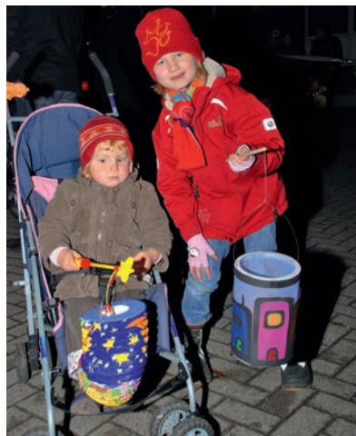
Ich gehe mit meiner Laterne ...

[ heja ] Begrüßen Sie mit uns die ruhige Jahreszeit mit dem traditionellen Laternenumzug zur Eröffnung des Dahle n burger Martinimarktes am Freitag. Los geht es ab 17:00 Uhr bei der Volksbank in Dahle n burg. Dort versorgen wir die Kinder mit Laternen und Süßigkeiten, um sich den Rummel etwas zu versüßen. Auch die Schausteller wollen dieses Jahr wieder etwas beitragen und spenden kleine Spielzeuge und Frei-Chips, welche mit an die Kinder verteilt werden. Wenn alle Kinder versorgt sind, setzt