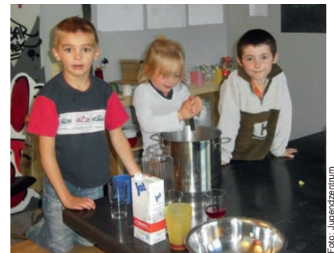
Spannend, wie viel Leckerer man aus Kartoffeln machen kann

Los geht es mit Kochaktionen rund um die Kartoffel. Die Kartoffel gilt als typisch deutsch, dabei stammt sie aus Südamerika und es gibt rund um den Globus leckere Kartoffelrezepte. Deshalb probieren wir ganz unterschiedliche Kartoffelgeschmäcker aus: Indische Kartoffelpuffer, englischen Kartoffelaufbau oder chinesische Kartoffelpfanne. Im Oktober werden wir Köstliches aus Äpfeln zaubern und im November kommt unsere Nudelmaschine zum Einsatz. Schließlich geht es dann um die ganze Vielfalt der Nudeln von Spaghetti bis zu Spätzle und asiatischen Nudeln.