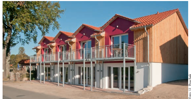
Das neue Appartementhaus „Kartoffelscheune“ des Landgasthof Stössel in Bohndorf

Das 3-Sterne-superior Hotel - als besonders familienfreundlich ausgezeichnet - hat in diesem Jahr sichtbar erweitert: In der neuen, an den Landgasthof unmittelbar anschließenden „Kartoffelscheune“ sind sechs geräumige Komfort-Doppelzimmer und vier Einzelzimmer entstanden, mit Balkon oder Terrasse. Davon eines Behinderten gerecht. Hier kann der Gast den wunderschönen Ausblick auf den Heidegarten und die Natur genießen, während er seinen Aufenthalt in den modernen, dennoch stilvoll-gemütlichen Zimmern