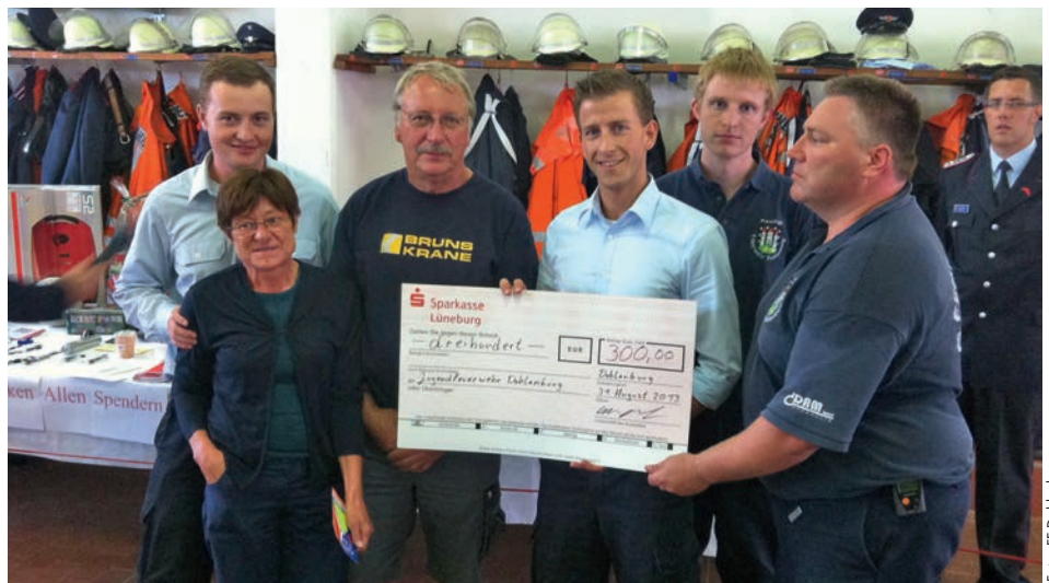
Scheckübergabe an die Jugendwarte der Feuerwehr Dahleburg

Die Jugendlichen kommen einmal in der Woche am Feuerwehrhaus zu Ausbildungs- und Übungsdiensten zusammen. Gemeinsam wird dann mit viel Spaß und Engagement zum Thema Feuerwehr geübt und so der Nachwuchs ausgebildet.