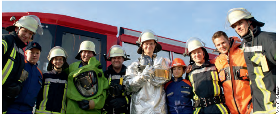
Einsatzkräfte der Feuerwehr und Mitglieder der Jugendfeuerwehr

Bei einem Kreislaufstillstand verringert sich die Chance auf erfolgreiche Wiederbelebung mit jeder Minute um ca. 10%.