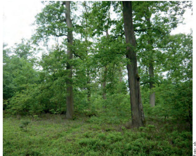
Nachhaltige Forstwirtschaft erhält unsere Wälder

der Umgang mit Krankheiten, die Preisentwicklung, die beim Anpflanzen von Bäumen in keiner Weise vorauszusehen ist und die Folgen nachhaltiger Forstwirtschaft für Klima und Grundwasserstand waren Thema des Vortrages und wurden von Herrn Forstdirektor Hewicker anschaulich und ver-