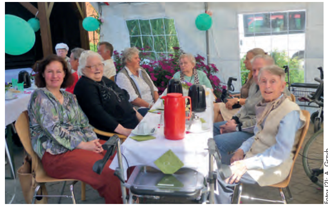
Fröhliche Stimmung bei Hugo, Kaffee und Kuchen