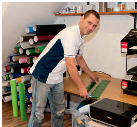
Folien in fast jeder Farbe sind erhältlich