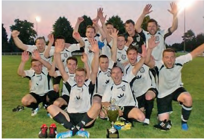
Die siegreiche Mannschaft des TuS Barskamp

Platzierung: 1. TuS Barskamp; 2. VfL Bleckede; 3. SV Karze; 4. All-Star-Mannschaft.