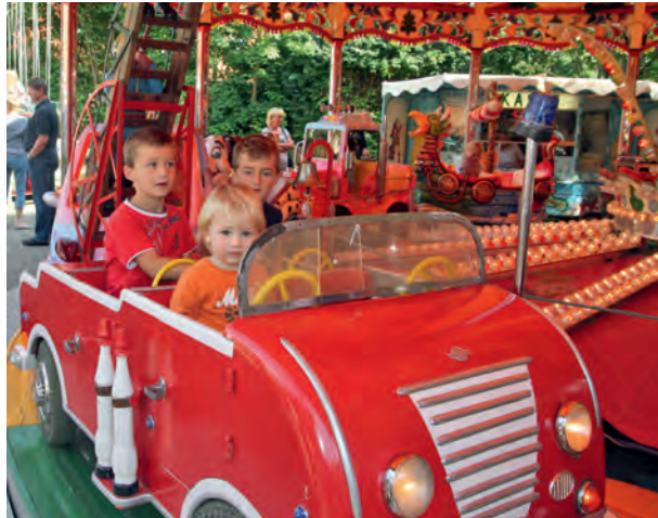
„Fahren ohne Führerschein“ ist hier Pflicht

bereits das Leben. Es gibt einen Frühschoppen und Essen (unter anderem eine leckere Erbsensuppe) auf dem Marktplatz. Für die musikalische Begleitung sorgt der Humberger Posaunenchor. Zu dem Markttreiben gibt es auch wieder einen Flohmarkt für die jüngsten Händler der Gemeinde. Der Kaf-