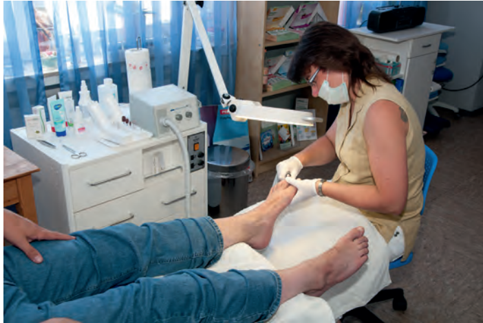
Auch Männer freuen sich über gepflegte Füße

Zu ihren Tätigkeiten zählen klassische Fußpflege, das Entfernen von Hühneraugen oder Dornschielen, aber auch Fuß- und