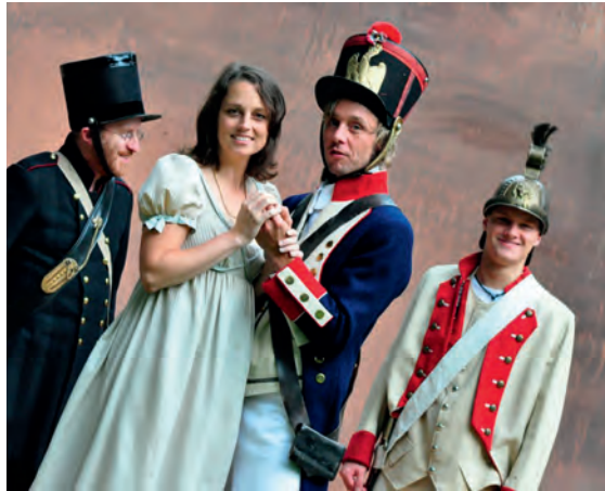
„1813 - Liebe und Tod in der Gohrde“: Theater in der Naturkulisse am Dahle n burger Heimatmuseum

Am dritten Wochenende reisen rund 400 Nachsteller aus ganz Mitteleuropa zum Reenactment (Nachstellung) der Gohrdeschlacht von 1813 an den Originalschauplatz. Dann wird zwei Tage lang im Jahr 1813 gelebt, gekämpft und gefeiert mit Lazarett n achstellung, Reitervorführungen,