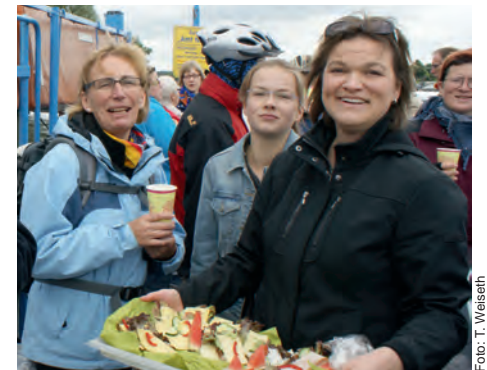
Gern nahmen die Fährgäste die Erfrischung an