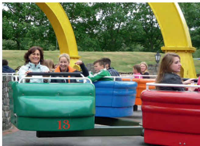
Da kann einem schon schwindelig werden!

Der Eine mochte es lieber ein wenig wilder und wählte die Fahrt mit einer Achterbahn, der Andere bevorzugte eine ent-