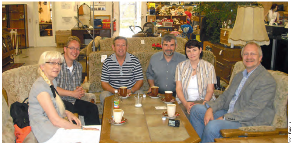
Die polnischen Besucher im Gespräch im Fundus Dahleburg