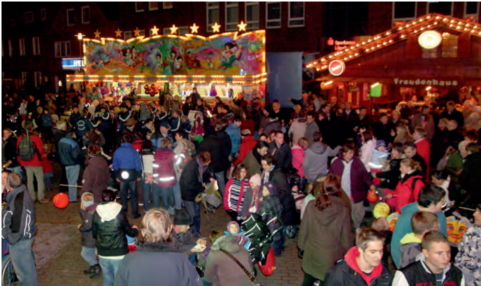
Auch in diesem Jahr kamen hunderte Besucher und erfreuten sich an dem bunten Marktreiben