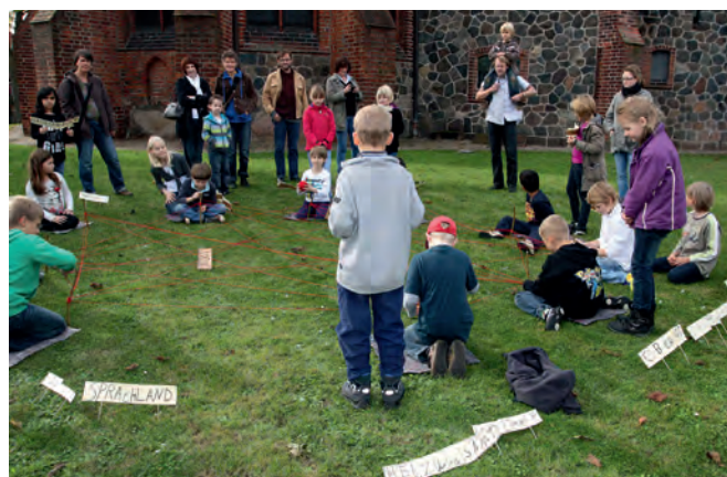
Kinder der 3. Klasse weben mit Wolle unter Einbeziehung der Sprachfindungen ein Netzwerk

Zum Ende des Sprachspiels stellten die Drittklässler ihr Projekt auf dem Dahlemburger Markt vor. Dazu eingeladen waren auch die Eltern. Die Kinder schlugen kleine Stöckchen vor sich in den Boden. An einem wurde ein Wollknäuel befestigt und dann zum nächsten geworfen. Nach jedem Wurf wurde eine Wortschöpfung aufgestellt. Durch das hin-