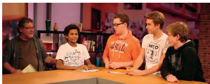
Beim Backstage-Workshop: Hier dürfen alle mal Moderator sein

Sicherlich war es gewöhnungsbedürftig, selbst am Mikro zu sitzen, die Alltagssprache im Radio zu benutzen („Ampel“ bedeutet: Studio/Moderation/Mikro..., und „Brücke“ wies auf den Redakteur und die laufende Sendung hin) –, um last but not least sich selbst zu hören. Eine interessante Erfahrung für die Mariener, die leibhaftig erfuhren, wie „Radio geht“ und die