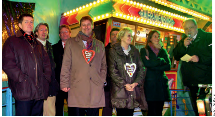
Bürgermeister Bernd Chudzinski (rechts) eröffnete im Beisein von Bundestags-, Landtags- und Kreistagsabgeordneten, die auch in diesem Jahr wieder das Traditionsfest besuchten, den Martinimarkt

Als Resümee darf festgehalten werden, dass dieser Markt in geordneten Bahnen, Ruhe und sauberen Straßen und Plätzen verlaufen ist. Das Höhenfeuerwerk warf für gut zehn Minuten einen