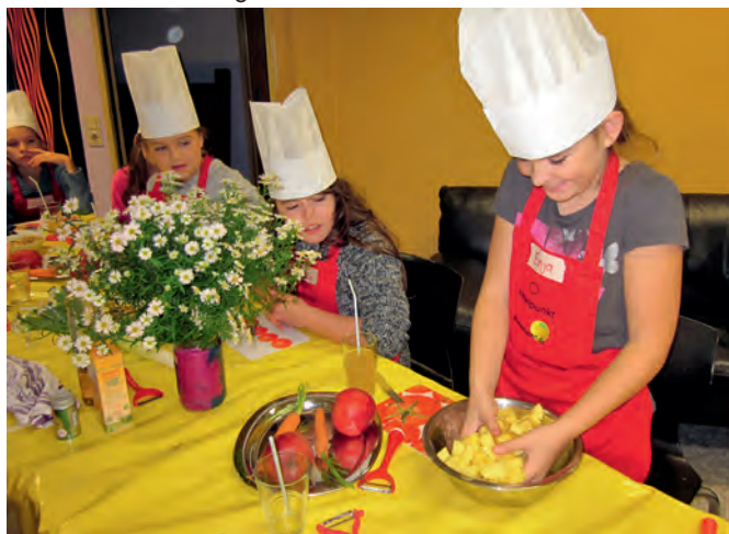
Den kleinen Köchen sieht man den Spaß an der Arbeit an

fel-Möhrensalat mit der geheimnisvoll klingenden Nachspeise Himbeertraum auf Wolke. Bei der Herstellung lernten die Kinder ganz nebenbei, wie man die Gefahren, die