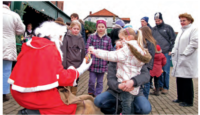
Das Highlight für „Groß und Klein“ ist der Besuch des Weihnachtsmannes

Wir freuen uns auf Sie am 9.12. von 12:00 - 18:00 Uhr auf dem Marktplatz. Ihr WIR-Team