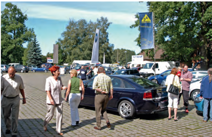
Auch in diesem Jahr bieten die Aussteller ein vielfältiges Programm