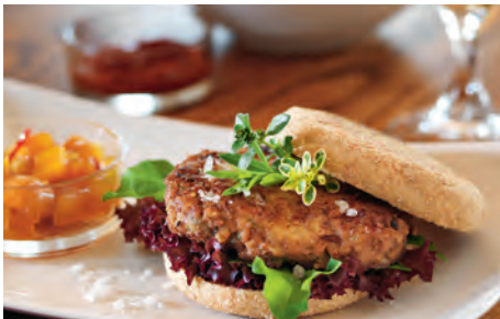
Der Lüneburger: speziell gewürztes Hack mit Apfelchutney und Salat im selbstgebackenen Salz-Brötchen.

Da wir alles frisch zubereiten, gibt es das Menu nur auf Vorbestellung unter 05851 944 5233 oder über www.appleslounge.de . Hier finden Sie auch Hinweise auf unser Kulturprogramm (im August wird z.B. Rudi Kargus die neue art of cider-Edition – einen cider nach seinem Geschmack mit zugehöriger Originalgrafik von ihm – vorstellen). Schauen Sie also ruhig mal rein. Übrigens: Für Gruppen bis 30 Personen findet sich auch außerhalb der normalen Öffnungszeiten der geeignete Rahmen. Wir von der appleslounge kümmern uns gern um alles, was Ihre Veranstaltung oder Ihr Fest zum Erfolg macht.