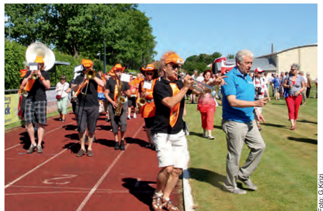
Voran die Musik, so zog die Karawane von Spielstation zu Spielstation

... die Partner der Workshops. Erst mit Ihrer Bereitschaft, mit Ihrem persönlichen Einsatz, mit Ihrer fachlichen Kompetenz war es möglich, Einblicke in Wirtschaft, Politik,