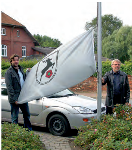
Fahnenhissung zur offiziellen Eröffnung nach der Ratssitzung um 8.30 Uhr in der Früh. Danach geht es zum Frühstück mit der Bevölkerung

Der Haupttag ist wie gewohnt der erste Dienstag im September. Der Dienstag, 4.9., beginnt um 8:30 Uhr mit einer öffentlichen