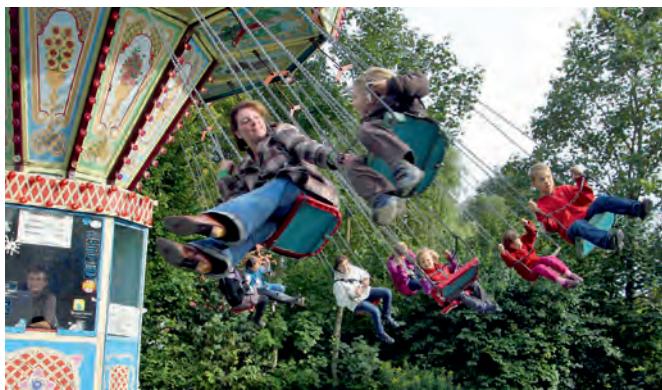
Ob Autoskooter, Kettenkarussell oder kleine Kinderkarussells – der Himberger Markt bietet für alle eine Vielfalt an Vergnügen