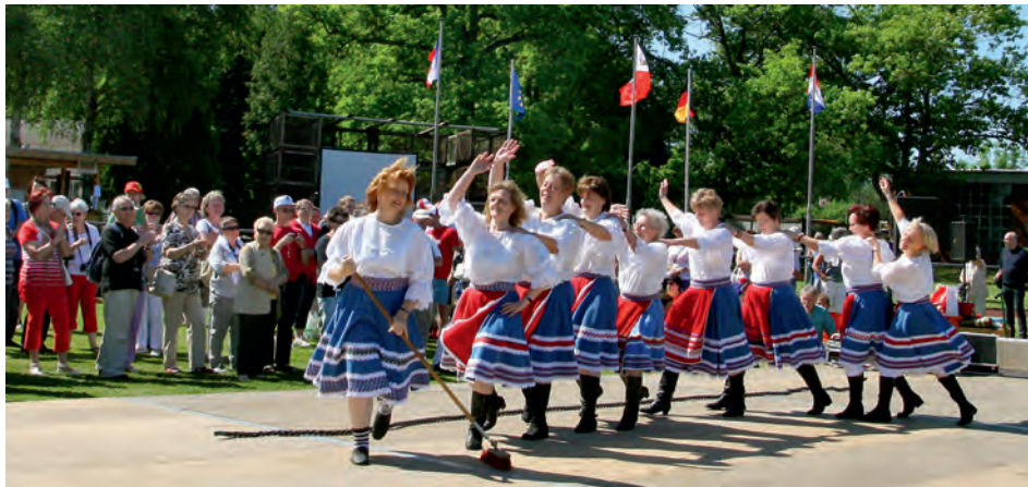
Die Deelenpedder sorgten für ein schwungvolles Programm mit Tänzen aus Polen, den Niederlanden und Frankreich