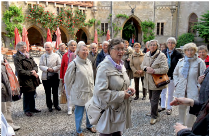
Stunend betrachteten die Besucher die prachtvoll gebaute Marienburg. Während der ganzen Reise erfuhren sie viel wissenswerte über die Geschichte der Welfen

Und wer wissen möchte, woher der Spruch: „Es ist alles in Butter!“ nun wirklich herkommt, der wendet sich bitte an das DRK Dahleburg oder fährt einfach zur Marienburg. Die Fahrt lohnt sich. Sogar eine Blutspende hat dort am 3. Juni stattgefunden.