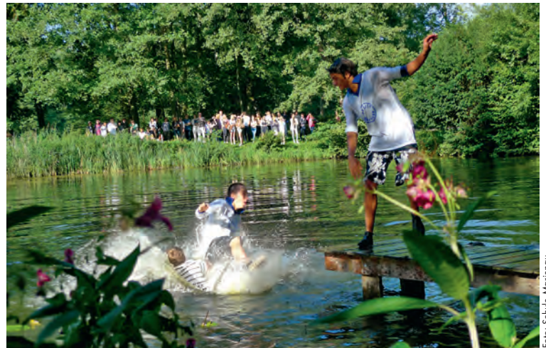
Für die Schüler in Marienau beginnt mit der „Taufe“ ein neuer Lebensabschnitt

[ rr ] Für zwölf Kinder war der 1. Juli ein besonderer Tag: Sie wurden in ihrer zukünftigen Schule Marienau begrüßt und darauf vorbereitet, was sie hier erwartet und worauf sie sich jetzt schon freuen können. Dazu hatten die jetzigen Fünftklässler im Rahmen einer Unterrichtseinheit das Märchen „Rosamund, die Starke“ für ihren Bühnenauftritt teils aus ihrem Deutschbuch übernommen, teils selber verfasst. Die Schüler der 8. Klassen aus dem Wahlpflichtfach Theater/Kunst haben in ihrem Musical „Löwenherz“ spannungsreiche Gegensätze wie Mittelalter und Gegenwart, Mut und Feigheit, Verantwortungsgefühl und Gleichgültigkeit, vor allem aber Freundschaft und Feindschaft, auf die Bühne gebracht. Es wurde deutlich, dass in Marienau großer Wert gelegt wird auf Gemeinschaft und Freundschaft. Das Lied „Du bist nicht allein. Wenn Du Dich einsam fühlst und alleine, dann such einen Freund da draußen!“ unterstrich die Intention und zauberte in die angespannten und aufgeregten Gesichter der kleinen Zuschauer zunächst Begeisterung und gespannte Erwartungshaltung, letztendlich aber Erleichterung und große Vorfreude auf das kommende Schuljahr.