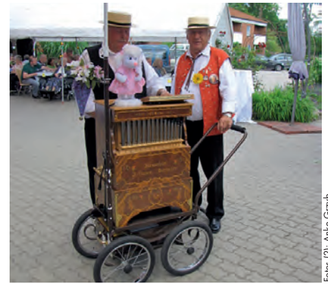
Zwei Leierkastenspieler aus Hitzacker