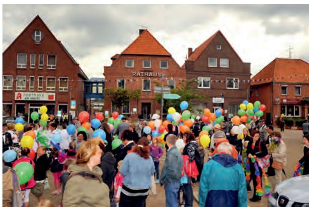
Die Kinder lassen Luftballons steigen. Der Auftakt jedes Kinderschützenfestes.

weiligen Tag sorgt das Kinderkomitee unter der Leitung von Kinderleutnant Hilbert Barge. Erstmals werden in diesem Jahr die Kinderkönige mit dem Lichtpunktgewehr ermittelt, mit verschiedenen Spielen wird für die Unterhaltung der Kinder gesorgt. Für die Teilnahme am Kinderschützenfest sollte im Vorwege eine Ausmarschkarte für die Kinder bei der Buchhandlung Kolibri oder kurzfristig vor dem Ummarsch am Marktplatz erworben werden. Höhepunkt an diesem Tag ist die Proklamation der neuen Kindermajestäten um 16:30 Uhr mit anschließender Polonaise. Die Preisverteilung bildet dann den Abschluss des Kinderschützenfestes. Auch für die Erwachsenen geht dann das Schützenfest dem Ende zu. Für einen gemütlichen Ausklang sorgt die Bleckeder Blasmusik im Rahmen des Königsbiers ab 17:00 Uhr.