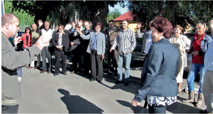
„Auf Wiedersehen“ bis zum nächsten Mal. Freunde verabschiedeten sich

[ mada ] Die Freundschaft mit der 10 Stunden (650km) entfernten Gemeinde im Landkreis Wongrowitz besteht seit 1999 und geht auf eine Initiative Dahlenburger Bürger zurück, die früher dort gelebt haben und sich ihrer Heimat verbunden fühlen (Urkundenunterzeichnung in Dahlenburg 2003 und in Damaslawek 2004)