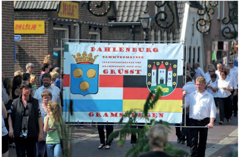
Die Dahlenburger Delegation beim Festumzug