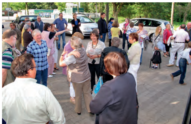
Herzliche Begrüßung von Freunden

da das neue Viertel mit altersgerechten Wohnungen mitten im Ort viele ältere Neubürger anzieht. Was für uns Lüneburg, ist für Le Molay-Littry Bayeux mit weiterführenden Schulen, Verwaltungen, Geschäften, der riesigen Kathedrale und Museen, wie z.B. die berühmte Tapissiererie mit dem ca. 50 m langen Wandteppich aus dem Mittelalter, oder das Musée de bataille, das die Landung der Alliierten im Juni 1944 dokumentiert.