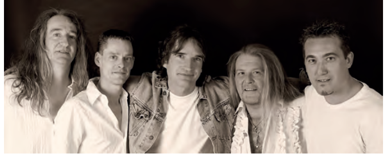
Die „Rock 'N Roll Deputyz“ aus Lüneburg sorgen am 30. Juni für Stimmung beim Autohaus Hartmut Hacker