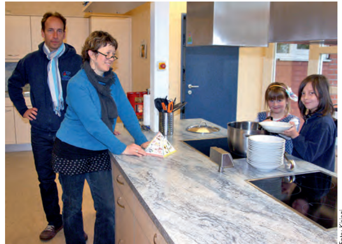
Gesunde Küche wird ganz groß geschrieben in der Grundschule Neu Darchau. Und so freuen sich die Rektorin und der Elternratsvorsitzende, dass das E-Werk für das Mittagessen von 1.000 Euro spendete

Die kleine Grundschule steht am 21. April von 11.00 Uhr bis 15.00 Uhr im Blickpunkt: Eltern und Interessierte sind zu einem Tag der offenen Tür mit einem bunten Programm eingeladen.