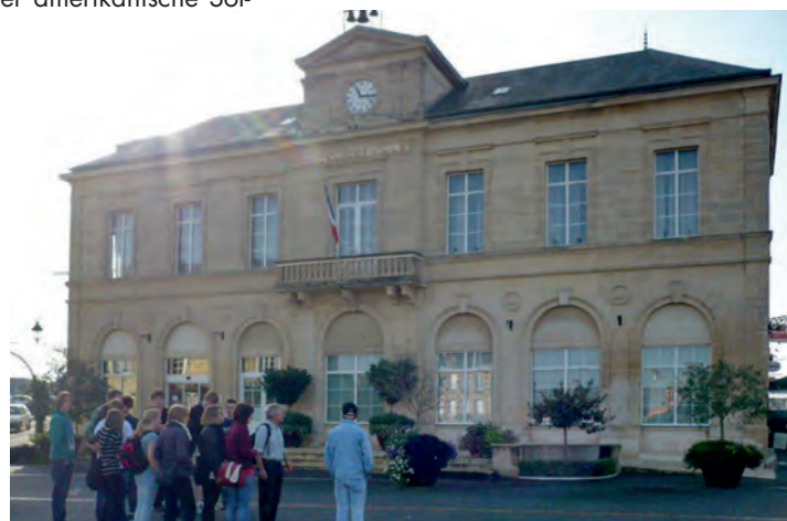
Besuch des Rathauses von Le Molay-Littry