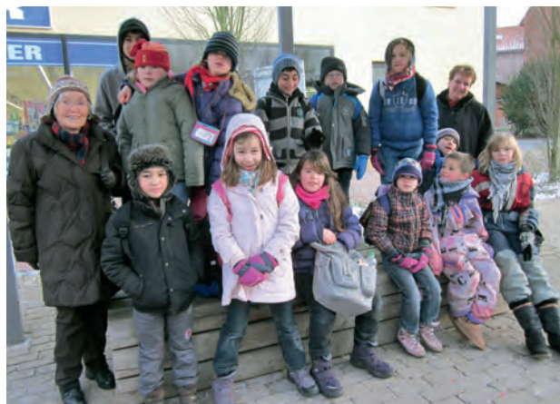
Los geht's - gespannte Erwartung bei den Kindern