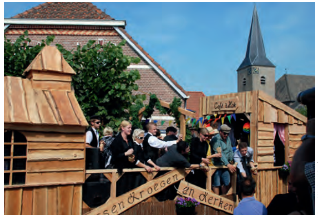
Festumzug in Gramsbergen