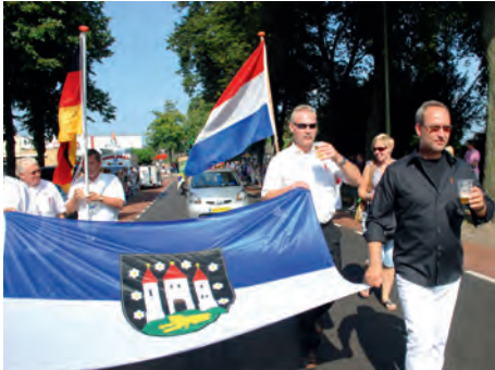
Stolz tragen die Dahlenburger ihr Wappen