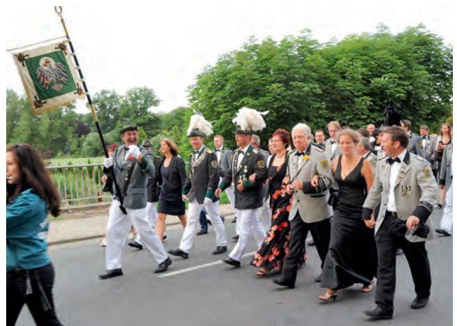
Vorfreude auf den Ball. Die Gruppe „Musik & Fun“ wird das Schützenhaus zum Beben bringen.

Sonntag, 3. Juni: Der dritte Schützenfesttag - der Tag der Kinder - beginnt um 10:00 Uhr mit einem Gottesdienst in der St. Johannis-kirche zu Dahleburg. Um 11:00 Uhr treffen sich die Korps zum Frühstück in Ihren jeweiligen Vereinslokalen, um gestärkt für das Kinderschützenfest um 12:45 Uhr am