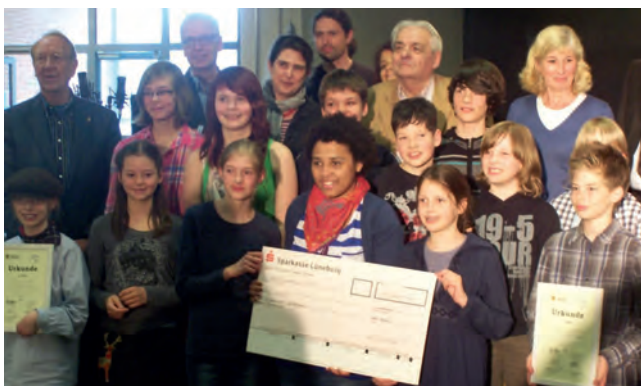
Preisträger und Jury bei der Preisverleihung am 20. April 2012

Weitere Aufführungen von Musik bewegt - sich III sind nun geplant: Pfingstmontag, 28. Mai, 11:30 Uhr beim 6. Pfingstfestivalchen in Tosterglope; Elbschloßfestival, 3. Juni, 16:00 Uhr, Schlosshof Bleckede; Samstag, 22. September, 16:00 Uhr: 10 Jahre KUNSTRAUM TOSTERGLOPE.