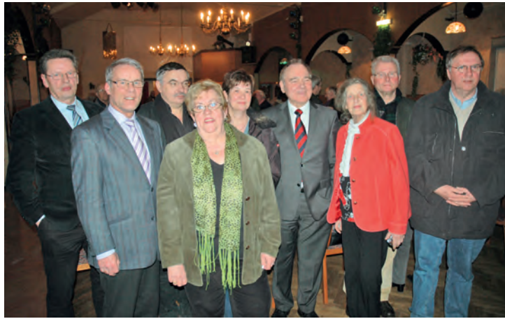
Vereinsgründung Förderverein Brücken bauen e. V.

Der Förderverein Brücken bauen e.V. freut sich über weitere Mitglieder. Eine Beitrittserklärung zum Ausschneiden finden Sie auf dieser Seite.