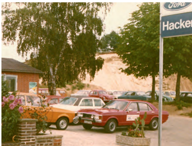
So sah es 1987 in Ellringen aus

Im Autohaus Hartmut Hacker wird ausgebildet, die Qualifizierung des Nachwuchses