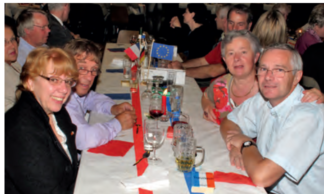
Begegnungen beim Besuch im Jahr 2011

lege (vergleichbar mit unserer Haupt- und Real- jetzt Oberschule). Ca. 700 Kinder und Jugendliche besuchen diese Einrichtungen (Stand 2012). Die Einwohnerzahl Le Molay-Littrys ist in den letzten Jahren gewachsen,