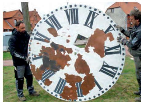
Der Zahn der Zeit macht auch vor Ziffernblättern keinen Halt.

[ gs ] Eine rhetorische Frage, die auf so manchem Geburtstag, Jubiläum oder Jahrestag gestellt wird. Für die Dahleburger, die es gewohnt sind, mal eben auf die Kirchturmuh zu schauen, um zu sehen wie spät es ist, gibt es hier eine Antwort: In Hamburg bei der Uhren- und Glockenfirma Iversen & Dimier. Aber die Zeit kommt bis Pfingsten, so wurde es uns zugesagt, wenn Europa bei uns in Dahleburg zu Gast ist, wieder. Am Mittwoch nach Ostern mussten alle 4 Zifferblätter der Kirchturmuh in 30 Meter Höhe mit Hilfe eines riesigen Krans abmontiert werden, da die Farbe großflächig abblätterte. Ein bloßes Ausbessern, wie zunächst geplant, war nicht mehr möglich. Die Zifferblätter müssen einen neuen speziellen Farbstrich bekommen. Das Uhrwerk selbst ist in Ordnung und tut, wenn es jede Woche aufgezogen wird, seit 107 Jahren treu seinen Dienst.