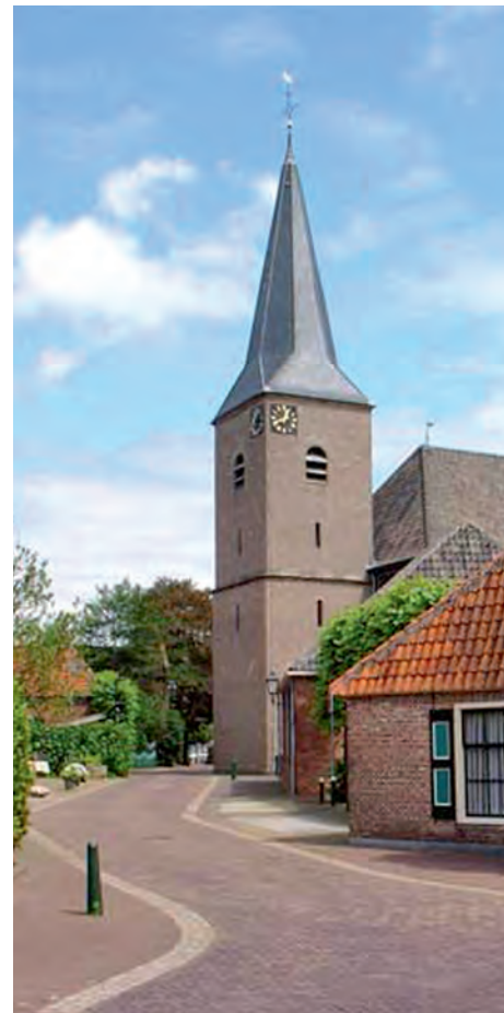
Kirche in Gramsbergen

09:00 Uhr: Verabschiedung unserer Gäste im Schützenhaus und Abreise.