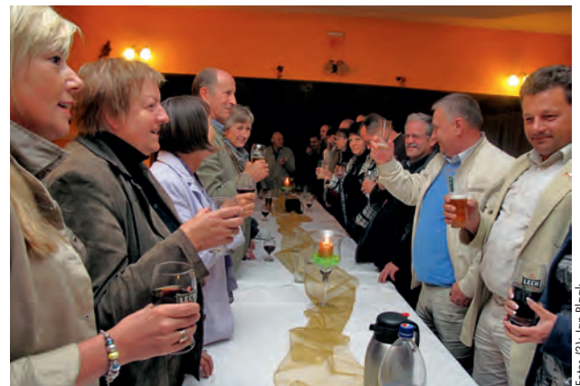
Fröhliche Stimmung in geselliger Runde