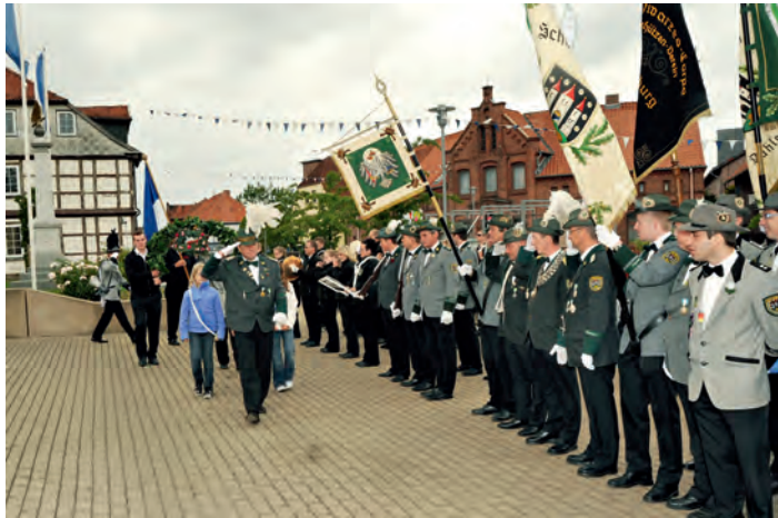
Die Eröffnung des Dahleburger Schützenfestes wird mit Böllerschüssen auf dem Marktplatz gefeiert. Der darauf folgende Ummarsch führt zum Dorn.

[lapi] Alle Jahre wieder heißt es „es ist wieder soweit“ für die Bürgerinnen und Bürger der Region: Schützenfest in Dahleburg.