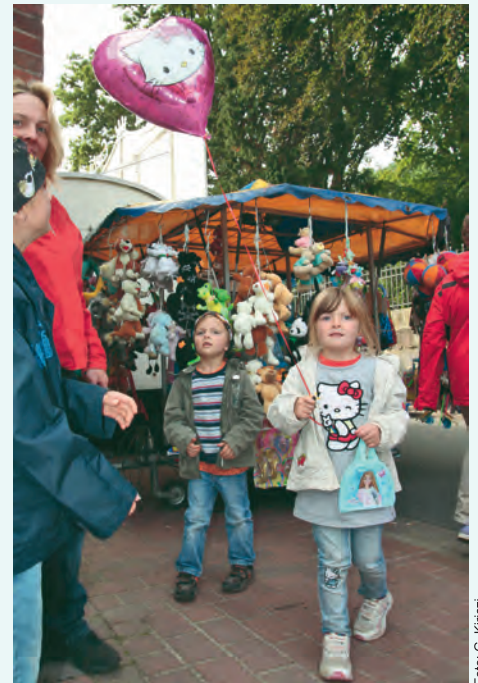
Nicht nur für die Kleinen gibt es viel zu entdecken auf dem Himberger Markt

Prost Jahrmarkt ist der Gruß am Dienstag beim Himberger Markt – und