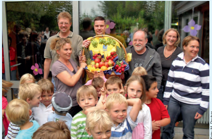
Die Sponsoren überreichen den üppigen Warenkorb an den Kindergarten Dahleburg

Dabei handelt es sich nicht einfach nur um eine einmalige Spende dieser so wichtigen Ernährungskomponenten für unsere Kleinen, sondern um eine Aktion, die dem Kindergarten für ein Jahr regelmäßige „Vitaminzufuhr vom Feinsten“ sichert!