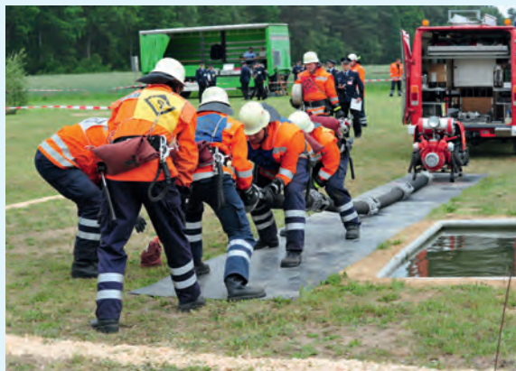
Geschicklichkeit und Tempo waren hier gefragt

pe vom 3. Zug mit 404,63 Punkten. Diese drei Gruppen qualifizierten sich damit für den Kreiswettkampf. Auf die Plätze 4 bis