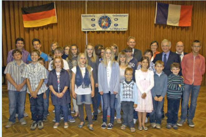
Die 14 Kinder und Jugendlichen aus der Partnergemeinde freuten sich über die herzliche Aufnahme in den Familien und fühlten sich im Kreise ihrer Gastgeber und Kinder wohl. Sprachschwierigkeiten gab es beim Spielen kaum.

Ein interessantes Programm hatte der Ar-