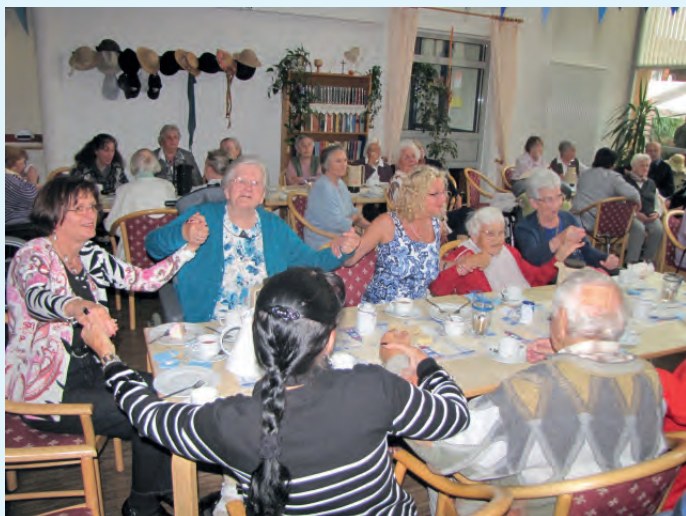
Bewohner und Angehörige genossen die ausgelassene und fröhliche Stimmung

maßen für unsere Bewohner, Angehörige und Gäste, wie auch für alle Mitarbeiter, waren wieder rundum begeistert. Beim gemeinsamen Kaffeetrinken wurde natürlich auch ausgiebig geklönt.