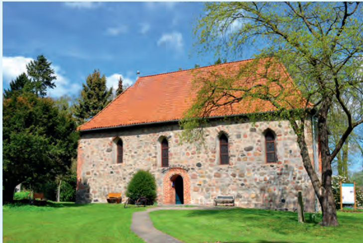
Festspielort Dahlemburger Heimatmuseum