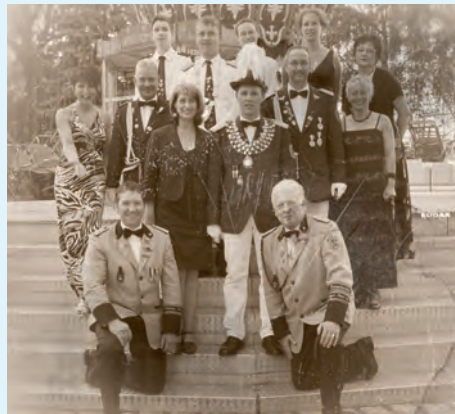
Die Königsfamilie 2011

Im Anschluss wurde das Königsschießen eröffnet. Parallel nahmen die Damen und Jungschützen Platz, um ihre neue Majestäten zu ermitteln.