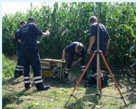
Geschicklichkeit ist beim O-Marsch gefragt

Feuerwehren, die am 18. September an den Start gehen möchten, können sich beim Ortsbrandmeister der Feuerwehr Gienau, Markus Brusche, anmelden. Telefon 05807 979218 (ab 19:00 Uhr) oder unter 0170 2436042.