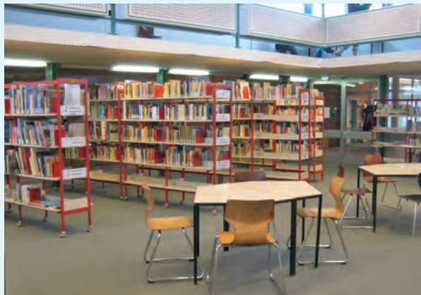
Innenraum der Bibliothek

Unser Anliegen ist es, Kinder und auch Erwachsene, wieder mehr zum Lesen zu bewegen, denn bei diesem Hobby kann man herrlich vom Alltag entspannen, sich informieren oder weiterbilden.