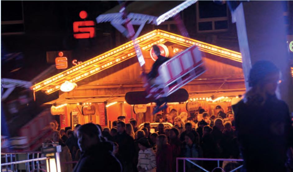
Fahrspaß und Leckereien - auch in diesem Jahr kamen die Besucher auf ihre Kosten

Ein besonderer Hingucker war am Sonntagnachmittag die Bremer Stelzensippe, die mit bis zu 3,50 Meter nicht nur das