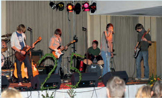
Die Schülerband „Ausgemustert“ aus Marienau eröffnete den Konzertabend