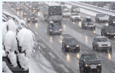
Der letzte Winter hatte es insbesondere für die Autofahrer in sich. Ob es wieder so wird, lässt sich schwer voraussagen

stigen Vorhersagen über eine bevorstehende Jahreszeit überhaupt möglich ist. Gute Ansätze liefert die Statistik. Dabei spielt die Vorwitterung im Herbst (wie war der Winter nach einem Oktober der so ähnlich verlief wie der aktuelle) eine Rolle. Um eine Trefferquote von etwa 70 Prozent zu erreichen, sind die klimatischen Randbedingungen jedoch eng gefasst. Für einen unterdurchschnittlich kalten Winter in Deutschland lauten diese: Ist der Oktober westlich der Oder um mindesten 1,5 Grad Celsius zu warm und gleichzeitig auch zu trocken oder normal feucht, dann ist mit einer Wahrscheinlichkeit von 90 Prozent mit einem strengen Januar und mit 65-prozentiger Sicherheit