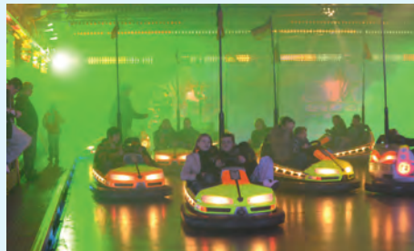
Vom Rummel nicht wegzudenken: Der Autoscooter

ben, während die Folgetage mit bestem, aber zunehmend kalten Vorwinterwetter glänzten. Nicht zu vermeiden und zu übersehen waren die Begleiterscheinungen