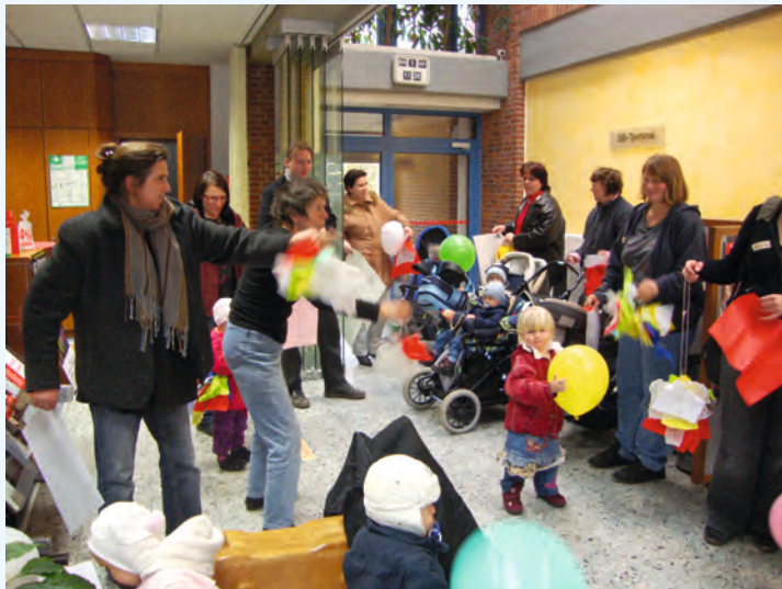
Staunen über immer neue Geräusche: Blitz und Donner aus Papier

Am 1. November fand das wöchentliche Treffen der AWO-Eltern-Kind-Gruppe „Mückie“ mal anders statt. Die Mitarbeiterinnen vom Kunstraum Tosterglope waren zu Gast und veranstalteten mit den kleinen und