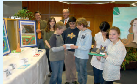
Schülerausstellung im Kassenraum der Volksbank Dahlemburg