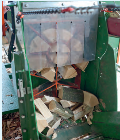
Gleichmäßig große Stücke lassen sich besser stapeln

des Holzes können drei bis acht Meter pro Stunde und mit variablen Schnittlängen von 20 - 45 cm verarbeitet werden. Transport und Lagerung erfolgen durch den Kunden.