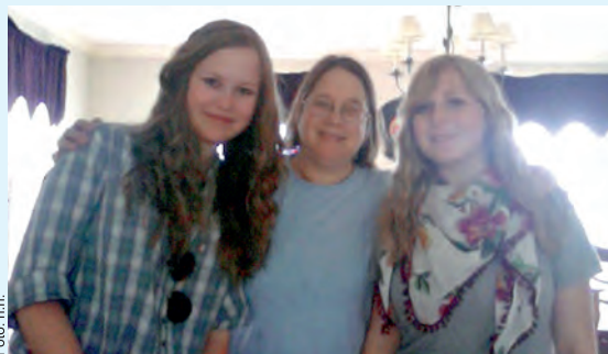
Meine Gastschwester (rechts), meine Gastmutter (Mitte) und ich

Ich wusste überhaupt nicht, was los war und fragte: „Can somebody tell me what the fuck is going on?“, jetzt schaute sogar der Klassenlehrer von seinem Buch auf, aus einigen Ecken hörte ich: „Oh no, she didn't!“, aus anderen: „She's going to go to