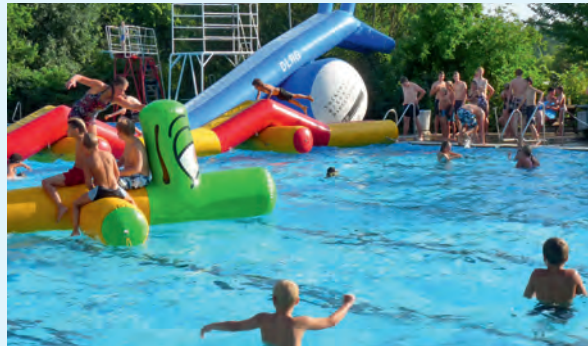
Dank der Hilfe des Fördervereins und aktiver Mithilfe wird das Freibad für Jung und Alt immer attraktiver.

Zusammen mit der Samtgemeinde ist es gelungen, die Großrutsche im Nichtschwimmerbecken zu verwirklichen. Im Jahr 2009 wurde ein Multifunktions-Spielgerät aufgebaut und in diesem Jahr eine Wasserhindernisbahn angeschafft. Aber auch die Sitzecken am Beckenrand haben die