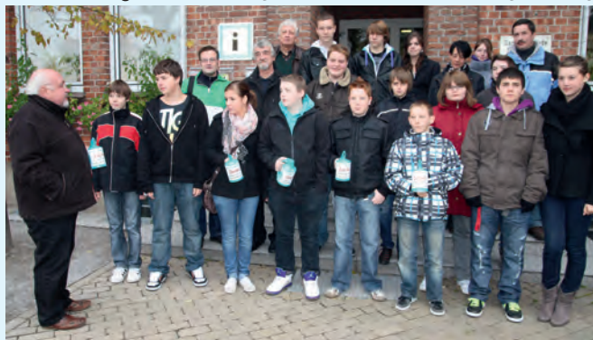
16 Jugendliche der Haupt- und Realschule Dahleburg (HRS) sammeln drei Stunden im Flecken für den Volksbund deutsche Kriegsgräberfürsorge und werden von Dahleburger Bürgern begleitet

Pischke erinnerte daran, dass noch vor einigen Jahren im Herbst regelmäßig