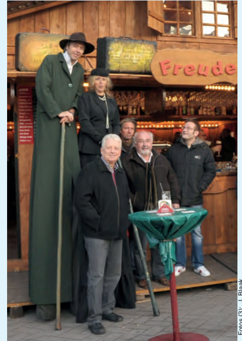
Die Stelzensippe behielt beim bunten Treiben den Überblick...

Mit seinen fast 50 Schaustellergeschäften trotzte der Jahrmarkt damit den eigentlich schlechten Wetterprognosen und musste nur am späteren Freitagabend mit heftigen Regengüssen auf dem Platz le-