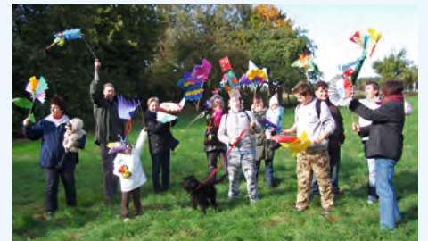
Aus dem Atelier ging es ins Freie zum „Pflanzen“