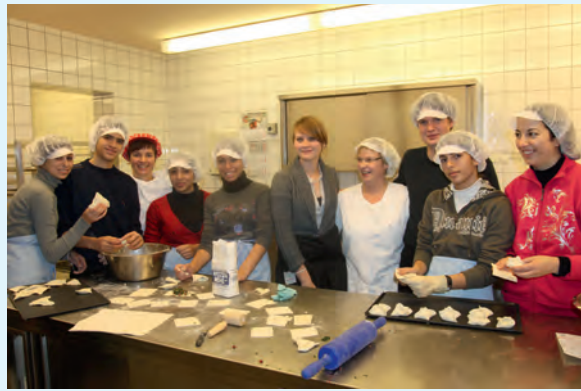
Alle, die mitgewirkt haben am Büffet

Gemeinsam kochen verbindet. Auf diese Aussage lässt sich die Freundschaft zwischen Schülern aus Israel und der Schule Marienau fokussieren, die auf Einladung der Schule Marienau im Rahmen eines Unesco-Projekts zu Besuch in Deutschland sind. Sie kochten gemeinsam mit Marienauern arabische Köstlichkeiten. Nicht für eine kleine Gruppe, sondern für 150 Personen. Ein fremdartiger, verführerischer Duft zog durch die Räume und machte