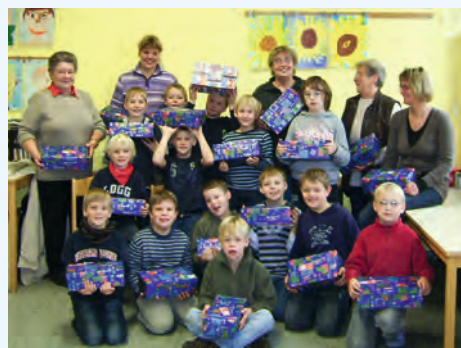
Die Schüler der 3. Klasse packten liebevoll Pakete für andere Kinder

Da war das Staunen bei den Schülern groß: Irgendwo auf dieser Welt gibt es Kinder, die sich über einen in Weihnachtspapier eingepackten Schuhkarton, über Zahnpasta, Handtuch, Kamm usw. freuen. Der DRK-Ortsverein Altenmedingen nahm auch in diesem Jahr an der Aktion „Weihnachten im Schuhkarton“ teil. Liebgewordene Tradition ist es, mit den Schülern der 3. Klasse der Grundschule Altenmedingen gemeinsam Schuhkartons zu packen. Zwanzig kleine Kisten wurden jetzt wieder liebevoll mit Dingen des täglichen Bedarfs (Kamm, Waschlappen, Zahnpasta usw.), Spielzeug, Süßem, Bekleidung und Schreibutensilien befüllt. Die Geschenke wurden vom Ortsverein gekauft, teilweise selbst gestrickt und kamen als Geschenk von der Volksbank Altenmedingen und dem VGH-Büro Norbert Selent. Jeder Schuhkarton hat einen Wert von ca. 20 Euro. Die Schüler dieser reinen Jungenklasse packten sowohl für Jungen als auch für Mädchen in den Empfängerländern und legten den