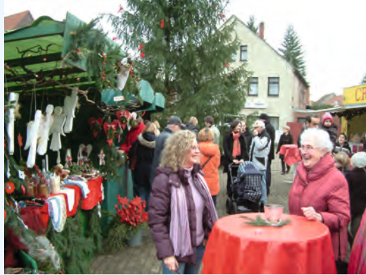
Die Besucher freuten sich über das große Angebot der Aussteller

In diesem Jahr übernimmt der „Förderverein Schwimmbad“ erneut die Bewirtung im Kaffeezelt. Gern sind weitere Vereine