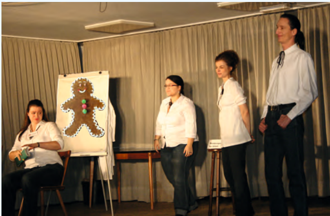
Teils bissige Alltagsanekdoten, komödiantisch verpackt, regten dennoch zum Nachdenken an