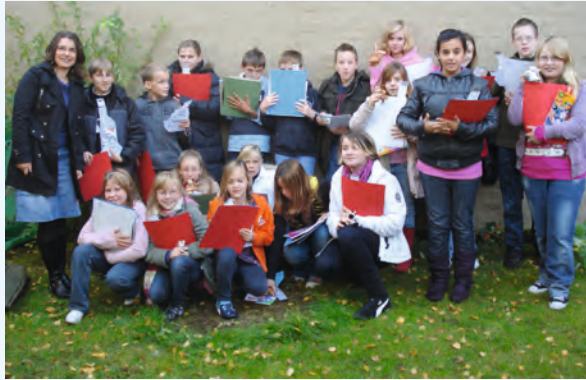
Geschafft, jetzt ist der Ranzen wieder komplett

weitere Spenden die Aktion mit anderen Klassen fortgeführt werden kann. Wer hier unterstützen mag durch kleine oder große Beiträge, meldet sich bitte bei AWO, Beate Schmucker, Tel. 05851 9445135.