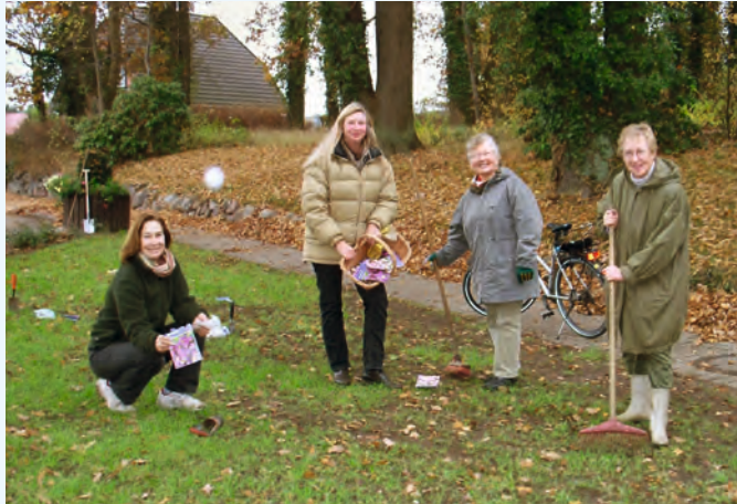
Trotz schlechten Wetters hatten die LandFrauen Spaß bei der Arbeit

Die Pflanzaktion der Dahlemburger LandFrauen, hervorgegangen aus dem ehemaligen Zukunftstag, hat auch schon den Ortskern mit 17 Kletterrosen samt Rankgittern sowie Buschrosen und Buchsbäum-