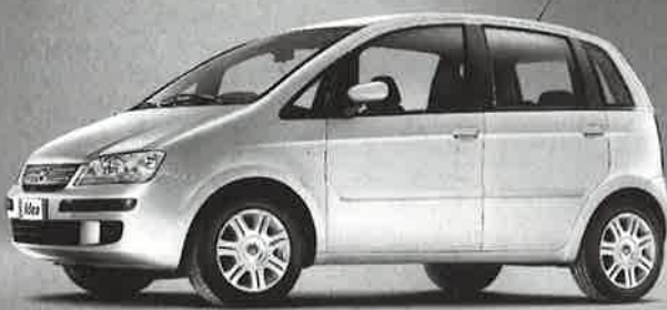
Abbildung enthält Sonderausstattung.