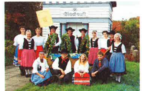
Dahlenburg präsentierte sich im Oktober 2003 auf dem Kopefest in Lüneburg