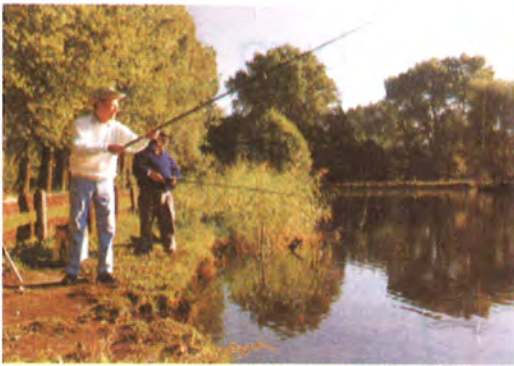
Aktivurlaub beim Angeln