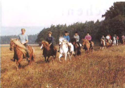
Reiten und die Landschaft genießen