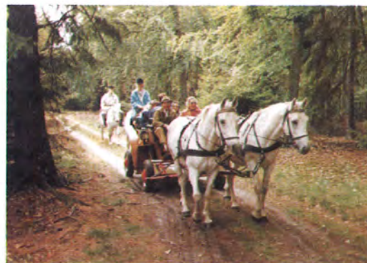
Kutschfahrten durch den Staatsforst Gohrde