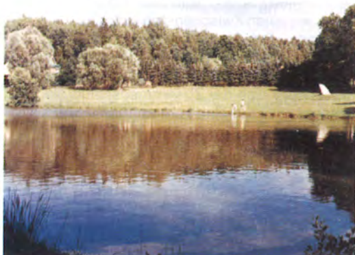
Die herrliche Umgebung entdecken