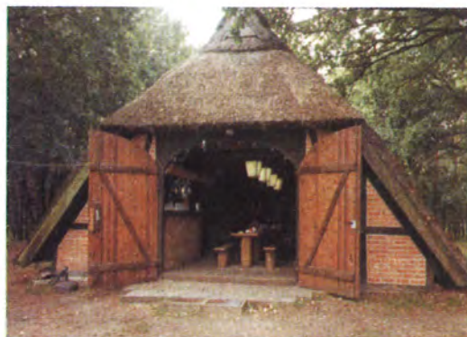
Schafstall in Ventschau