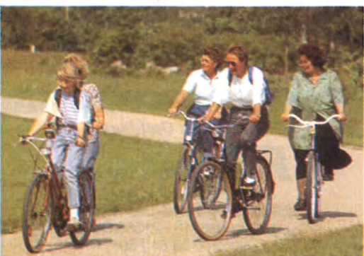
Mit dem Fahrrad die Umgebung erkunden