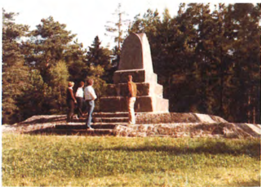
Denkmal der Gohrdeschlacht