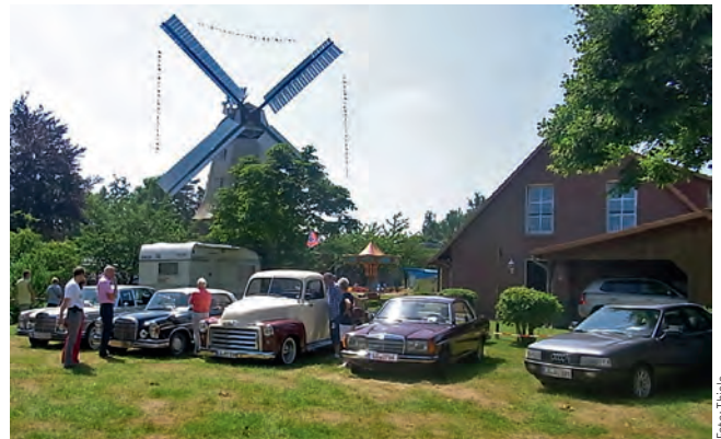
Der Chrom vieler „Oldies“ strahlte im Schatten der Mühle beim Oldtimerfest

Den Besucheransturm verdanken wir aber auch der Presse und dem Rundfunk, insbesondere der LZ, dem Kurt Viebranz Verlag und dem FFN, die im Vorwege ausgiebig über diese Veranstaltung berichtet hatten. Auf diese kostenlose Werbung sind wir angewiesen. Dafür noch einmal vielen Dank.