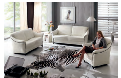
Markenmodell „VITTORIO“ Leder

SICH ETWAS GUTES LEISTEN UND DABEI AUCH NOCH SPAREN Schulenburg Polstermöbel – die Marke Ihres Vertrauens seit über 78 Jahren