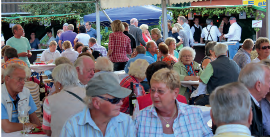
Gastronomen aus der Samtgemeinde laden zum Genießen und Entspannen ein

Auskunft beim Verkehrsverein Samtgemeinde Scharnebeck e.V., Marktplatz 1, 21379 Scharnebeck, Zimmer 1.02, Tel. 04136 90721. [ Claudia Sandow ]