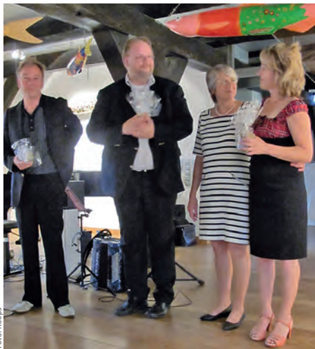
Dank für einen gelungenen Abend

„... sehr gastliche Atmosphäre und sehr gut besucht, Lüneburger Stinte und riesiges Fangnetz schaffen maritimes Ambiente, – passend zur Musik.“