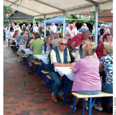
Stimmung mit Livemusik im Zelt

Verkehrsverein Samtgemeinde Scharnebeck e.V.