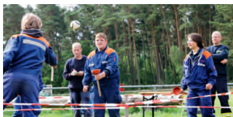
JF Brietlingen beim Lagerspiel

Die Jugendfeuerwehr Brietlingen fährt als einzige Jugendwehr aus der Samtgemeinde Scharnebeck zum Bundeszeltlager nach Königsdorf (Bayern), welches anlässlich des 50. jährigen Bestehens der Deutschen Jugendfeuerwehr ausgerichtet wird. Vom 2. – 9. August nehmen sieben Jugendliche und zwei Betreuer die ca. 775 km weite Strecke auf sich, um eine Woche am Zeltlager teilzunehmen. Wir freuen uns, ein Teil dieser großen Veranstaltung zu sein und an den ganzen Programmen zur Ju-