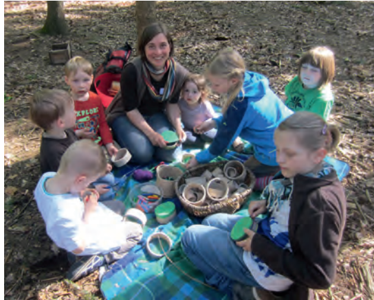
Für die kleinen Piraten gibt es im Wald immer etwas Neues zu entdecken

che führen. Die Kinder hatten bei vielen verschiedenen Aktionspunkten im Wald sehr viel Freude. Es wurden z. B. Schüttelbilder, kleine Handtrommeln gebastelt und einen Kinder-Seil-Fahrstuhl für die ganz Mutigen gab es. Auch im nächsten Jahr wird es wieder einen Tag der offenen Tür geben.