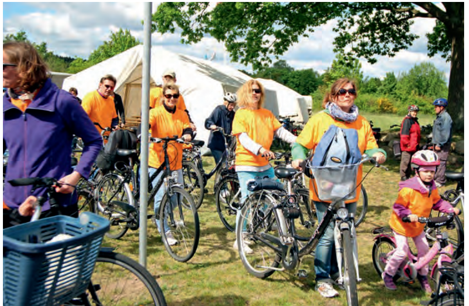
Gesamte Familien gehen bei der Tour de Marsch an den Start