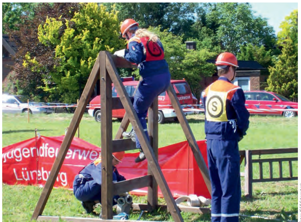
Das „Spiel ohne Grenzen“ verlangt von den Mannschaften Zusammenarbeit und Geschicklichkeit

Vom 20. – 22. Juni 2014 findet in Brietlingen das diesjährige Samtgemeindegeländelager statt. Gemeinsam mit den Jugendfeuerwehren der Einheitsgemeinde Adendorf zelten die Jugendlichen mit Ihren Jugendfeuerwehrwarten und Betreuern auf dem ehemaligen Turniergelände hinter der „Grünen