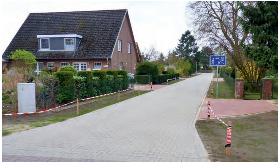
Der „Neue Weg“ in Echem

Wir wünschen den Anliegern viel Freude an der neuen Straße und bedanken uns für Ihre Geduld und Unterstützung.