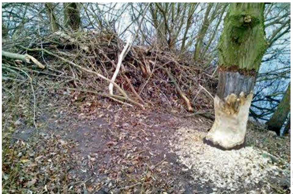
Biberburg hinter einem angenagten Baum an der Insel

Die Badegäste brauchen keinen Schrecken zu bekommen, wenn im Wasser neben ihnen ein kleiner Tierkopf auftaucht – die Biber halten Abstand und beißen nicht. Die Untere Naturschutzbehörde des Landkreises Lüneburg hat kein Nutzungsverbot zum Schutze der Tiere