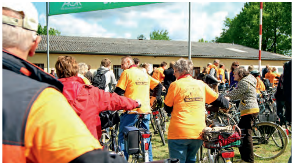
Die Teilnehmer sind gut an ihren „Tour de Marsch“-T-Shirts zu erkennen