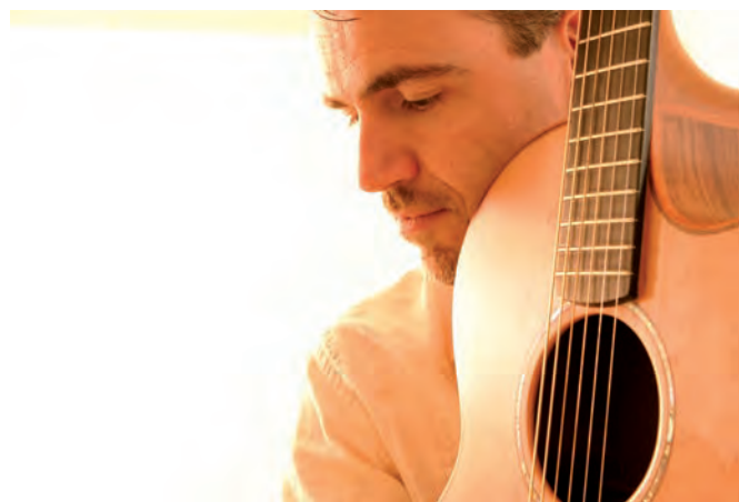
Side by Side

Allen zum Musizieren, dann entsteht dieser einzigartige Zauber, der die Seele streichelt.