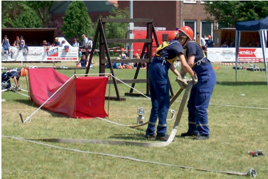
Beim „Bundeswettbewerb“ hat der Schlauchtrupp unter anderem dafür zu sorgen, dass die Schläuche für den Wassertransport gelegt werden

Zuschauer sind bei jeder Veranstaltung herzlich willkommen und neue Mitglieder werden gerne aufgenommen, egal ob bei der Kinder- oder Jugendfeuerwehr oder in der Einsatzabteilung. Sprecht einfach eine Feuerwehrkameradin oder einen Feuerwehrkameraden an oder informiert Euch auf der Homepage der Samtgemeinde Scharnebeck ( www.scharnebeck.de ).