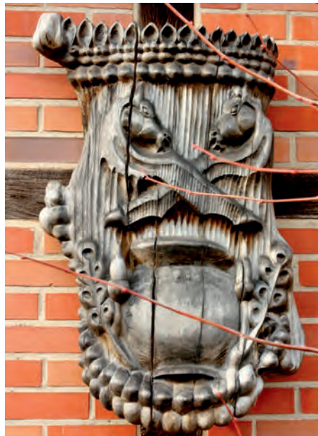
Das Gemeinde Wappen von Rullstorf wurde von Dirk Möhring geschnitzt

Die Jugendfeuerwehr Rullstorf hat mit Un-