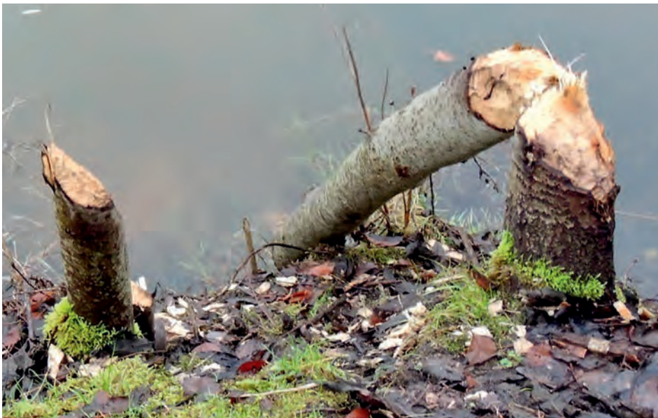
Vom Biber gefällte Bäume am Insee

ber am Scharnebecker Insee ganz unbemerkt vor einiger Zeit aufgetaucht und fühlen sich offensichtlich so wohl, dass sie sich schon fleißig vermehrt haben. Die erste Burg wurde vermutlich schon 2010 am Rande der Insel gebaut. Die ersten Bäume fielen in der kalten Jahreszeit, wie Bleistifte angespitzt in ca. 30 Zentimeter Höhe vom Erdboden.