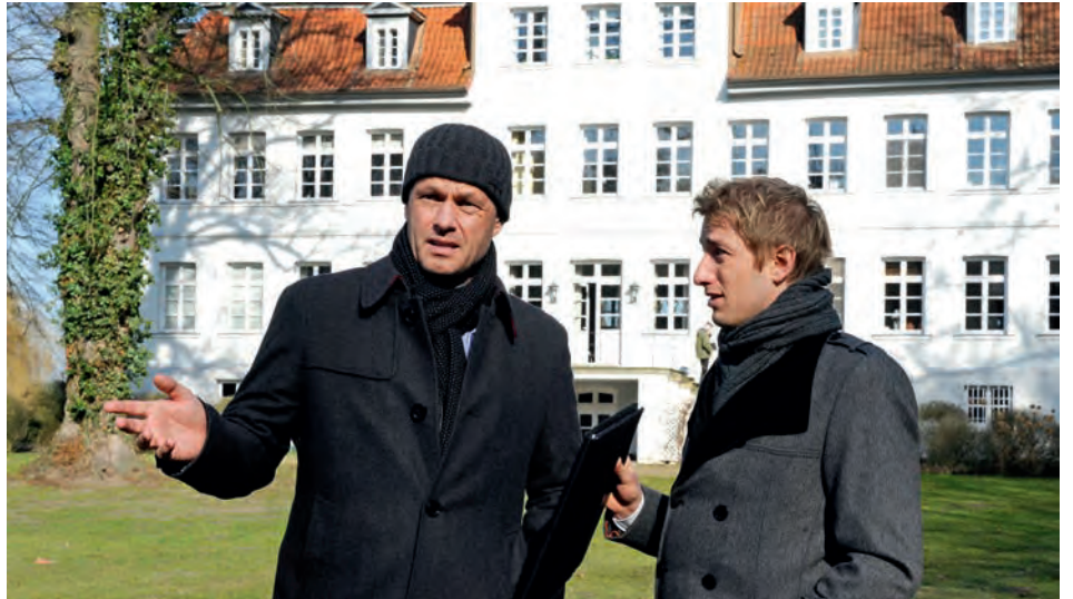
Dreharbeiten vor dem Herrenhaus in Lüdersburg

Für den freiwilligen Einsatz dankt die Verwaltung dem Ehepaar Brockmann-Wittich recht