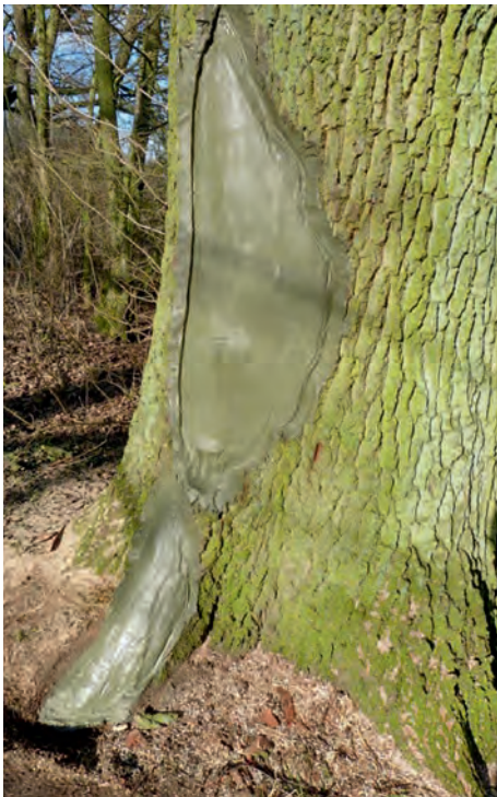
Beschädigte Eiche in Ahrenschulter

Bürger aus Ahrenschulter baten um Hilfestellung, was die Dorfbewohner, im Besonderen Familie Brockmann-Wittich aus Neu-Jürgentorf hörten. In Absprache mit der Gemeindeverwaltung wurden die Pflegearbeiten an der Eiche kostenlos und fachmännisch von ihnen