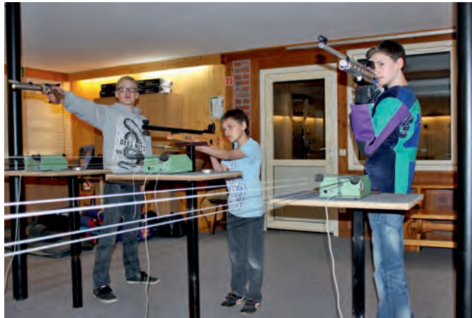
Unter Fachkundiger Anleitung lernen die Kinder und Jugendlichen den richtigen Umgang mit der Waffe

Aber weit gefehlt! Im Mannschaftssport addieren sich noch weitere Aspekte. Auch wenn man am Schießstand in erster Linie als Einzelschütze „seinen“ Wettkampf bestreitet, so bleibt doch im Hinterstübchen das Bewusstsein, dass da noch die Mannschaftsmitglieder sind, deren Ergebnis