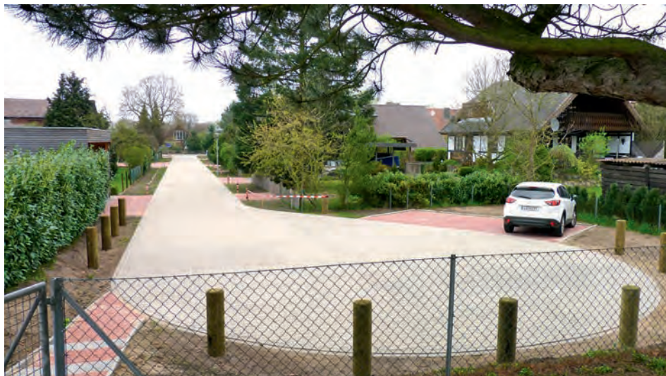
Die Straße „Neuer Weg“ mit Wendehammer

Der Rad- und Fußweg entlang der K53 innerhalb Echem's weist an einigen Stellen Schlag-