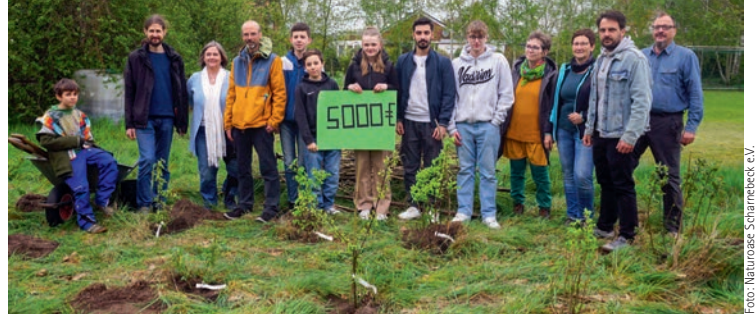
Freuen sich auf gemeinsame nachhaltige Projekte: Schülerinnen, Schüler und Lehrer der Oberschule Scharnebeck sowie Mitglieder der Naturoase Scharnebeck

Oberschule und sind schon ganz gespannt, welche Ideen Ihr noch für unsere Vereinsfläche - und vielleicht auch darüber hinaus - habt!“, so der Vorstand der Naturoase. Dies