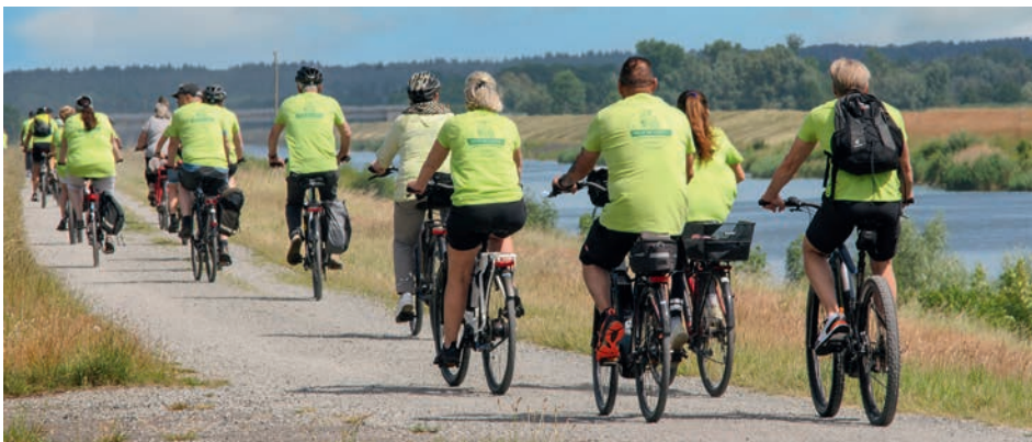
Am 26. Mai startet die 34. Tour de Marsch. Wird in diesem Jahr der Teilnehmerrekord von 2023 geknackt?