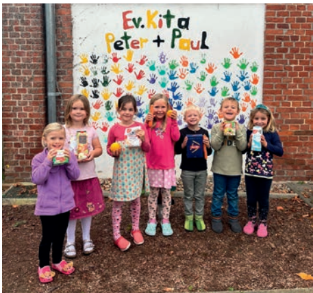
Fleißige Helfer der Kita Peter & Paul

Bereits seit September 2022 gibt es in Jürgenstorf eine engagierte Tafelgruppe, wel-