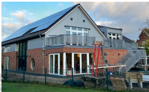
Durch den Anbau bieten sich der Kita neue Möglichkeiten

ten Geschoss ist zusätzlich eine Rutsche eingebaut worden. Der Kindergarten kann jetzt vier Gruppen mit je 25 Kindern und in der Krippe 15 Kinder aufnehmen. Auf dem Dach ist eine 25,08 KW Photovoltaikanlage für den Eigenverbrauch und zur Einspeisung entstanden. Die Heizung erfolgt mit einer Hybridheizung, zwei Wärmepumpen und zusätzlich einer Brennwertherme für den Altbereich im Winter. Zurzeit wird der vorhandene Altbereich umgebaut für Küche, Schlafraum, Essensraum-Aula, Büro und Personalräume. Die Gesamtfertigstellung einschließlich der Außenanlagen wird für Ende Dezember 2023 angestrebt. Einweihung und Tag der offenen Tür ist Samstag 6. April 2024.