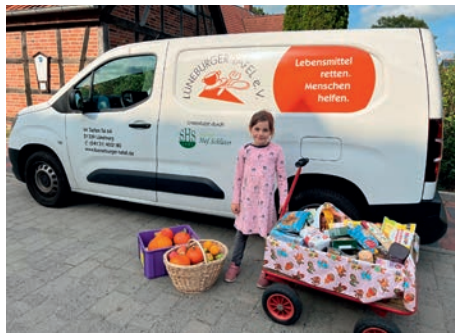
Spenden für die Lüneburger Tafel