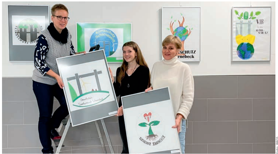
Beim Aufbau der Ausstellung