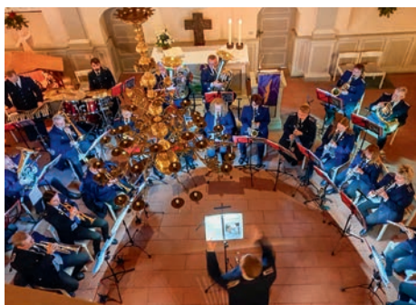
Der Musikzug der FFW Artlenburg stimmt musikalisch auf Weihnachten ein

[ Rolf Twesten ] Adventskonzerte des Musikzug der FFW Artlenburg. Am 1. Advent, Sonntag, 3. Dezember 2023, geht es um 15:00 Uhr los. Motto: „Weihnachten - Sing mit!“ Der Musikzug der Freiwilligen Feuerwehr Artlenburg in der St. Johanniskirche Lüneburg am Sande. Auch am 1. Advent, 17:00 Uhr, auf dem Lüneburger Weihnachtsmarkt draußen vor dem Rathaus zur Einstimmung auf das Weihnachtsfest.