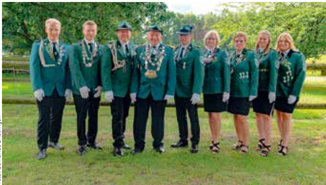
Das Königsteam 2023

Nach kurzem Frischmachen in den Unterkünften ging es dann schon wieder weiter, zur Teilnahme am „Picknick für Senioren“ in Łekno. Hier gab es zahl-