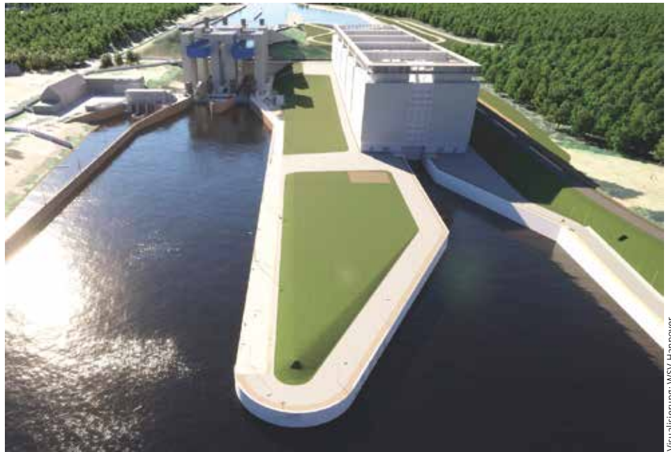
Visualisierung: WSV Hannover

Die neue Schleuse Lüneburg wird westlich in einem lichten Abstand von 60 m zum bestehenden Schiffshebewerk errichtet, um den Betrieb des Hebewerkes während des Baus und auch nach deren Inbetriebnahme nicht zu beeinträchtigen. Mit einer Nutzlänge von 225 m und einer Kammerbreite von