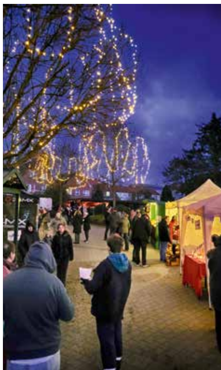
Der Winterzauber 2022 war eine gelungene Veranstaltung und begeisterte die zahlreichen Besucher

Für die Kinder wird es ein Kinderkarussell geben. Die AWO, die Kinder- und Jugendfeuerwehr Dahlenburg sowie die Oberschule „Am Dorn“ haben Aktionen vorbereitet. Eine Tombola wird viele Überraschungen bereithalten und das E-Werk hat sich noch etwas ganz Besonderes einfallen lassen.