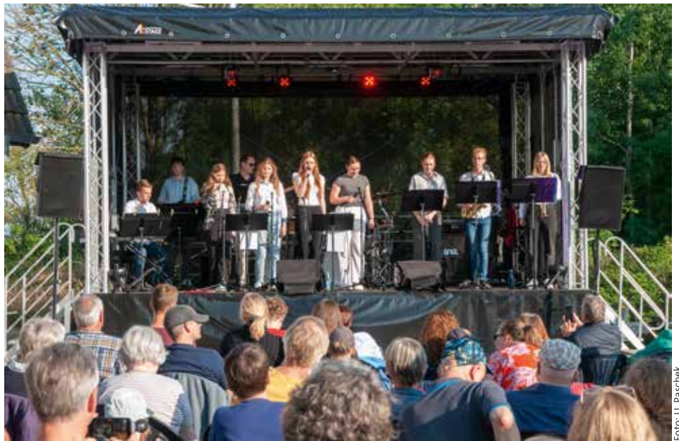
Die Band des Bernhard-Riemann-Gymnasiums präsentierte ein abwechslungsreiches Musikprogramm

[ Ulrich Paschek ] Rock, Pop, Rhythm & Blues und Soul in Scharnebeck? Diese Reise quer durch die musikalischen Genres konnten gut 220 Besucher am 23. Juni am Insee unternehmen - und sie waren begeistert.