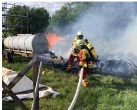
Feuerwehren sind unverzichtbar

bäumen in unserem Gemeindegebiet, welche die Gemeinde dieses Jahr pflanzen ließ. Seit Mai mussten unsere Gemeindearbeiter in Abständen die Bäume wässern, dankenswerterweise auch mit Unterstützung unserer