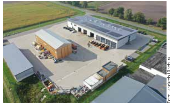
Seit 2020 ist der kreiseigene Betrieb Straßenbau und -unterhaltung auf einem neuen Betriebshof in Scharnebeck ansässig

Zudem gibt es Verkaufsstände mit Speisen und Getränken, unter anderem von der Freiwilligen Feuerwehr Artlenburg. Für die Kleinsten wird es eine Hüpfburg geben. Auch für musikalische Begleitung ist gesorgt.