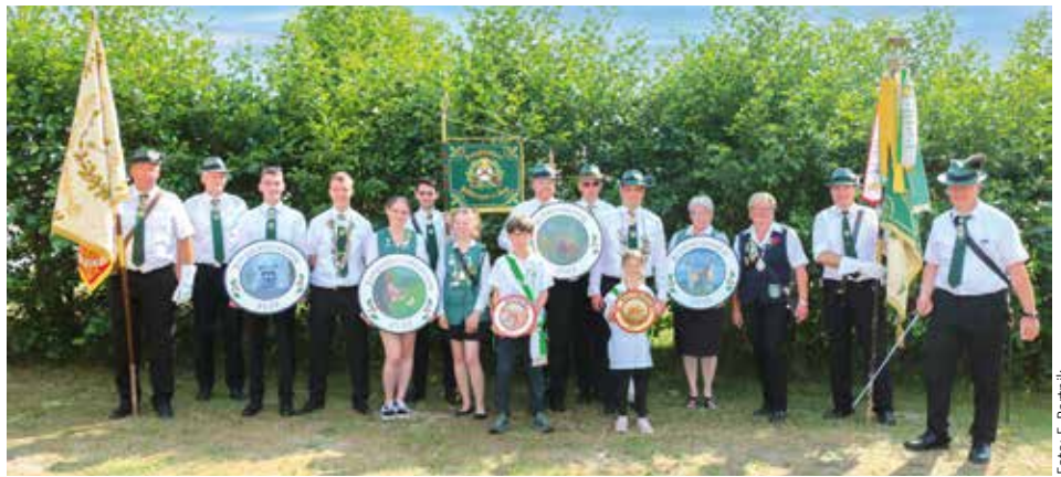
Das Königsteam 2023 des Schützenvereins Hittbergen

Am Abend folgte der Schützenball, tradi-