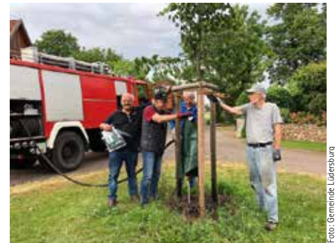
Wassersäcke helfen beim Bewässern der Bäume

Klimaschutz wird heute nicht mehr nur als Herausforderung, sondern auch als Chance gesehen. Für interessierte Bürger findet unter der Leitung von Herrn Carl Sasse, Klimaschutzmanager der Samtgemeinde Scharnebeck, am 31.08.2023 um 19:00 Uhr im