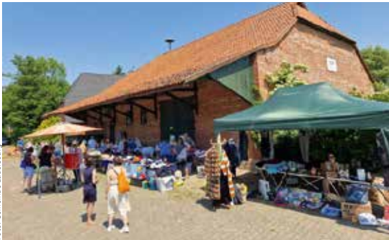
Flohmarkt auf dem Sommerfest der FF Jürgenstorf