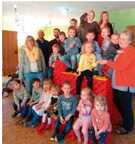
Die X-Blöcke wurden begeistert angenommen

Kaum waren die X-Blöcke zum Spielen freigegeben, fingen die Kinder sofort mit dem Bauen und Experimentieren an. Diese haben einen hohen Aufforderungscharakter und