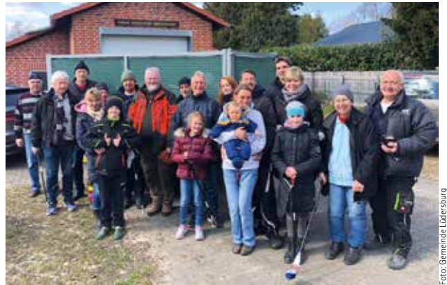
Große und kleine Helfer kamen zur Müllsammelaktion

Zur Müllsammelaktion im Gemeindegebiet am 25. März fanden sich viele Helfer, ob