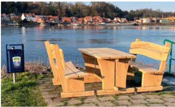
Die neue Bank an der Elbe

Der Elbestammtisch von 2012 hat der Gemeinde zwei neue Bänke mit Tisch aus Holz gestiftet. Die neue Sitzgelegenheit kann an unserer Elbpromenade genutzt werden. Hier nochmal vielen Dank an den Elbestammtisch!