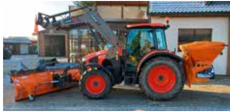
Neuer Traktor für den Hohnstorfer Winterdienst

Pünktlich zum Wintereinbruch im November 2022 lieferte die Firma Zeyn aus Sassendorf den bestellten Traktor an uns als Gemeinde aus. Von November bis März wird der Traktor für den Winterdienst in unserer Gemeinde in Bereitschaft stehen, in den Sommermonaten wird er den Bauhof als neues Fahrzeug unterstützen.