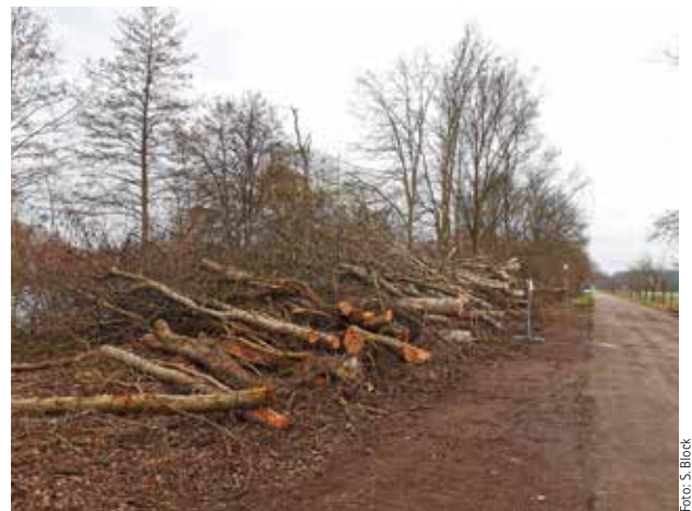
Baumschnitt- und fällungen am Parkplatz Inselsee

Gespräche mit dem Landkreis sind in Vorfeld abgestimmt und befinden sich nun in der Umsetzung. Das Parken auf dem Seitenstreifen wird zukünftig nicht mehr möglich sein. Es kam leider zu häufig vor, dass Rettungsfahrzeuge und auch landwirtschaftliche Fahrzeuge große Schwierigkeiten hatten, die Straße zu passieren. Es wird gerade daran gearbeitet den großen Parkplatz besucherfreundlich herzurichten. Dafür wurde Gestrüpp geschlegelt, neue Durchgänge geschaffen und viele nicht