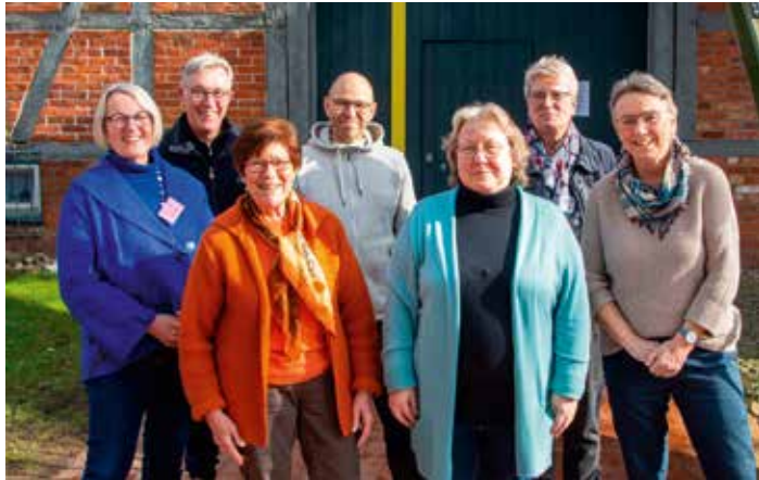
Das Team des B-Kleidungs-Treffs mit Bürgermeister Stefan Block (Mitte)

[ Alexandra Cyrkel ] Ein ganz neues „Kaufhaus“ hat das Team des B-Kleidungs-Treffs im Februar geöffnet: In der Bardowicker Straße 2 sind die Regale gefüllt mit Haushaltswaren. Geschirr und Besteck, Gläser Töpfen und Pfannen im besten Alter werden dort zu günstigen Preisen verkauft. Auch Handtücher, Tisch- und Bettwäsche sind im Angebot. Die Gemeinde Scharnebeck hat einen Teil der großen Scheune hinter dem Rathaus kostenlos für den guten Zweck zur Verfügung gestellt: „Man muss sich gegenseitig helfen, das ist ein Naturgesetz“, betont Bürgermeister Stefan Block mit den Worten des französischen Schriftstellers Jean de la Fontaine.