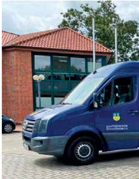
Der Dörferbus der Samtgemeinde Scharnebeck erhöht die Mobilität im ländlichen Raum

[ Fabian Freudenberger ] In ländlichen Regionen ist der öffentliche Personennahverkehr oft mangelhaft oder erst gar nicht vorhanden. Ein Dörferbus kann hier eine wichtige Verbindung darstellen, um die Mobilität und Unabhängigkeit der Bürgerinnen und Bürger zu erhalten.