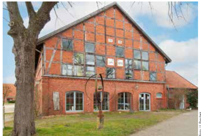
Ein markantes Gebäude: Das Scheunencafé in Hittbergen

Biker sind willkommen, wenn am 10. Juni ein Workshop „Erste Hilfe beim Motorradfahren“ stattfindet.