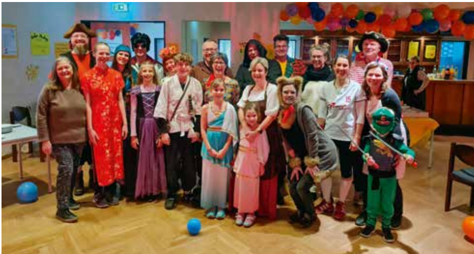
Nach drei Jahren coronabedingter Pause konnte endlich Kinderfasching in Hittbergen gefeiert werden

[ Andrea Galla ] Drei Jahre sind seit unserem letzten Kinderfaschingsfest in Hittbergen vergangen. Corona gibt es immer noch, wir durften aber endlich wieder feiern und alle dazu