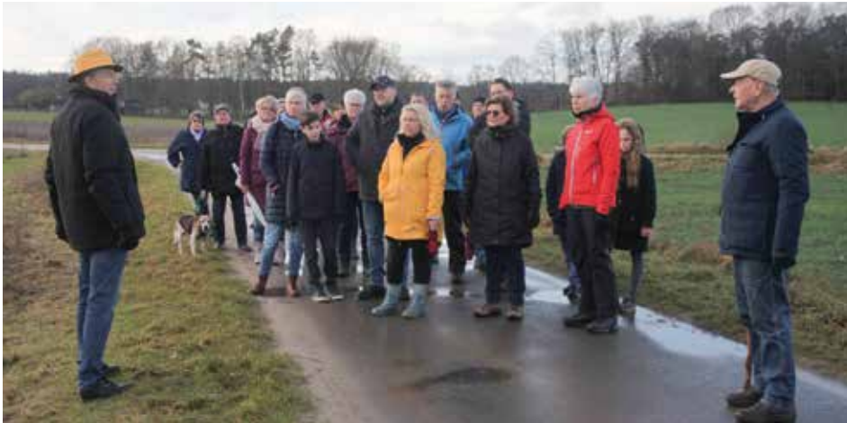
Die Wanderung des Bürgervereins war angereichert mit geschichtlichen Informationen

[ Katrin Glormes ] Als erster offizieller Termin 2023 fand am 8. Januar 2023 die jährliche Neujahrswanderung des Bürgervereins Rullstorf statt.