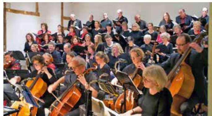
Weihnachtsoratorium Bach 2019 in Sassendorf

Dort proben seither die über 80 Mitglieder in neun Ensembles: Chor, Orchester, Big Band, Fiddlers In The Baar,