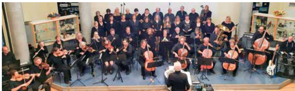
Chor und Orchester 2019 in Boizenburg „Soundtrack“-Konzert