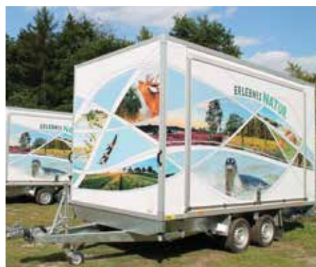
Ein Mobil für Vermittlung von Umwelt- und Naturschutzwissen

Die Freude war groß, endlich das fertige Entdeckermobil am 03.09.2022 in Empfang nehmen zu können. Natürlich wurde vor Ort gleich alles auf Herz und Nieren geprüft und ausprobiert. Nun wartet das Entdeckermobil mit seinem Team auf die ersten aufregenden Einsätze. Fragt uns vom AVS einfach an.