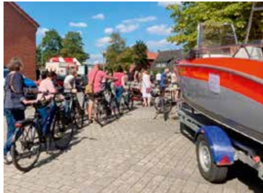
Die Fahrradkodierung wurde gut angenommen

warten. Der Dachsbier-Stand war stets gut besucht und hat für rege Unterhaltungen gesorgt. Die Handwerkerschaft und die DLRG hatten alle Hände voll zu tun, sämtliche Bratwurst- und Pommeswünsche zu erfüllen. Der Angelverein hat uns mit duftender Räucherware und leckeren Fischbrötchen verwöhnt. Auf dem Dorfplatz hatten die Kinder ihr Reich und konnten sich beim Kinderflohmarkt und Aktionsständen unserer SVS austoben. Auch wenn ich nicht alle Teilnehmer:innen anführen kann, alle waren wichtig, um dem Fest den richtigen Rahmen zu geben. Es war ein große Freude für mich Scharnebeck so lebendig und fröhlich zu erleben.