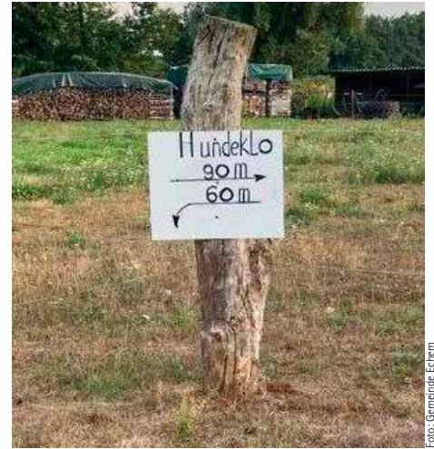
Die Beseitigung der Hinterlassenschaft seines Hundes sollte selbstverständlich für jeden Hundebesitzer sein

Zum Schluss zum wiederholten Male ist der Hinweis notwendig, dass die Gemeinde inzwischen zehn Hundetoiletten im Dorf aufgestellt hat. Dennoch gibt es immer wieder Zeitgenossen, die davon keine Notiz nehmen und die Hinterlassenschaft ihres Hundes ignorieren. Die Stinkbomben in den Sei-