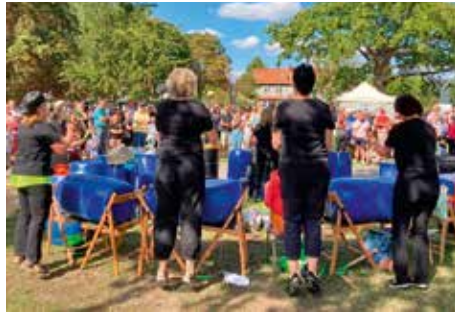
Lüneburger Schrotttrommler in Aktion

Auch unser Dorffest konnte bei bestem Wetter stattfinden und hat allen Beteiligten einen großen Spaß gemacht. Auch einen ganz großen Dank an all die vielen Helfer:innen, die das Dorffest organisiert und auch während des Festes für einen reibungslosen Ablauf gesorgt haben. Der Mix war stimmig, es war für jeden etwas dabei und genügend Verweilstellen hatten wir überall aufgebaut und diese wurden auch dankend zum Klönschnack angenommen. Clown, Hüpfburg, Schrotttrommlerinnen und Zumbatänzerinnen haben dem ganzen Fest noch den besonderen Kick gegeben. Am Waffelstand und dem Sonny-Eiswagen war immer eine Schlange zu sehen. Es hat sich gelohnt zu