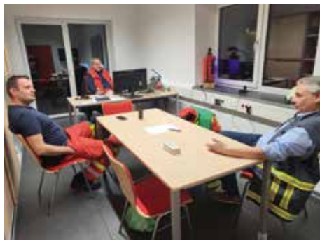
Kommunale Einsatzleitung in Hohnstorf

Um die Feuerwehreinsatz- und Rettungsleitstelle in Lüneburg zu entlasten, wurde die Kommunale Einsatzleitung (KEL) der Samtgemeindefeuerwehr Scharnebeck eingerichtet. Mit Sitz im Feuerwehrhaus Hohnstorf werden von dort aus alle Einsätze der Samtgemeinde Scharnebeck koordiniert. Hilfeersuchende wählen mit dem Telefon weiterhin die Notrufnummer 112 und landen in der Leitstelle in Lüneburg. Diese übermittelt die Einsatzdaten an die KEL in Hohnstorf.