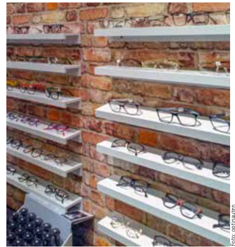
Bei der großen Auswahl an Brillengestellen ist für jeden etwas dabei

Als Familienbetrieb setzen die [optinauten] neben transparenten Preisen auf eine gute, ehrliche Beratung mit vielschichtigen, interessanten Marken. So zeichnen sich die RAXX/