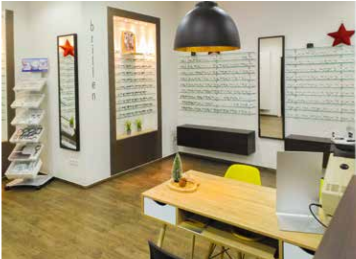
Ein freundliches, modernes Ambiente erwartet Sie