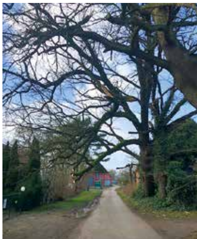
Mehrere Bäume hielten dem Sturm nicht stand

18:00 Uhr bis 19:02.22 gegen 4:00 Uhr mit mehreren Einsätzen durch die Gemeinde Lüdersburg.