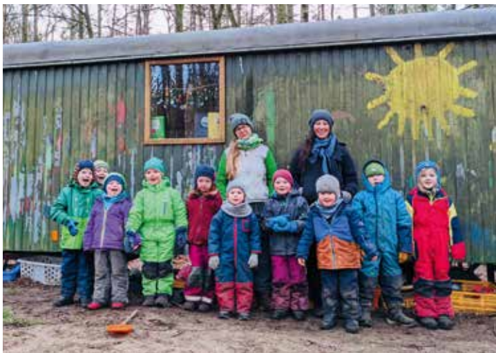
Der Bauwagen kann endlich einen neuen Anstrich erhalten

Doch die vielen Waldjahre haben sichtlich