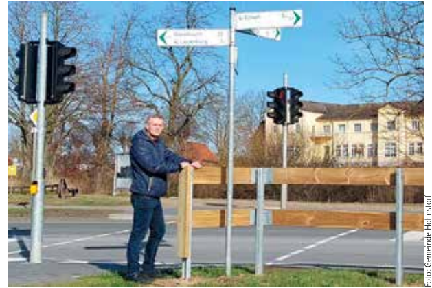
Bürgermeister Dirk Lindemann am Zaun im Sichtfeld

Im Gemeindebüro hatten wir vermehrt Beschwerden von Anwohner bekommen wegen der schlechten Sicht im Kreuzungsbereich L219/Triftweg.