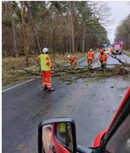
Die drei Sturmtiefs im Februar forderten die Feuerwehren der Samtgemeinde

Neben den wetterbedingten Einsätzen wurde die Feuerwehr zusätzlich zu ausgelaufenem Schiffsdiesel und einer ausgelösten Brandmeldeanlage am und im Scharnebecker Schiffshebewerk alarmiert. In beiden Fällen musste die Feuerwehr glücklicherweise nicht tätig werden.