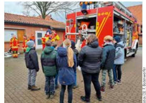
Die Jugendfeuerwehr bietet ein attraktives Programm

Die Jugendfeuerwehr trifft sich immer am Mittwoch um 18:00 Uhr.