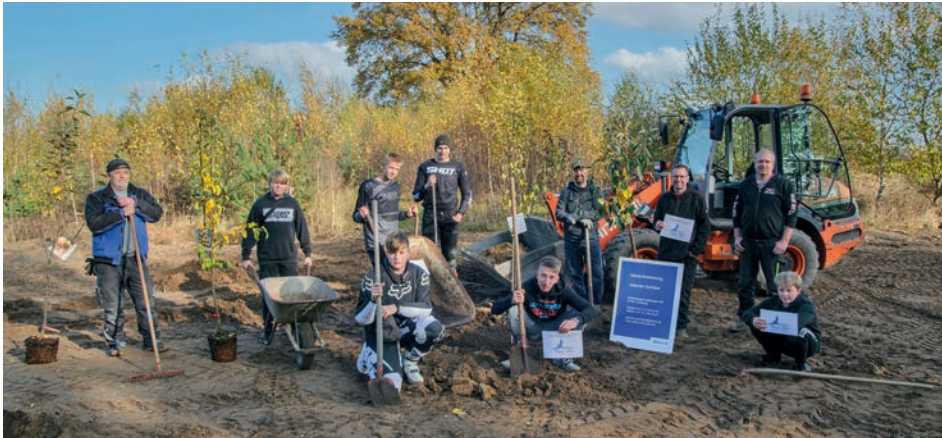
Mit großer Begeisterung und tatkräftiger Unterstützung der Eltern setzten die Rullstorfer Jugendlichen das Projekt Streuobst- und Blumenwiese um

[ Joachim Schöbel ] Die Mountainbiker der Dorfjugend Rullstorf wollten gerne etwas für die Umwelt tun und haben sich Anfang des