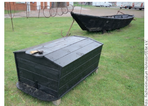
Nachbau eines Hütefasses im Freigelände des Museums an der Schulstraße 1

Mehr Informationen zur Elbfischerei und zum Verein Fischereimuseum Hohnstorf/Elbe e. V. finden Sie auch unter www.fischereimuseum-hohnstorf.de .