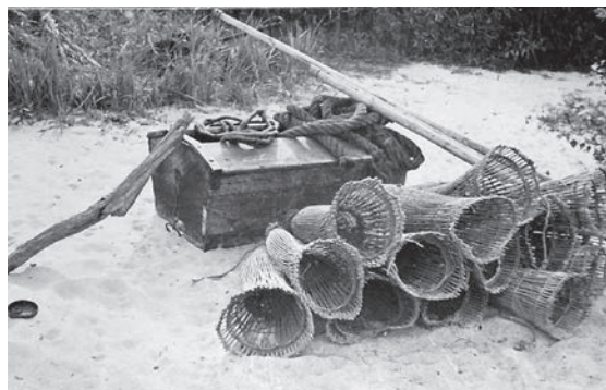
Eine historische Aufnahme eines Hütefasses, im Vordergrund Fischreusen

Konstruktionsbedingt konnte insbesondere bei älteren Fischerbooten keine Bünn eingebaut werden. Zum einen, weil sie wesentlich kleiner waren als moderne Boote, zum anderen, weil sie noch aus Holz gebaut waren. Ein Exemplar die-