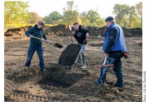
Der Arbeitseinsatz machte allen großen Spaß

Es wurden rund 14 Obstbäume in verschiedenen Sorten und Größen gepflanzt. Weitere Sträucher und die Blumenwiese für die Bienen werden noch angelegt, damit hoffentlich im Frühjahr eine bunte Pflanzenvielfalt zu blühen beginnt.