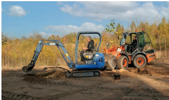
Mit schwerem Gerät wurde das Areal vorbereitet

Jahres bei einem Arbeitseinsatz auf ihrer Bahn dafür entschieden, gemeinsam mit ihren Eltern eine Streuobst- und Blumenwiese auf ihrem Gelände anzulegen.