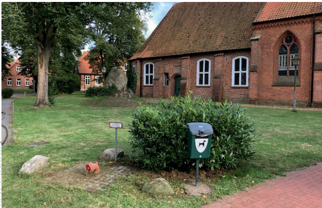
Zwei weitere Hundekot-Behälter sind aufgestellt worden

Für die kommende Zeit bleiben Sie gesund. Ihr Bürgermeister Klaus Bockelmann