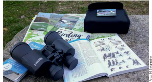
Mit der richtigen Ausstattung geht es zum „Vogelkieken!“

der es werden will, die wichtigsten Stellen und Arten zur Vogelbeobachtung vorstellt. Außerdem kann man ab sofort ein sog. „Birding-Kit“ in der Tourist-Information ausleihen. Dieses besteht aus einem hochwertigen Fernglas und einem Vogelbestimmungsbuch. Ausgegeben