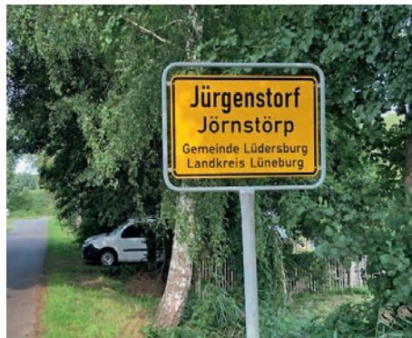
Ein neues Ortsschild steht in der Bäckerstraße

Für die Gemeindearbeiter bedeutet dies zusätzliche Aufgaben, die erledigt werden müssen. Zur Finanzierung wird die Gemeinde die