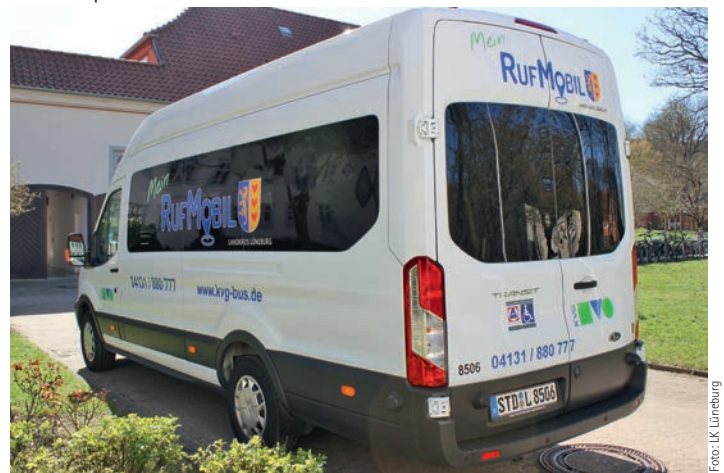
Bestellen-Fahren-Ankommen: das RufMobil jetzt auch in Scharnebeck

Das RufMobil ist im 2-Stunden-Takt unterwegs, innerhalb der Woche von circa 5 bis 21 Uhr und am Wochenende von etwa 8 bis 19 Uhr. Die neuen Linien ermöglichen einen Anschluss an die regionalen Hauptlinien, damit auch an Lüneburg und den Metronom nach Hamburg. „In den kommenden Wochen werden wir noch ein wenig am Konzept feilen, um es dann zu veröffentlichen. Anschließend können die ersten Fahrten bestellt werden“,