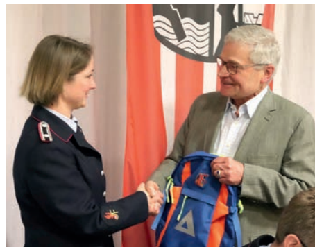
Freude über die neuen Rucksäcke