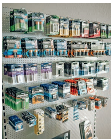
Batterien in großer Auswahl sind vorrätig