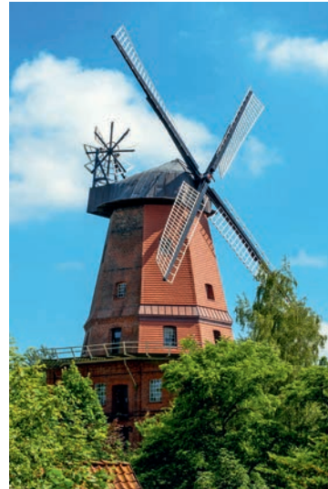
Mühle in Hittbergen

Auch im Jahr 2020 werden wieder Osterfeuer in unserer Gemeinde stattfinden. Schauen Sie doch einfach mal vorbei und unterstützen Sie durch Ihre Teilnahme die