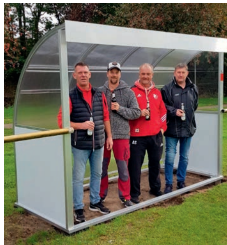
Zwei Wetterschutzkabinen wurden in Eigenleistung errichtet

Bauch-Beine-Baby Eine sportliche Abwechslung im Mama-Alltag gibt es jetzt dienstags um 9:00 Uhr in der Sporthalle am Elbdeich. MAMAfitness bietet ein ausgewogenes Fitnessprogramm aus sanftem Ausdauertraining und Kräftigungsübun-