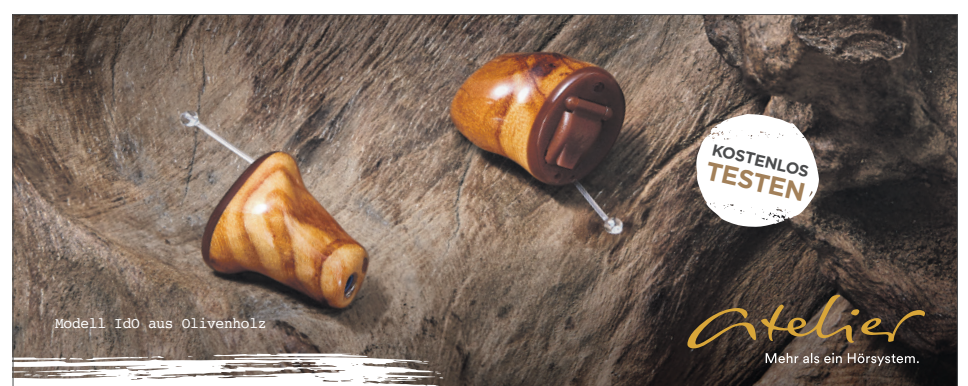
Modell Id0 aus Olivenholz