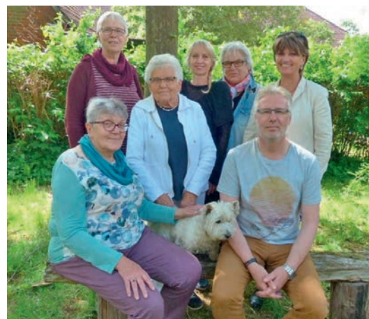
Die HelferInnen der Mittwochsgruppe, das Team umfasst insgesamt ca 30 HelferInnen