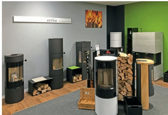
Größer und attraktiver: Blick auf einen Teilbereich der neuen Ausstellung

Der Ofen- und Luftheizungsbauerbetrieb hilft Ihnen gern auch bei der Nach- oder Umrüstung von