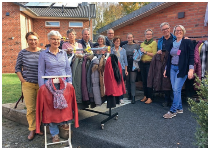
Das Team des B-Kleidungs-Treffs freut sich über Besuch

[ A. Cyrkel ] Gemütliche Kleidung, warme Schuhe, ein schickes Kleid für den Silvesterball und auch kleine Geschenke für die Weihnachtszeit – die Auswahl im B-Kleidungs-Treff ist groß. Alles ist gebraucht – aber gut in Schuss und flott zu tragen.