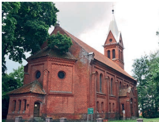
Die Kirche in Warpuny mit neuem Turm

und konnten bereits im Juni abgeschlossen werden. Im Anschluss daran werden an drei Stellen noch morsche Balken im Dachstuhl ausgetauscht und die kaputten Dachpfannen ersetzt, so dass vor dem Winter das Kirchendach dicht ist. Die Mittel für diese zusätzlich