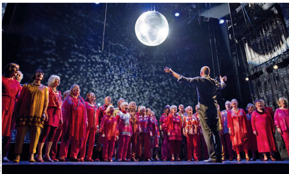
Der Chor „Heaven can wait“ kommt nach Scharnebeck