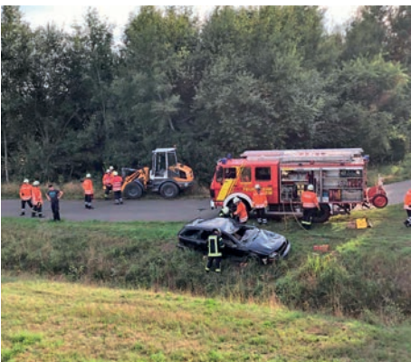
In Artlenburg wurde realitätsnah geübt

Auch in diesem Jahr wurde der jährliche „Schrottplatztag“ in Artlenburg ausgerichtet. Die Feuerwehren aus Scharnebeck, Artlenburg und Echem, die über hydraulischen Rettungsgeräte verfügen, konnten wieder realistische Unfallszenarien üben.