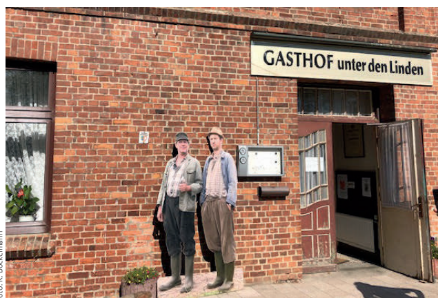
Besuch beim Drehort von „Neues aus Büttengewarden“ Lütjensee bis nach „Büttengewarden“.

Für das leibliche Wohl war bestens gesorgt und das Wissenswerte von den besuchten Zielen übermittelte ein erfahrener Reiseleiter. Zufrieden und voller neuer Eindrücke kehrten alle Teilnehmer am Abend nach Jürgenstorf zurück.