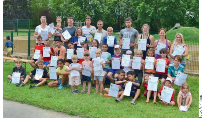
Viele errangen das Mehrkampfabzeichen der Leichtathletik

Ein erfolgreiches Sportfest wäre ohne die