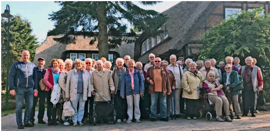
Eine fröhliche Gesellschaft besuchte auf Einladung der Samtgemeinde die Heide