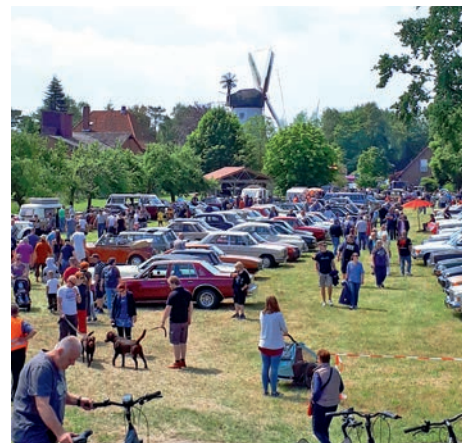
Oldtimertreffen im Schatten der Mühle

Vorstand und Festausschuss des Windmühlenvereins haben vor zwei Jahren Kritik aufgenommen und Veränderungen herbeigeführt. So hat sich um das leibliche Wohl nun ein professioneller Stand gekümmert, was mehr als gut angekommen ist. Zum einen hat die Firma Isermann aus Kirchzellern zwei Verkaufswagen aufgebaut und zum zweiten Mal war die „Seemannskiste“ aus Gülzow mit Fischbrötchen und Räucherfisch dabei.