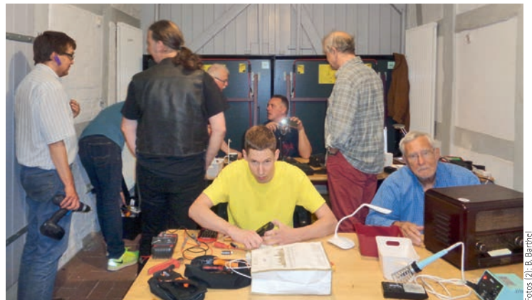
Im Repair-Café Scharnebeck werden im Schnitt 20 Geräte pro Veranstaltung repariert

die Organisation (Vorbereitung, Nachbereitung, Bestellung von Ersatzteilen, Telefonate mit „Kunden“, Buchführung etc.) wird von fünf Akteuren gestemmt. Im Café zaubern vier Feen die ansprechende Atmosphäre. Im Schnitt werden pro Samstag 20 Geräte verarztet, überwiegend aus dem Bereich Elektrohaushalt und Garten (z. B. Lampen, CD-Player, Videorecorder, Toaster, Bohrmaschinen etc.), weniger, aber auch Uhren, Nähmaschinen, Fernseher, Smartphones; alte Röhrenradios