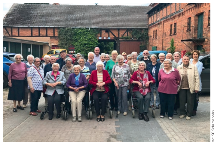
Die Senioren aus der Samtgemeinde verlebten einen schönen Tag in Salzwedel