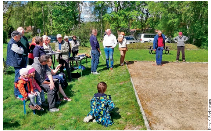
Das Boulespiel erfreut sich wachsender Beliebtheit

Auf einigen Abschnitten unserer Ortsstraßen besteht diesbezüglich dringender Hand-